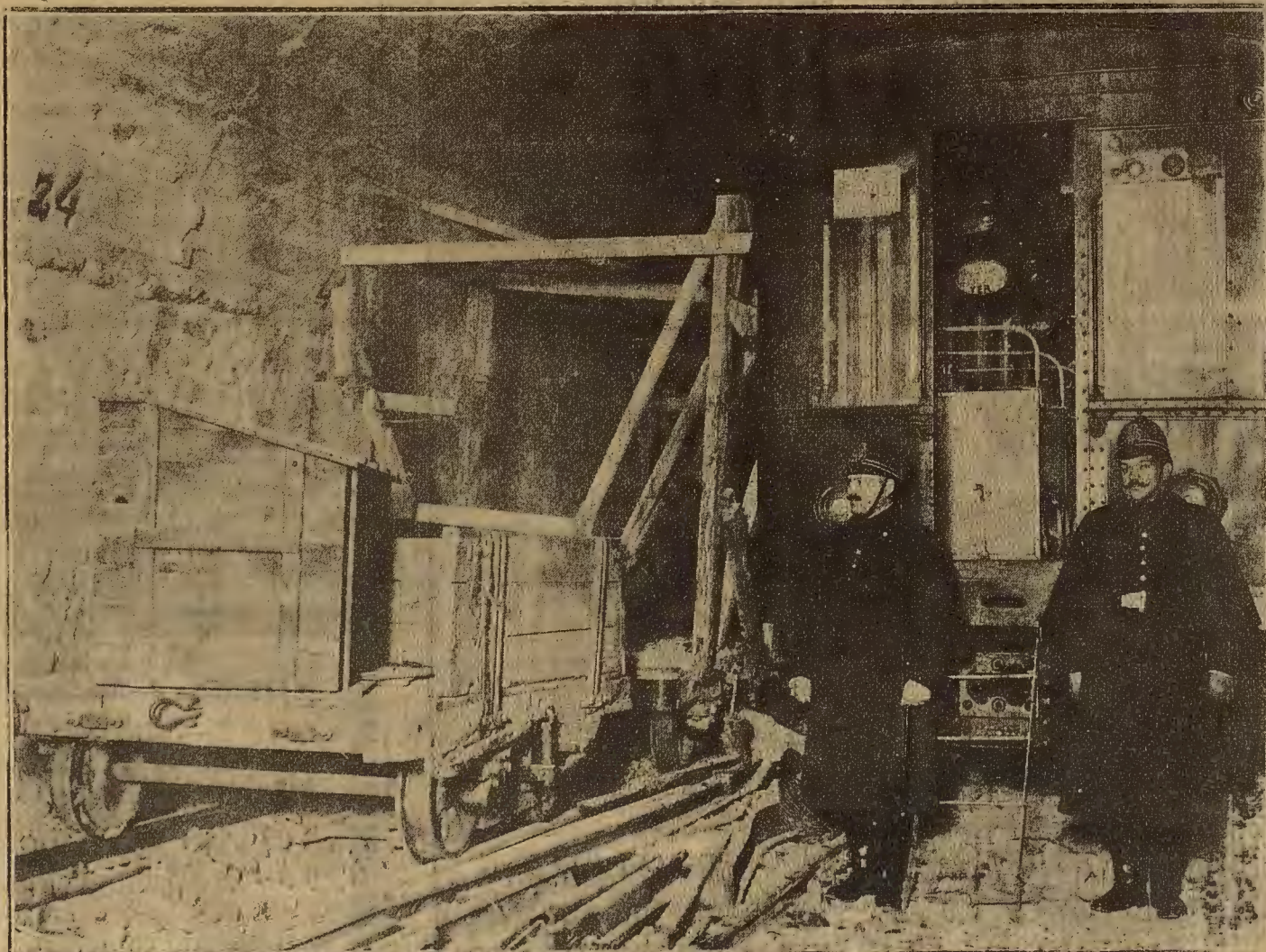
MADRID: DEL ACCIDENTE OCURRIDO EN EL METROPOLITANO.—UN COCHE DEL TREN QUE SE ESTRELLÓ CONTRA EL MURO DE CONTENCIÓN EN LA ESTACION DEL NORTE

NO OLVIDE USTED LOS MENUS ESPECIALES DE JUEVES Y DIAS FESTIVOS