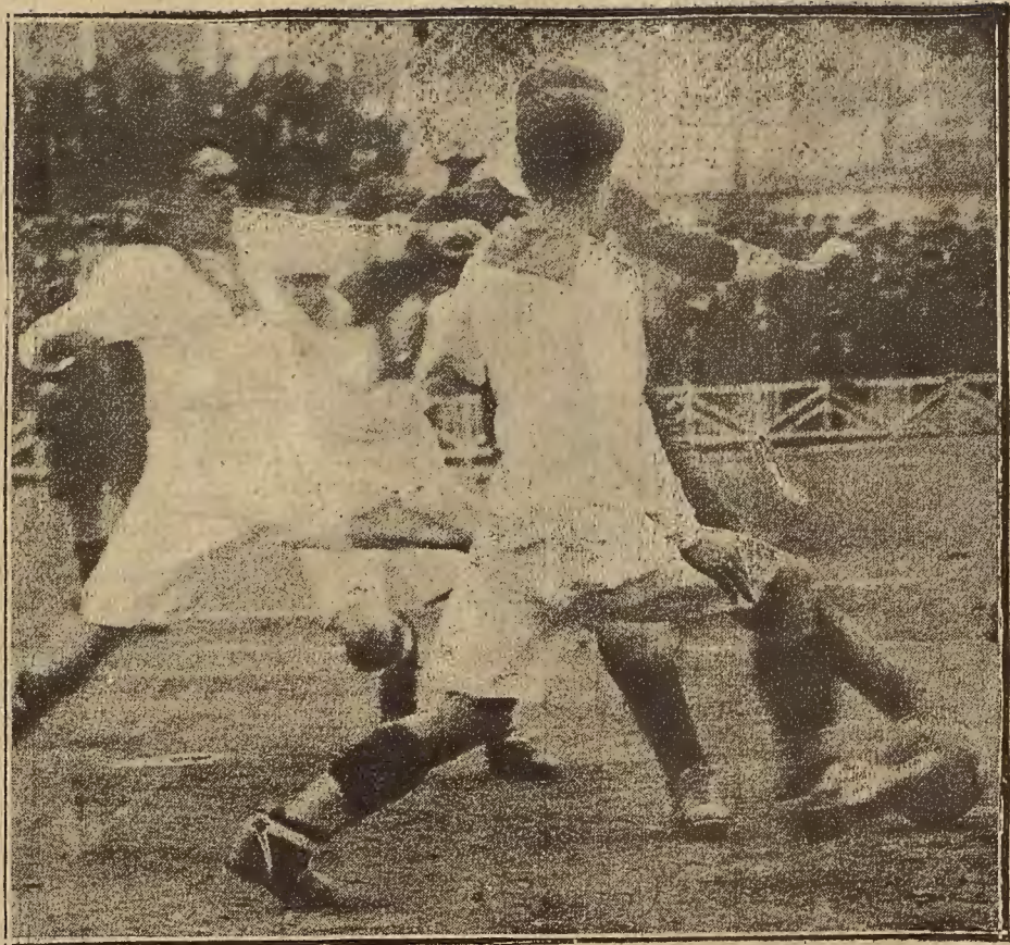
DEL PARTIDO DE FUTBOL DE ANTEAYER.—UNA «MELEE» EN LA PORTERÍA DEL PATRIA ARAGON.