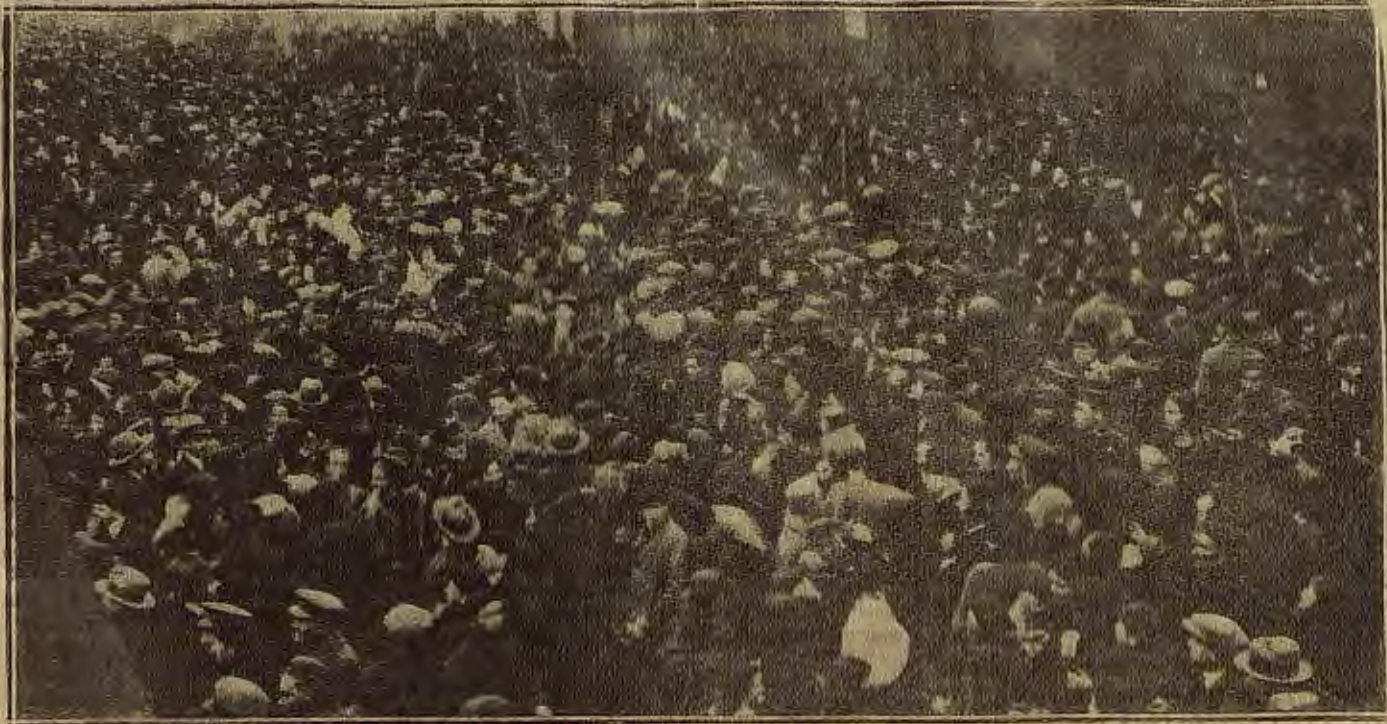
REPATRIACION DE TROPAS.—ASPECTO QUE PRESENTABA EL DOMINGO POR LA TARDE LA ESTACION DEL MEDIODIA A LA LLEGADA DEL TREN QUE TRAJO A ZARAGOZA A LOS SOLDADOS DEL REGIMIENTO DE ARAGON REPATRIADOS DE AFRICA

Sean bien venidos los bizarros soldados de Aragón.