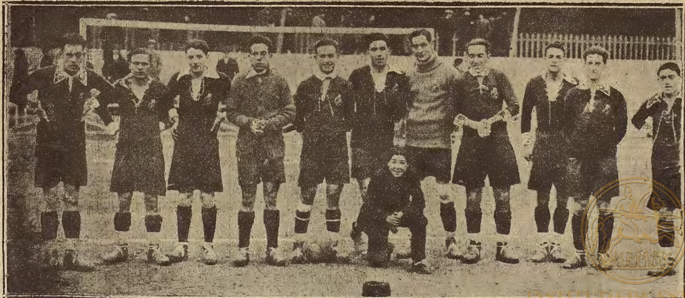
DE FUTBOL.—EL EQUIPO DEL REAL ZARAGOZA C. D. QUE VENCIO AL PATRIA ARAGON POR 7 A 2, EN EL PARTIDO JUGADO EL DOMINGO

Por el Español jugaron: Zamora; Saprisa; Portas; Trabat; Zabala; Caicedo; Olaria- ga, Ventoldra, Mauri; Padrón y Yurrita.