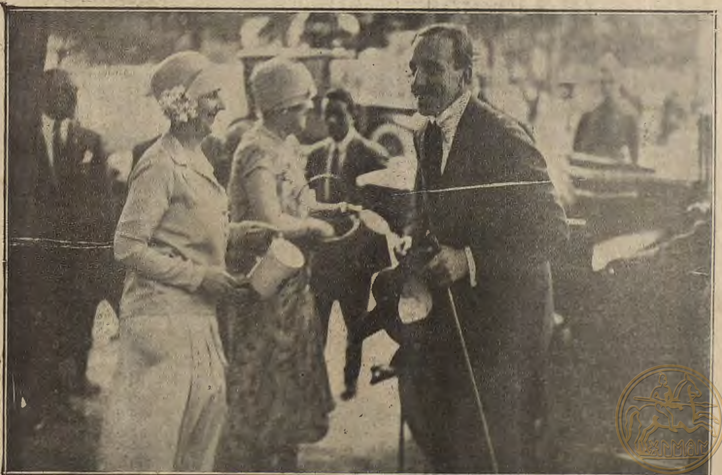
FIESTA DE LA FLOR EN MADRID. -- El Rey, entregando un donativo.

Se cuecen en agua, se mondan y hacen ruedas, poniéndolas después en una cazuela con manteca, sal, pimienta, perejil y cebollino picados y un poquito de harina. Se mojan enseguida con caldo de carne o de vigilia y un vaso grande de vino, según la cantidad de patatas empleadas, y cuando estén a punto se sirven bien sazonadas.