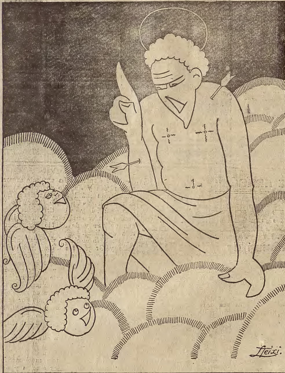
¡V NO VA MASI! -- San Sebastián a los angelotes. -- ¡Vaya niños, se terminaron los juzgos; ahora, a trabajar todo el mundo!