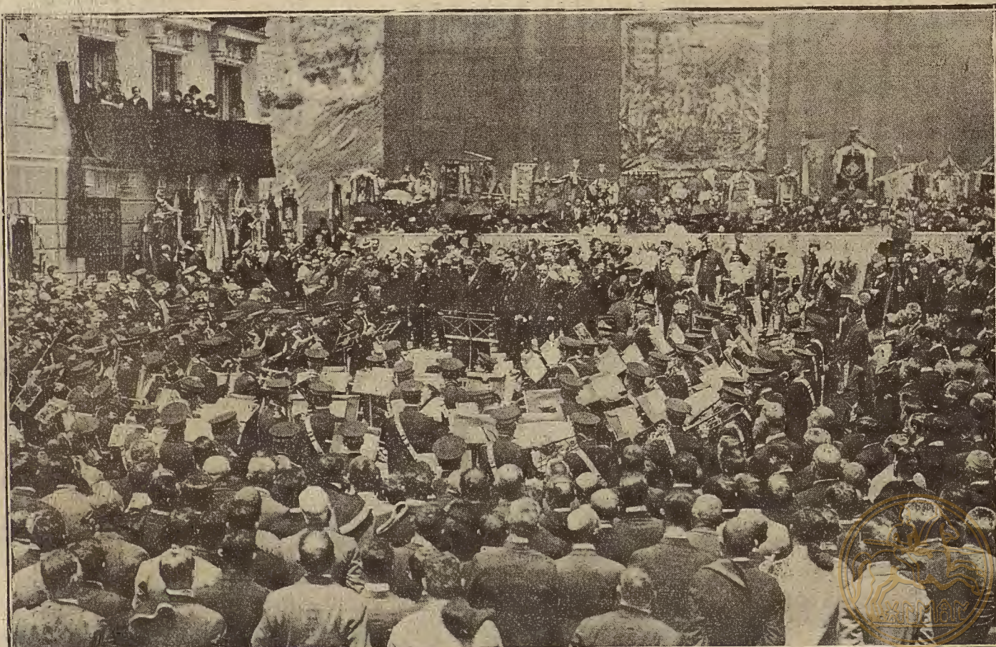
5 COROS CLAVÉ EN MADRID. -- Ato de descubrir la lárida que da a una calle madrileña el nombre del músico catalán.