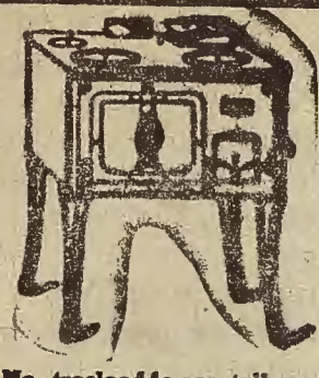
Ma trasladado sus talleres, por ampliación de negocio a la calle Mayor, núm. 61.

Fábrica de Fumistería Zaragoza Teléfono 21-12