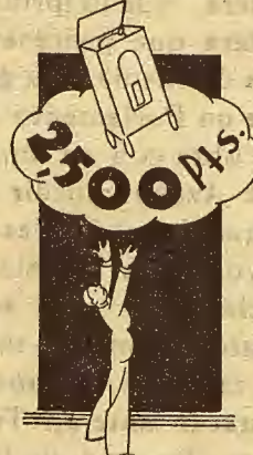
PATENTE N.º 131.873