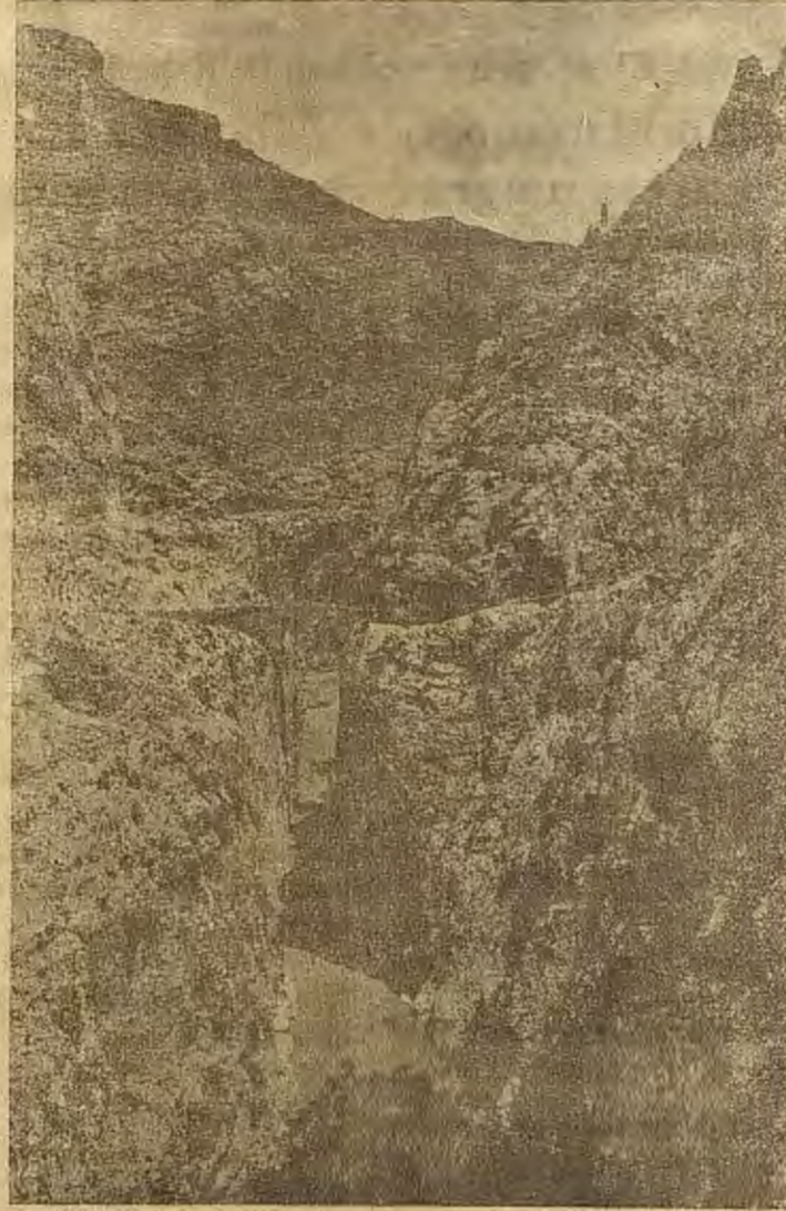
Santa Ana. Hecho.

Y luego dejaste En gélido olvido: El hombre, contigo, ¡Qué dulce la vida! El hombre, sin ti, ¡Qué amarga la vida!