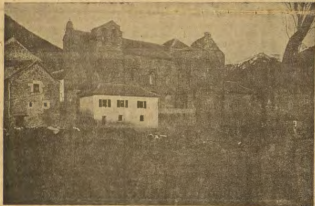
Siresa (San Pedro. Monumento pre-románico).

Anunciando el sol acusado descenso, al rojo del crepúsculo la multitud cascabelera tornó al lar pirenáico, Siresa, envuelta en grave y señorial manto nocturno, perforado por numerosos blanquecinos puntos de incandescencia.