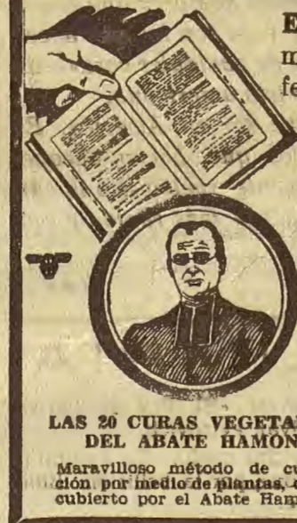
LAS 26 CURAS VEGETALES DEL ABATE HAMÓN

SE ENVIA GRATIS. Mande hoy este cupón en sobre abierto con sello de 2 cts.