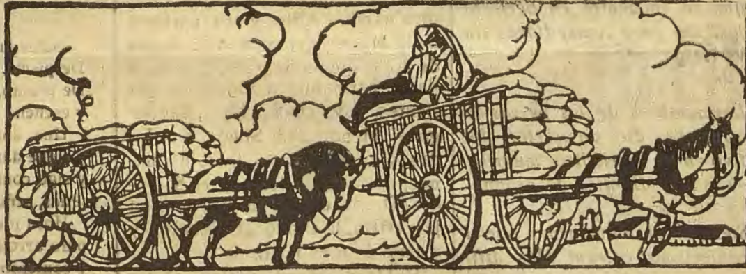
—¿Por qué tu carro llevando más carga va más ligero? —Porque lleva eje y bujes torneados MUMBRU.