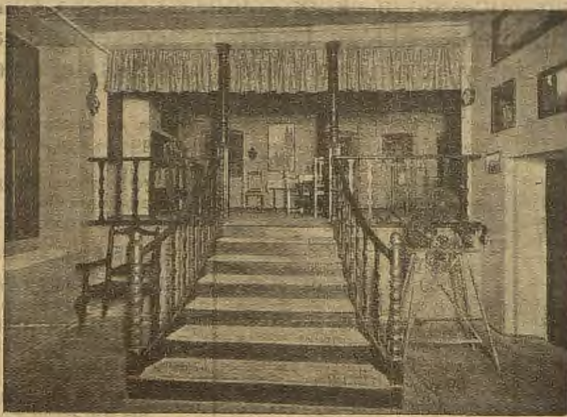
CINEMATÓGRAFO Y LUGAR DE PROYECCIONES

BOLTAÑA (Provincia de Huesca) Sanatorio del Pirineo Aragonés