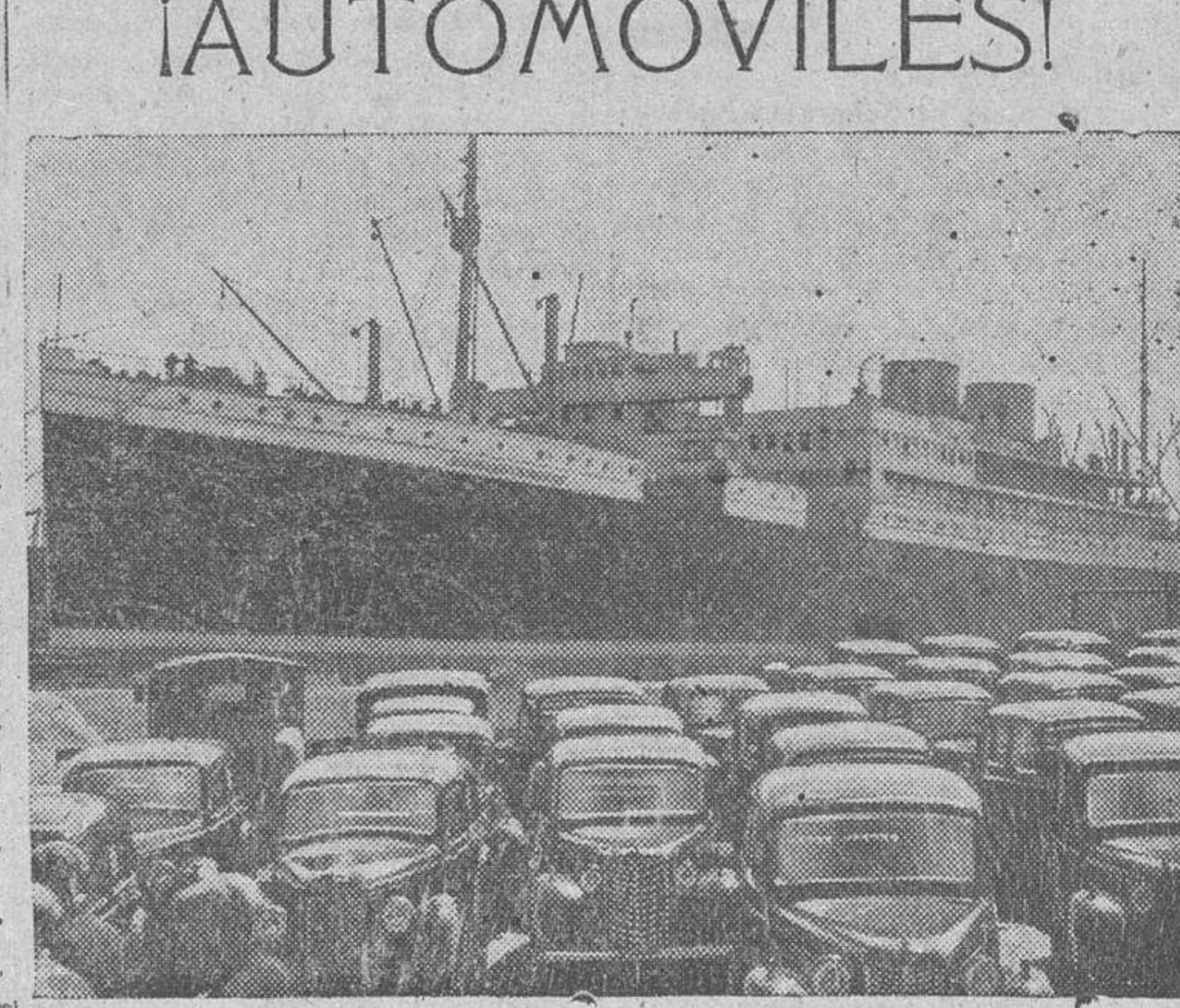
Automóviles en el puerto de Londres, dispuestos para ser embarcados con destino al Extranjero. (Foto Calpa.)

Londres.—Richard Strauss, compositor alemán que cuenta ochenta y tres años de edad y que actualmente se encuentra en Inglaterra en viaje de visita, sufrirá un fuerte catarro. Sin embargo, sus amigos creen que se encontrará bien dentro de breves días y que podrá asistir a un concierto en el que se interpretarán varias de sus obras y que se celebrará en el Albert Hall de Londres el próximo día 19 del corriente. (Efe.)