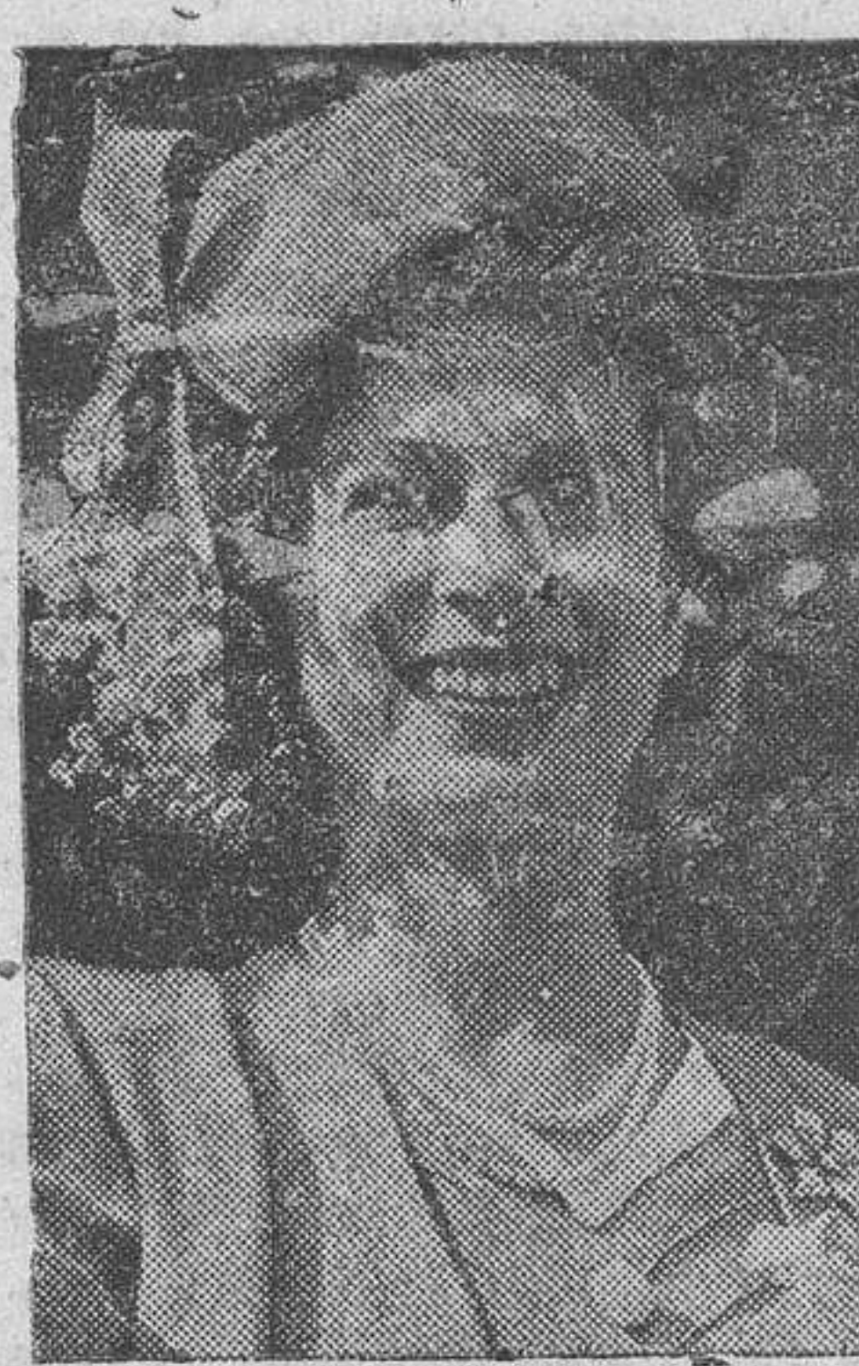
Londres.—El rey Jorge VI, en una reunión especial del Consejo privado de la Corona celebrado en el Palacio de Buckingham, ha dado su consentimiento a la boda de su hija la princesa Isabel con el teniente Philip Mountbatten, según el diario de la tarde "The Stars". Agradecemos que la ceremonia se verificará en la abadía de Westminster. La noticia no ha sido confirmada.

Reunión del Consejo privado de la Corona