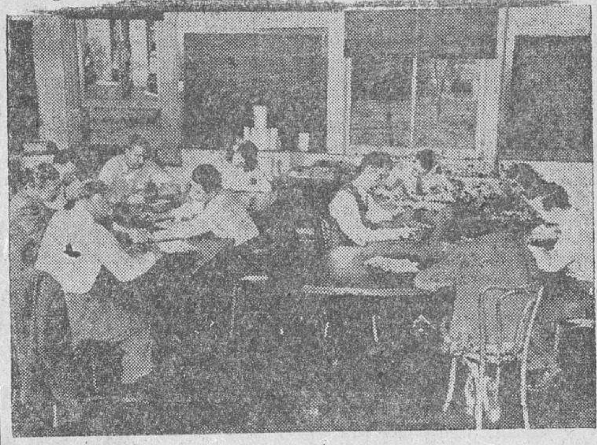
Los estudiantes en el laboratorio de noticias de la Escuela Medial de Periodismo, de la Northwestern University, de Evanston (Illinois). Aquí se instruyen prácticamente los alumnos en la preparación de noticias diversas