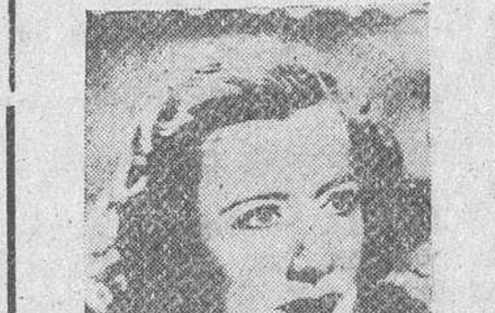
IRENE DUNNE ESTRENO OTRA VEZ JUNTOS