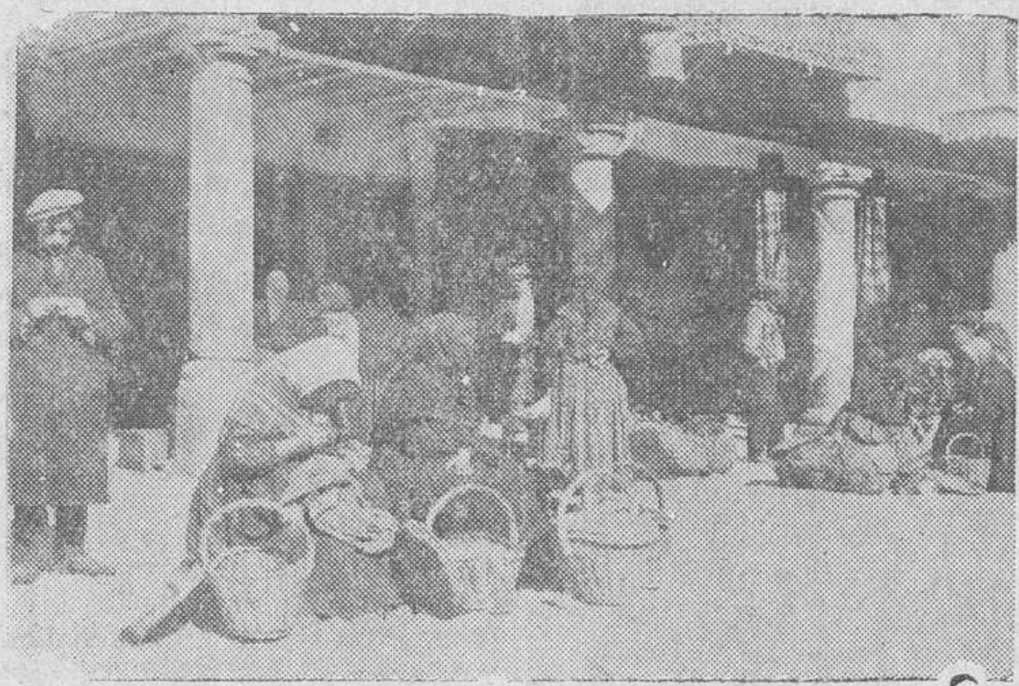
aunque en los vuelos de la evocación surja una realidad.

Del archivo fotográfico, con el cual bien pudiera constituirse un verdadero museo evocador de lo que fué Salamanca, la vez en cuando y con arreglo a la actividad y aun al tiempo del propietario — hemos de ser comprensivos — salen algunas viejas estampas, que son un recuerdo de aquella ciudad de finales de siglo, y primeros del actual. Entonces Salamanca estaba bastante mejor; en la mitad de los habitantes de hoy, y aunque su progreso urbano fué acompañando a los años, no tanto como a su extensión. De las estampas, desamparadas del ríscón del archivo, para volver a la luz pública, algunas ya fueron publicadas no hace mucho, estableciendo un contraste entre el ayer y el hoy. Se rompió la caducidad, aunque creemos que quedarán otras varias. Estas que nos sirven nuevamente de tema, son sólo de tipos y sobre ellos pasaron los años, para no dejar más que recuerdos. Una evocación, tanto de tipo como de vida, porque si el ropaje fué la nota de una época, las personas representan