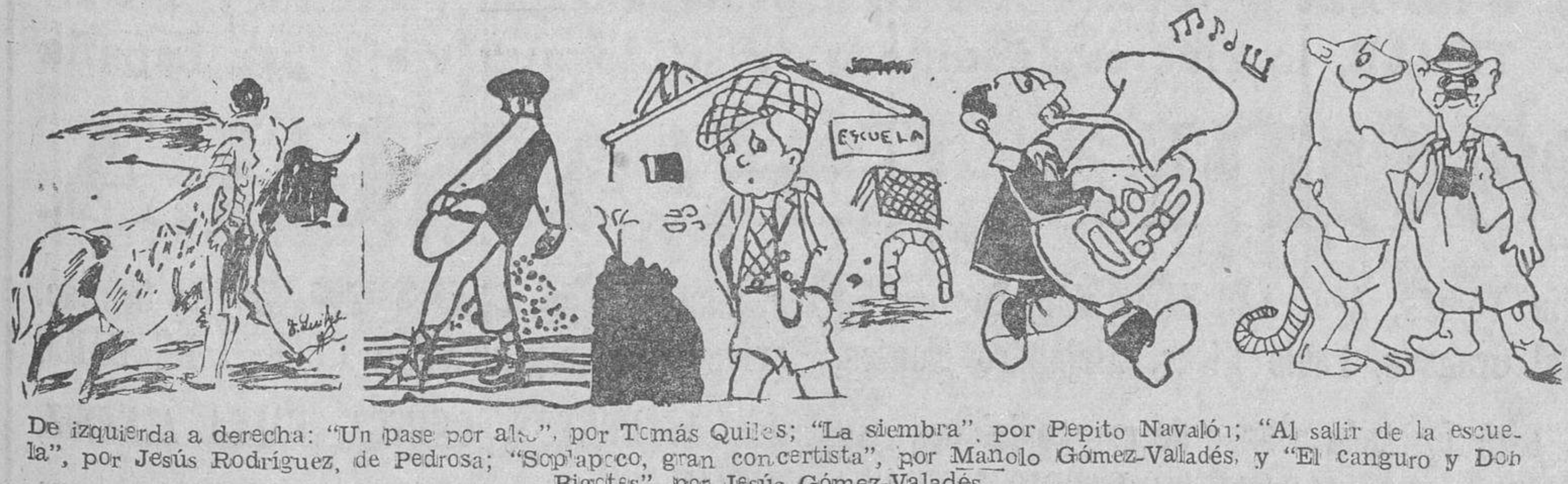
De izquierda a derecha: "Un pase por allá", por Tomás Quiñes; "La siembra", por Pepito Navaló; "Al salir de la escuela", por Jesús Rodríguez, de Pedrosa; "Sop'apoco, gran concertista", por Manolo Gómez-Valadés; "El canguro y Don Bigotes", por Jesús Gómez-Valadés