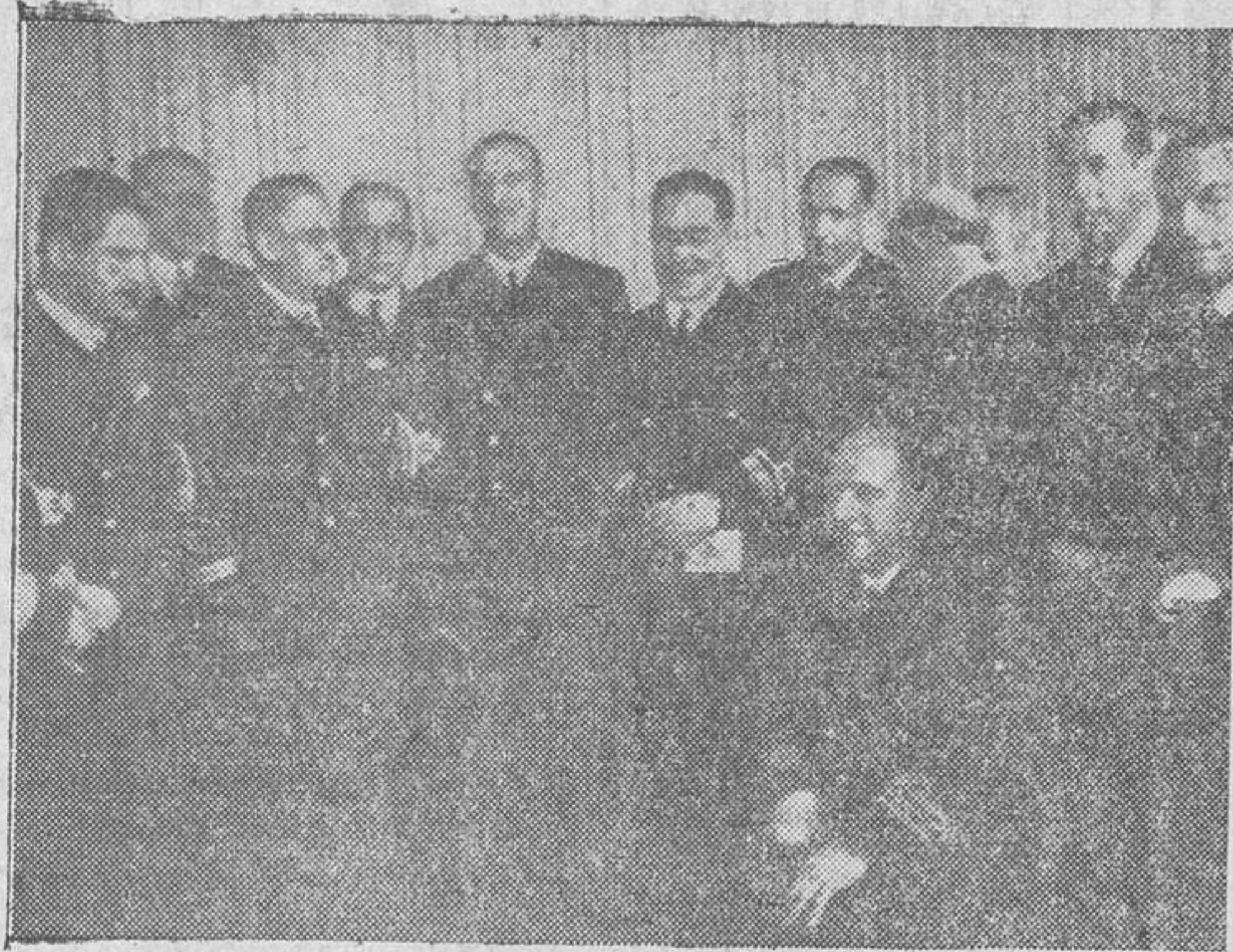
La representación de las promociones de 1921 de los distintos Cuerpos de la Armada, que, con motivo de celebrar sus bodas de plata, fueron recibidos ayer por el Caudillo, fotografías con el ministro de Marina, en la visita que hicieron al almirante Regalado el día anterior.