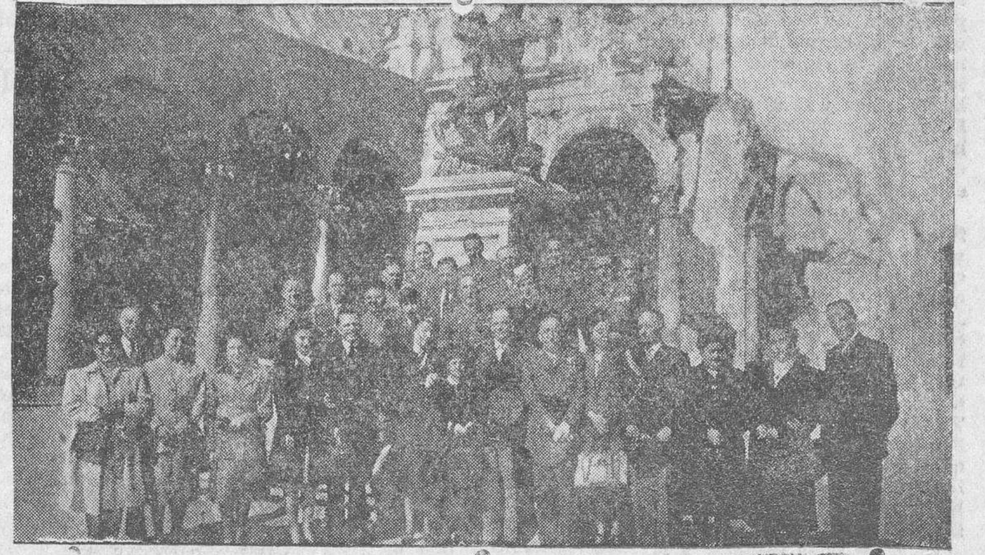
La misión especial argentina ha visitado las ruinas del Alcázar. En la fotografía se ve a los ilustres huéspedes en el patrio del glorioso edificio, acompañados por las autoridades civiles y militares