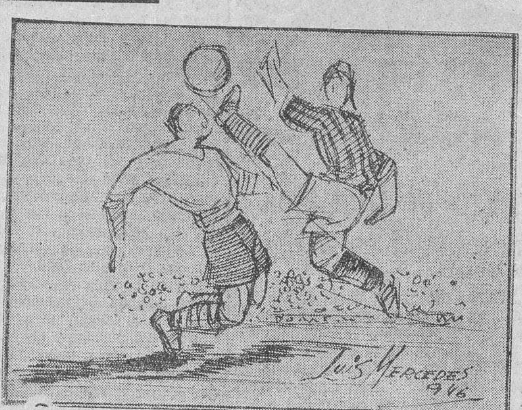
Un momento del partido, visto por Luis Mercedes