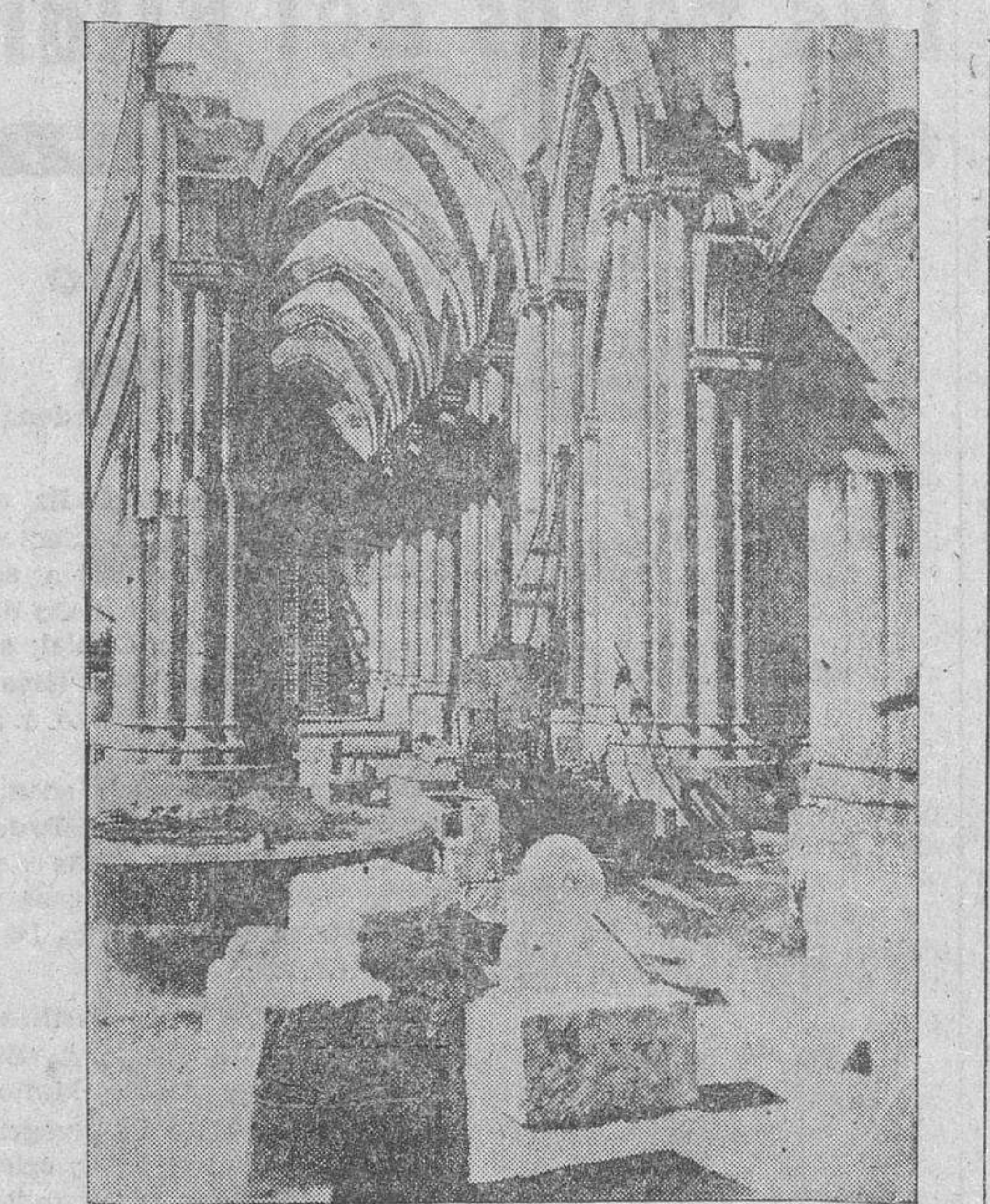
Estado de las obras de la Basílica

Sanatorios, Consultorios, Rayos X, Diatermia, etc. Servicios Sindicales de Seguro de Enfermedad (Obra 18 de Julio). Informes: Cuesta de Santa Spiritus, 10. Tel. 2471