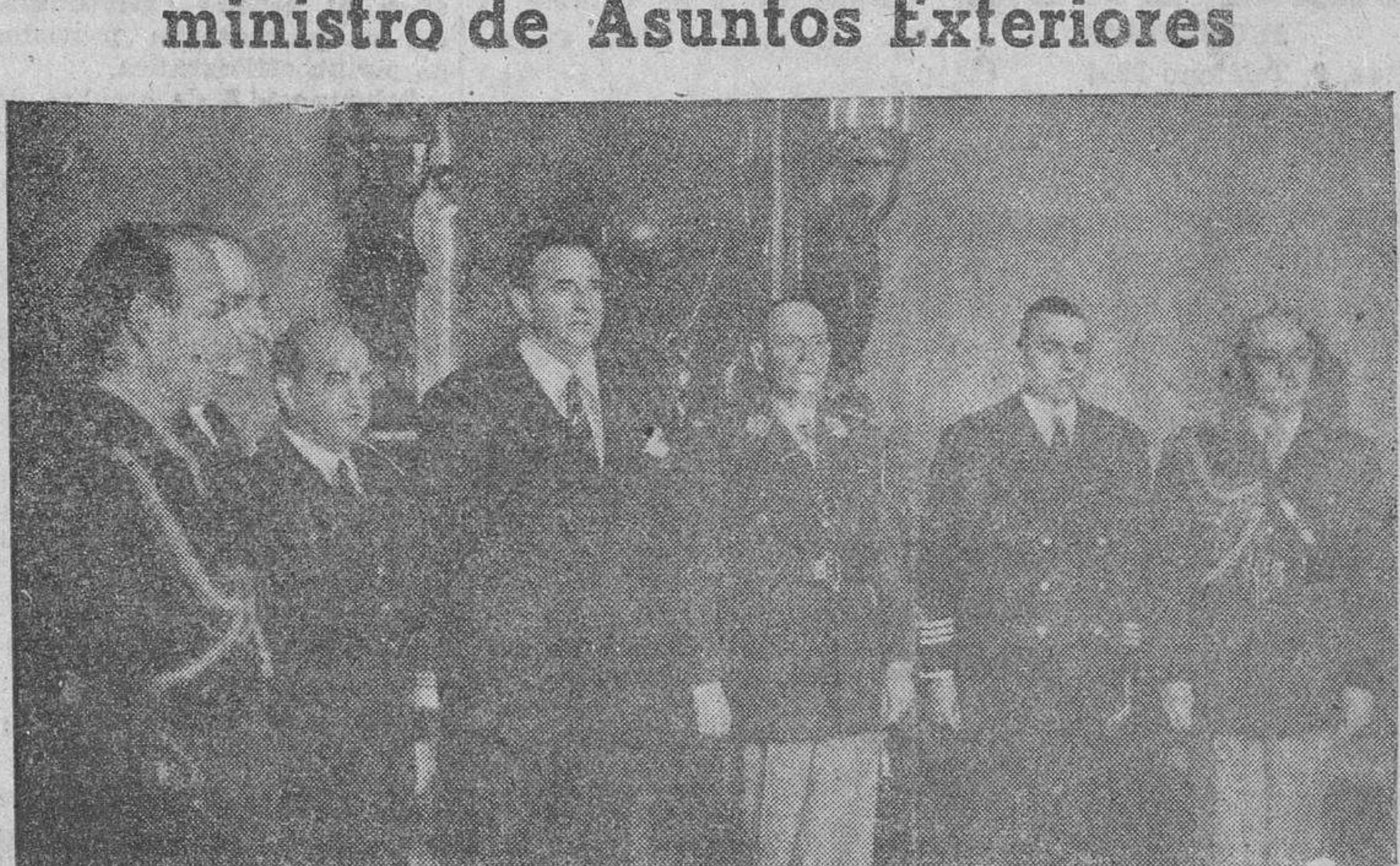
La Misión argentina que acaba de llegar a Madrid, estuvo el lunes en el Palacio del Ministerio de Asuntos Exteriores para visitar al señor Martín Artajo, en compañía del ministro plenipotenciario de la Argentina en Madrid