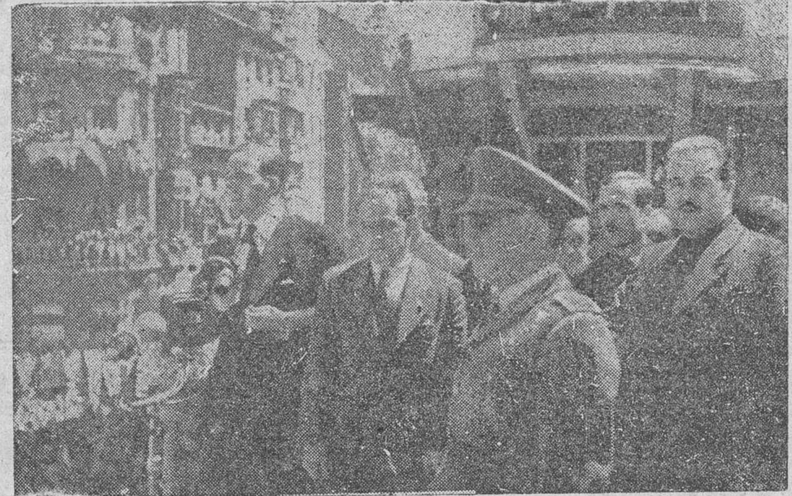
Su Excelencia el Jefe de Estado, presenciando, en Oviedo, una importante manifestación de entusiasmo

Por lo avanzado de la hora, se suspendió la visita del Caudillo al Museo, regresando Su Excelencia a Oviedo a las ocho y cinco de la tarde. (Logos.)