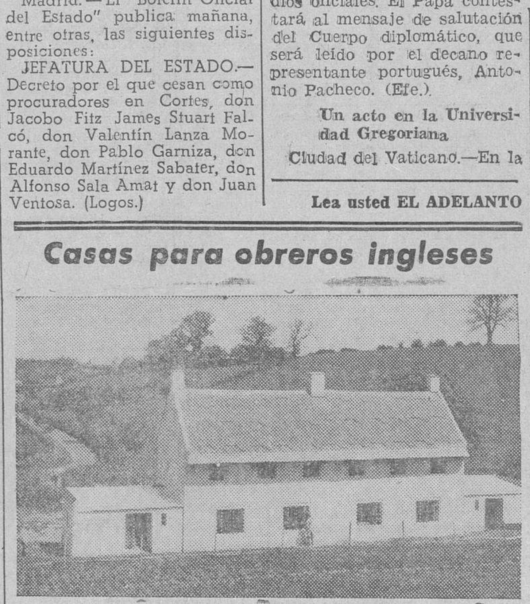
He aquí una de las que se están edificando en Bath, condado de Wiltshire. (Foto Calbe).