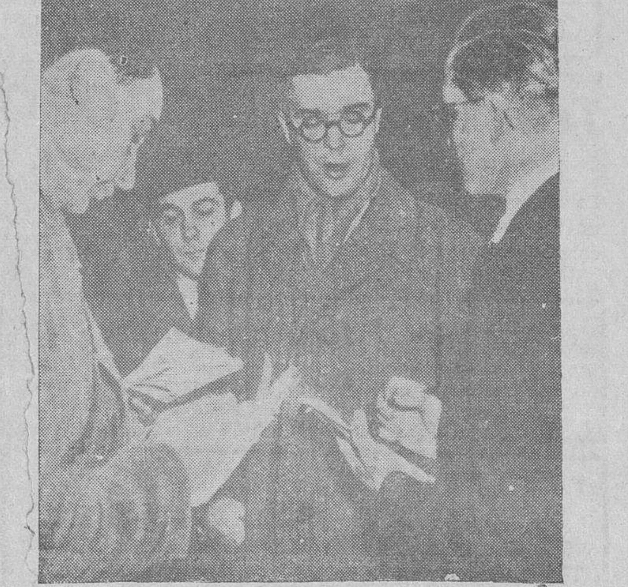
El príncipe Carlos Juan, nieto del Rey Gustavo de Suecia, llega a Norteamérica para contraer matrimonio con una periodista yanqui.