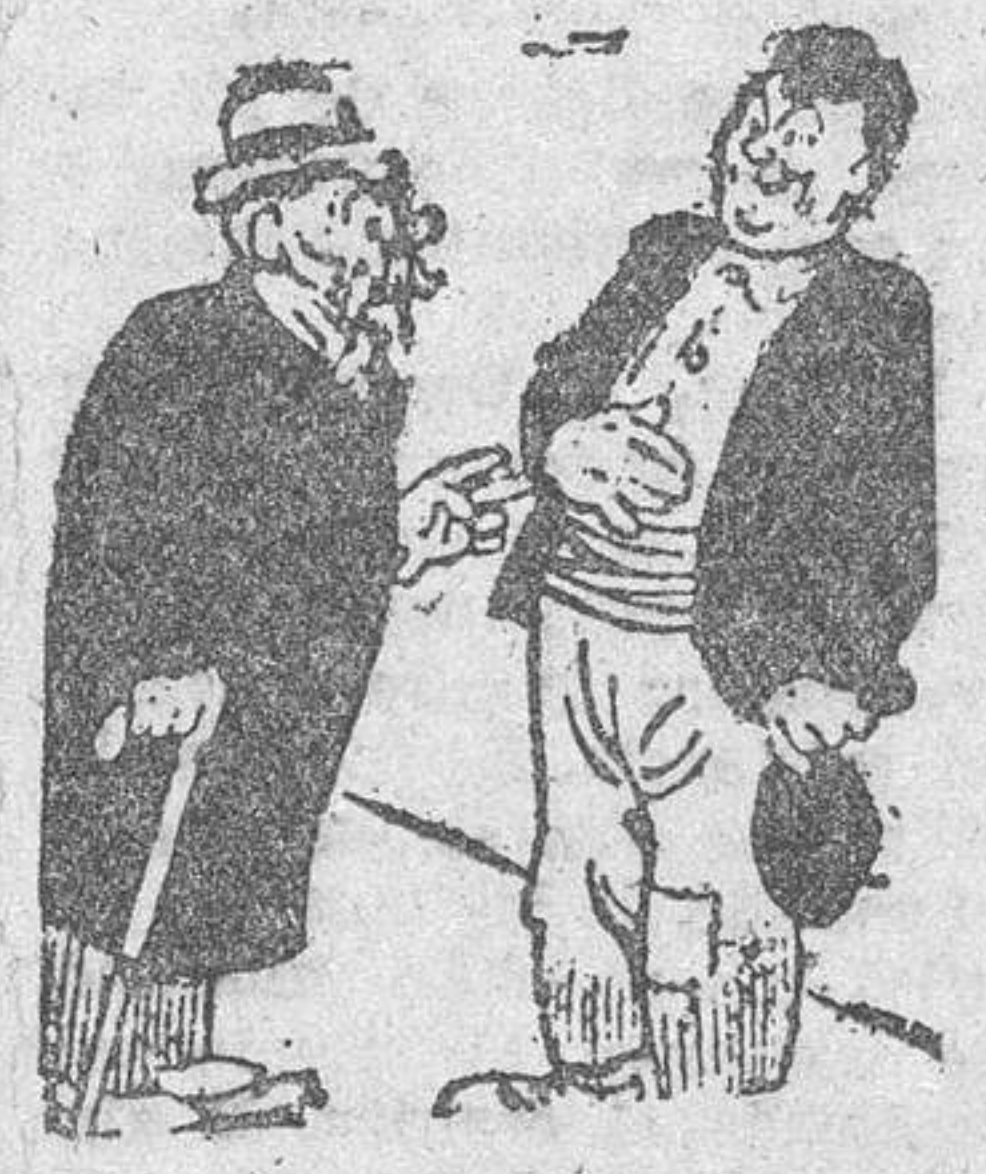
TEMPERAMENTO BON. DADOSO

—¿Por qué pide usted limosna, si es joven y robusto? —Por altruismo, señor. Soy soltero y no quiero quitar el trabajo a ningún padre de familia.