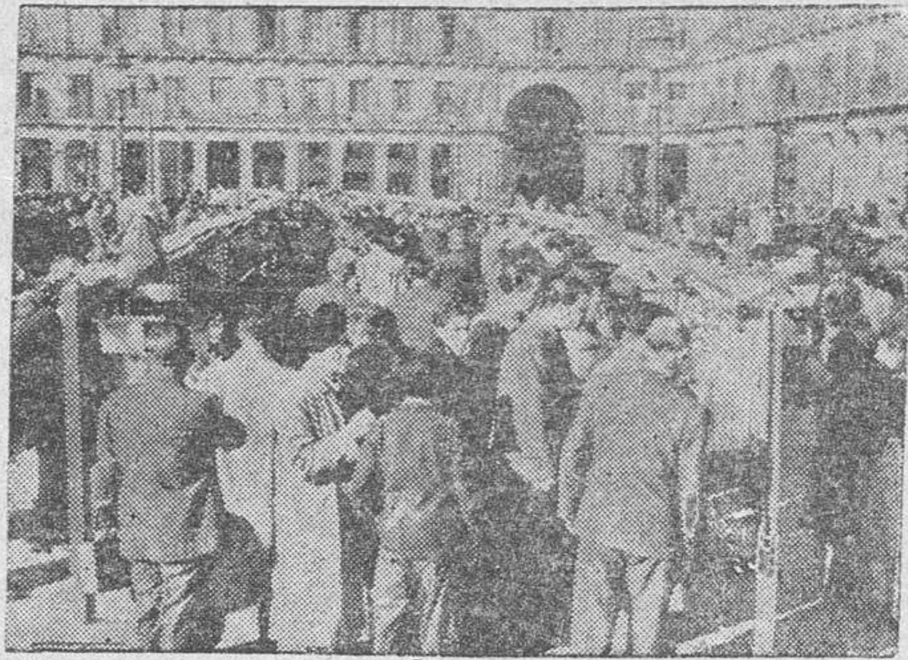
Madrid.—En la Plaza Mayor se han instalado los cabalotes con el censo electoral, para su comprobación por los electores. He aquí el animado aspecto que ofrece a diario la citada plaza.