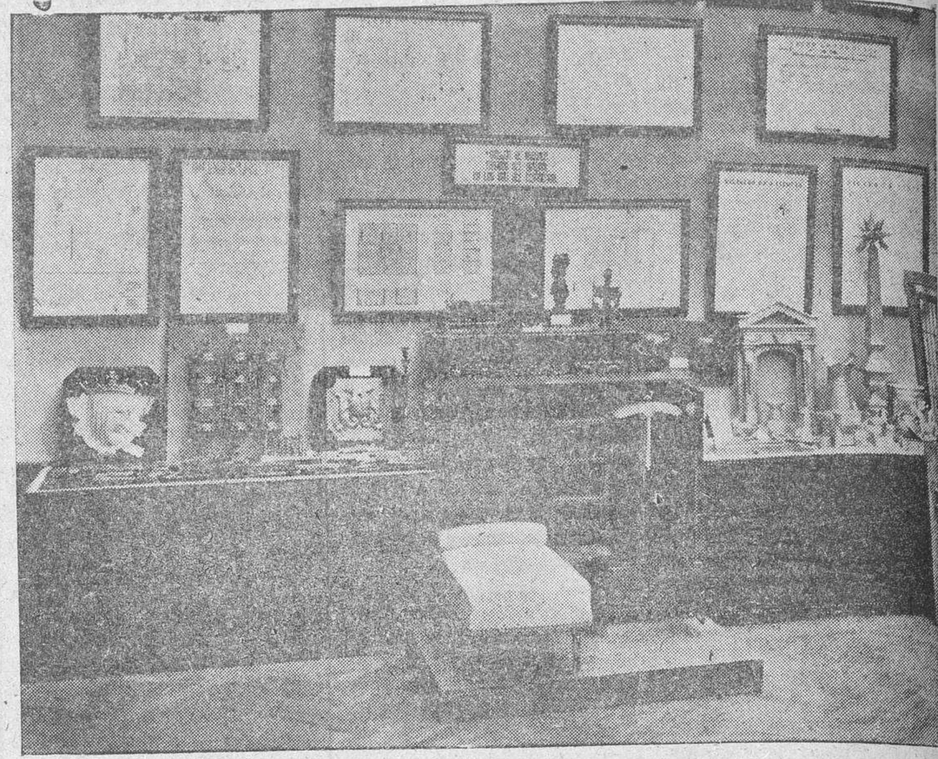
Algunos de los trabajos de la Escuela Elemental de Salamanca, presentados a la Exposición Nacional

La labor de formación profesional, en toda la amplitud y la significación que encierra, parece que va a tomar un nuevo impulso, que se traduzca en magníficas realidades, no sólo en la posibilidad que la obra presenta, sino también en una mayor eficacia para el futuro desarrollo de las Escuelas Profesionales.