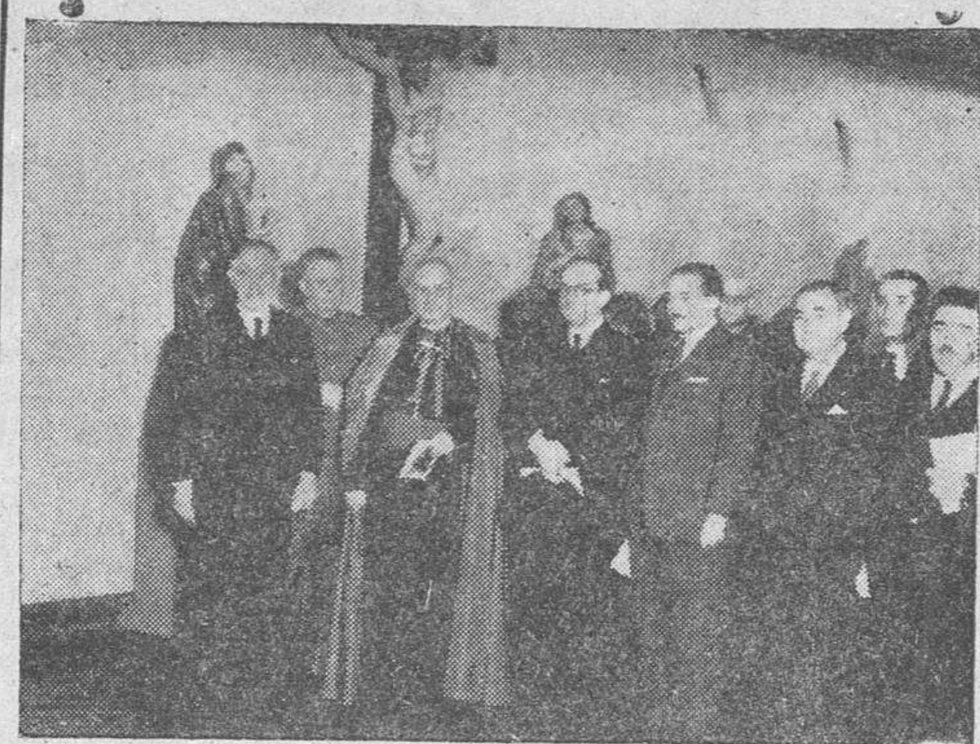
El ministro de Educación Nacional, señor Ibáñez Martín, con el obispo de Madrid-Alcalá, doctor Eijo; el director general de Bellas Artes, marqués de Lozoya; el presidente del Circo de Bellas Artes e ilustre pintor, don Marceliano Santamaria, y otras destacadas personalidades en el acto de la inauguración de la Exposición.