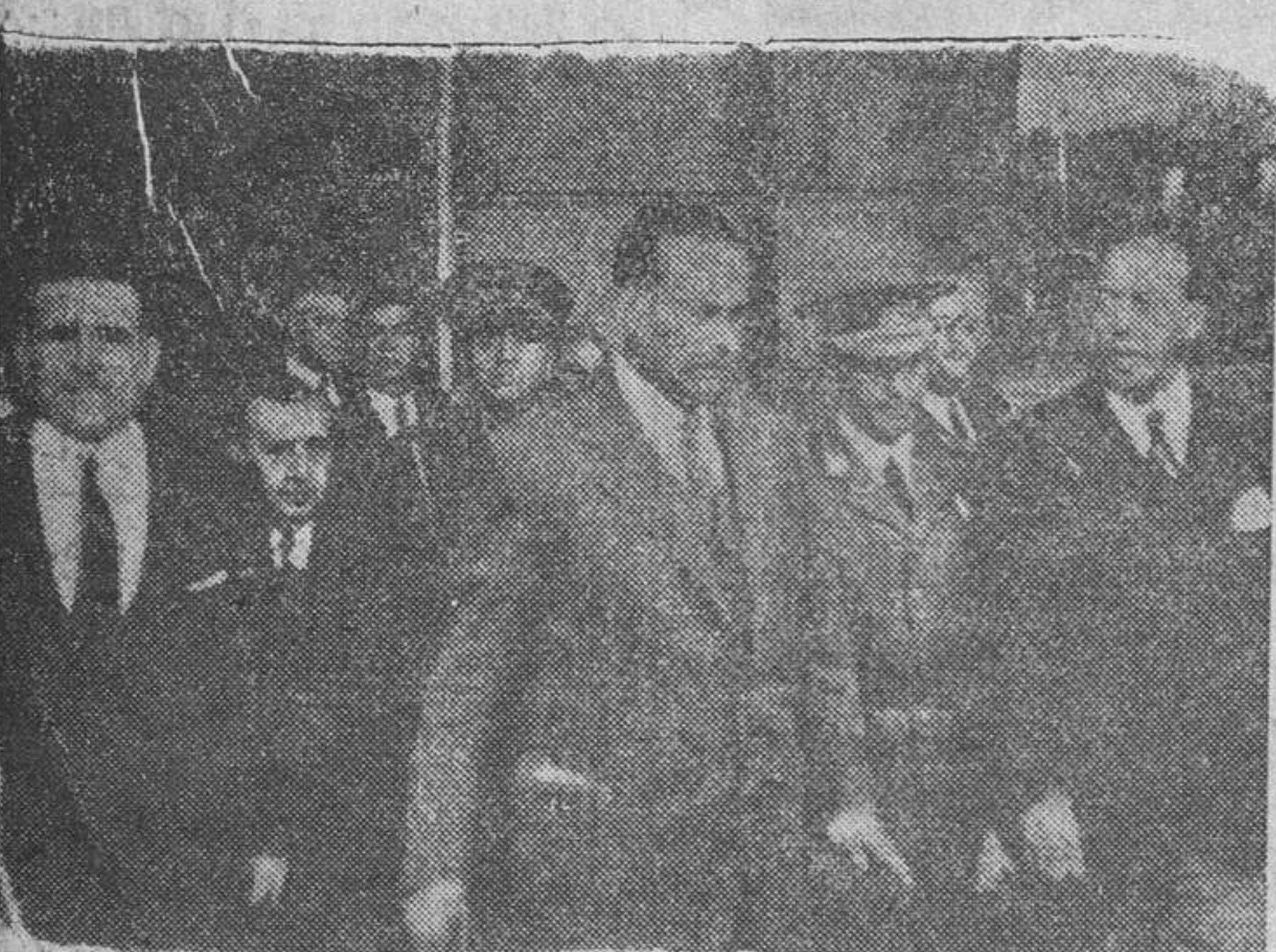
El ministro de la Gobernación, don Blas Pérez, es recibido, en la estación de término de Barcelona, por las primeras autoridades de la capital catalana