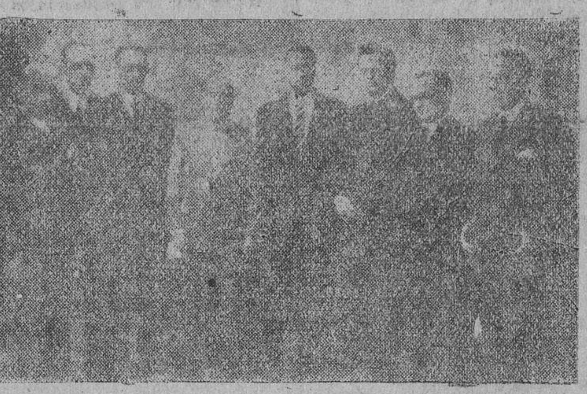
El ministro de la Gobernación, con el Comité Ejecutivo de la Mancomunidad de Diputaciones, que le hizo entrega de las conclusiones de la Asamblea recientemente celebrada