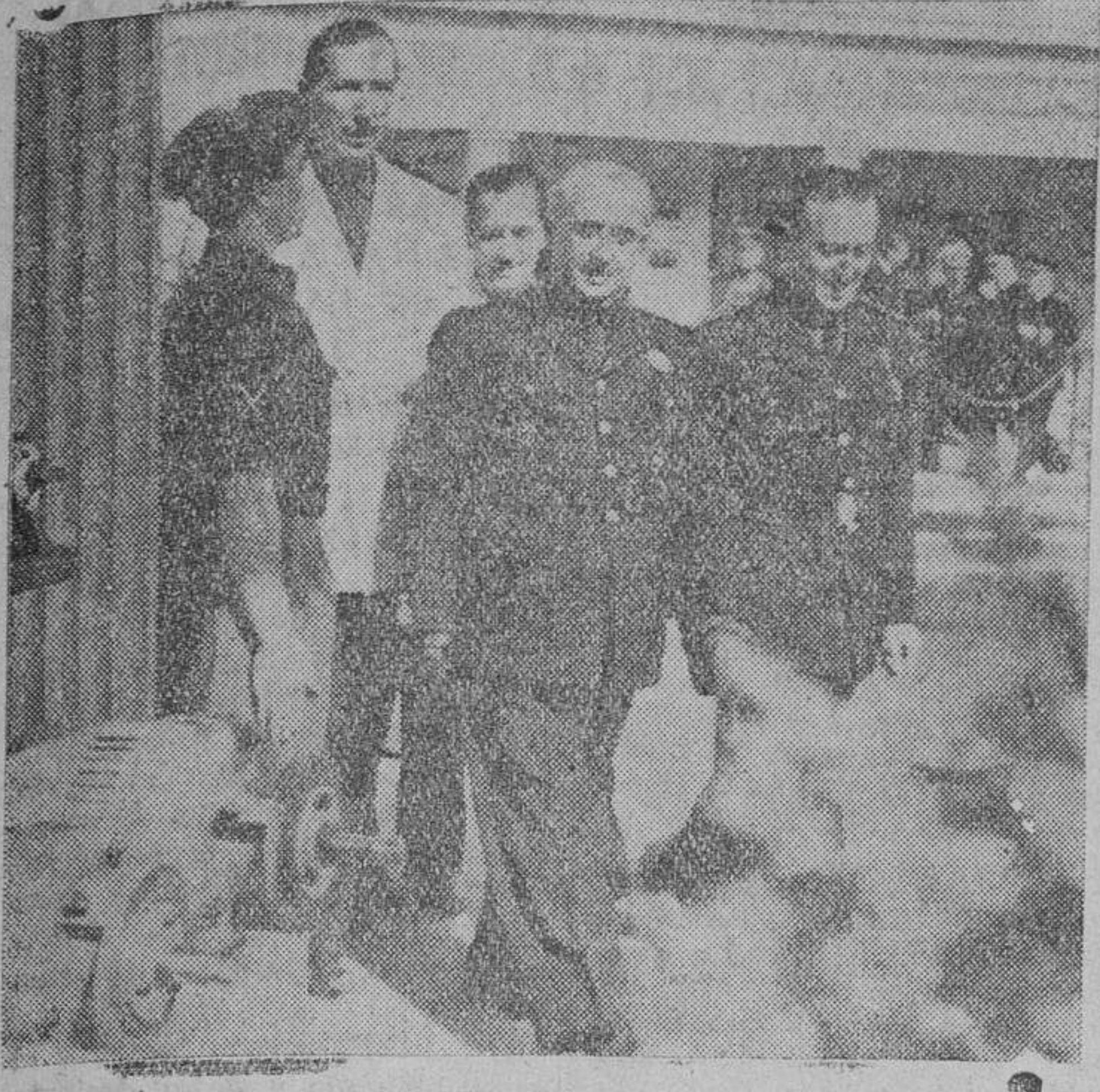
S. E. el jefe del Estado, recorriendo las instalaciones de la Exposición de la Industria Eléctrica, durante la visita que realizó el lunes.

El Caudillo en la Exposición de la Industria Eléctrica