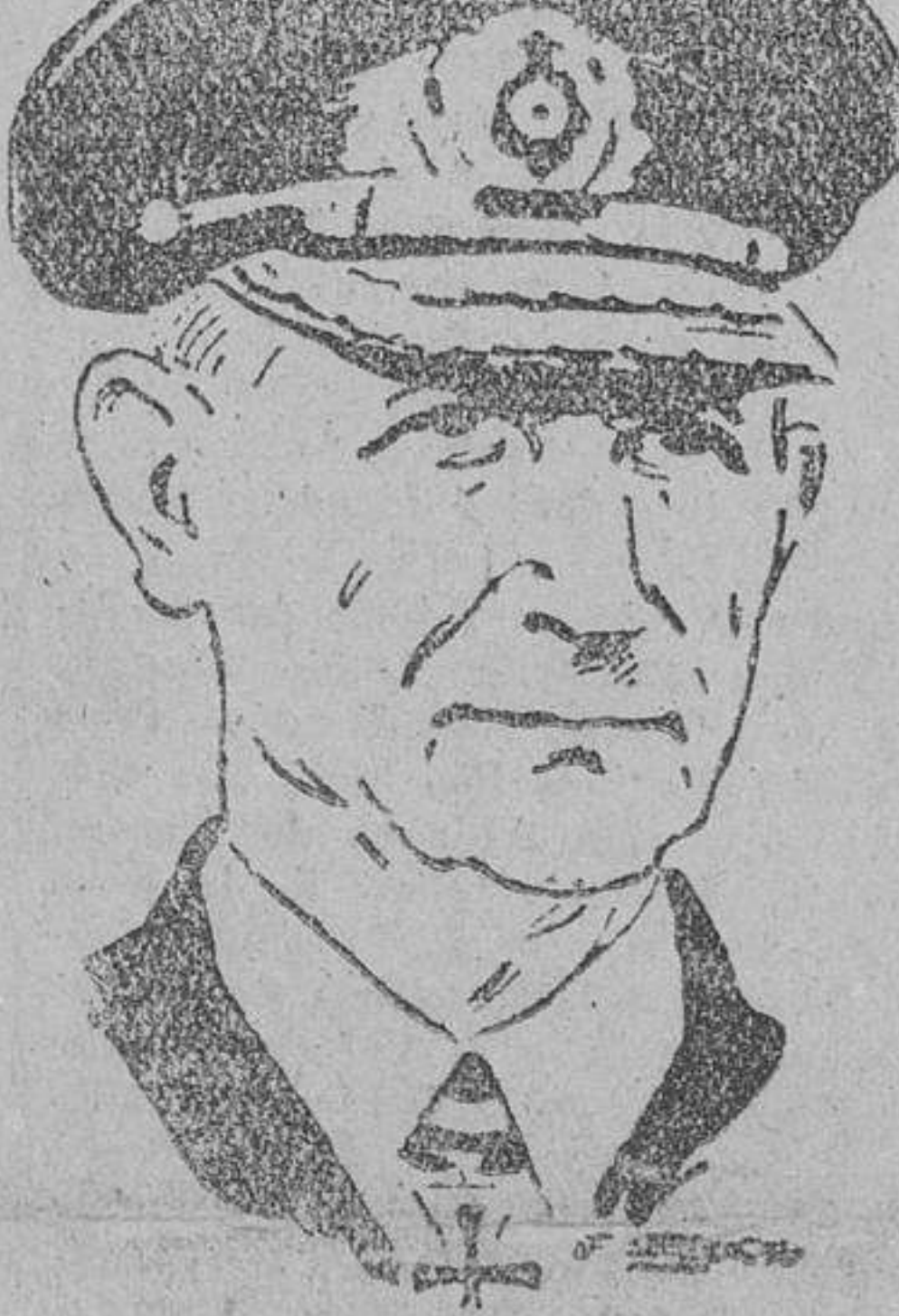
El almirante Doenitz, nuevo Canciller de Alemania

do alemana—el Führer nombró al gran almirante Doenitz, su sucesor. El nuevo Führer va a hablar al pueblo alemán.