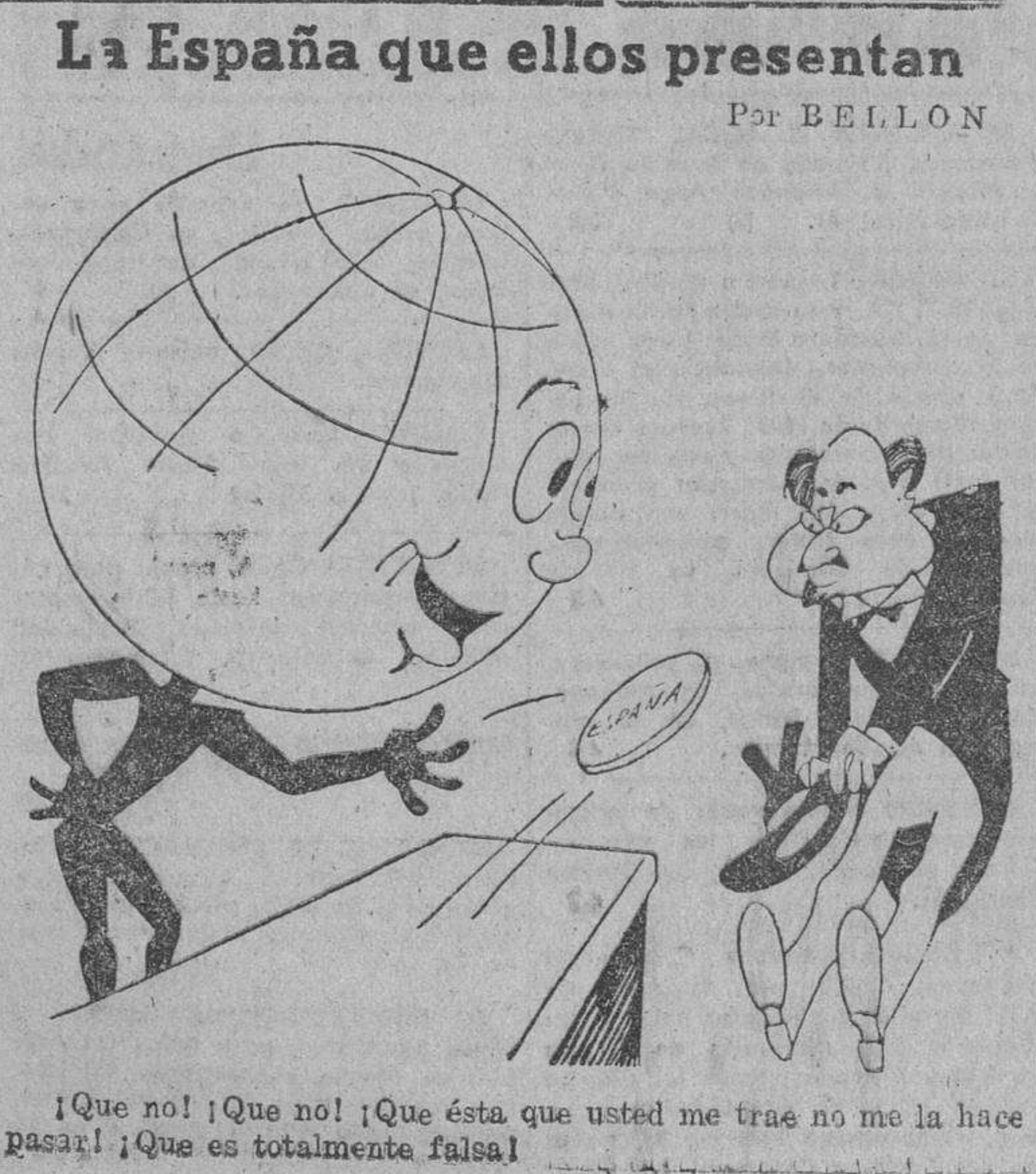
¡Que no! ¡Que no! ¡Que ésta que usted me trae no me la hace pasar! ¡Que es totalmente falsa!

Seguimos recibiendo ofrecimientos de colaboración, que agradecemos en todo cuanto valen, y continuamos a la disposición de cuantos industriales se interesen, en las Oficinas de esta Cámara de Comercio.