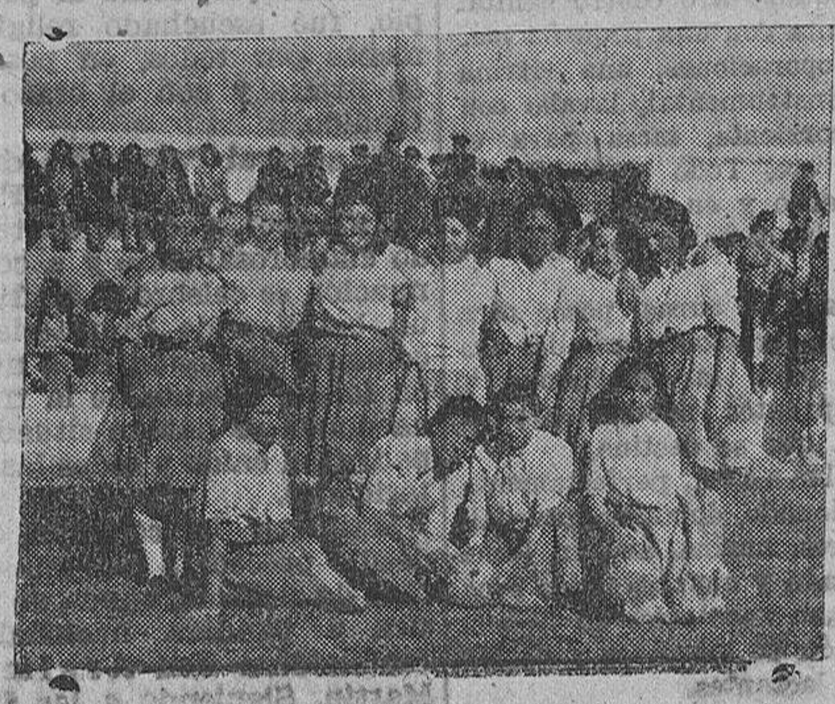
El equipo de Flechas Azules, proclamado campeón en las pruebas finales de los II Campeonatos provinciales de balonmano.

LA DELEGADA PROVINCIAL EFECTUO LA ENTREGA DE TROFEOS DONADOS POR EL JEFE PROVINCIAL DEL MOVIMIENTO A LOS EQUIPOS VENCEDORES