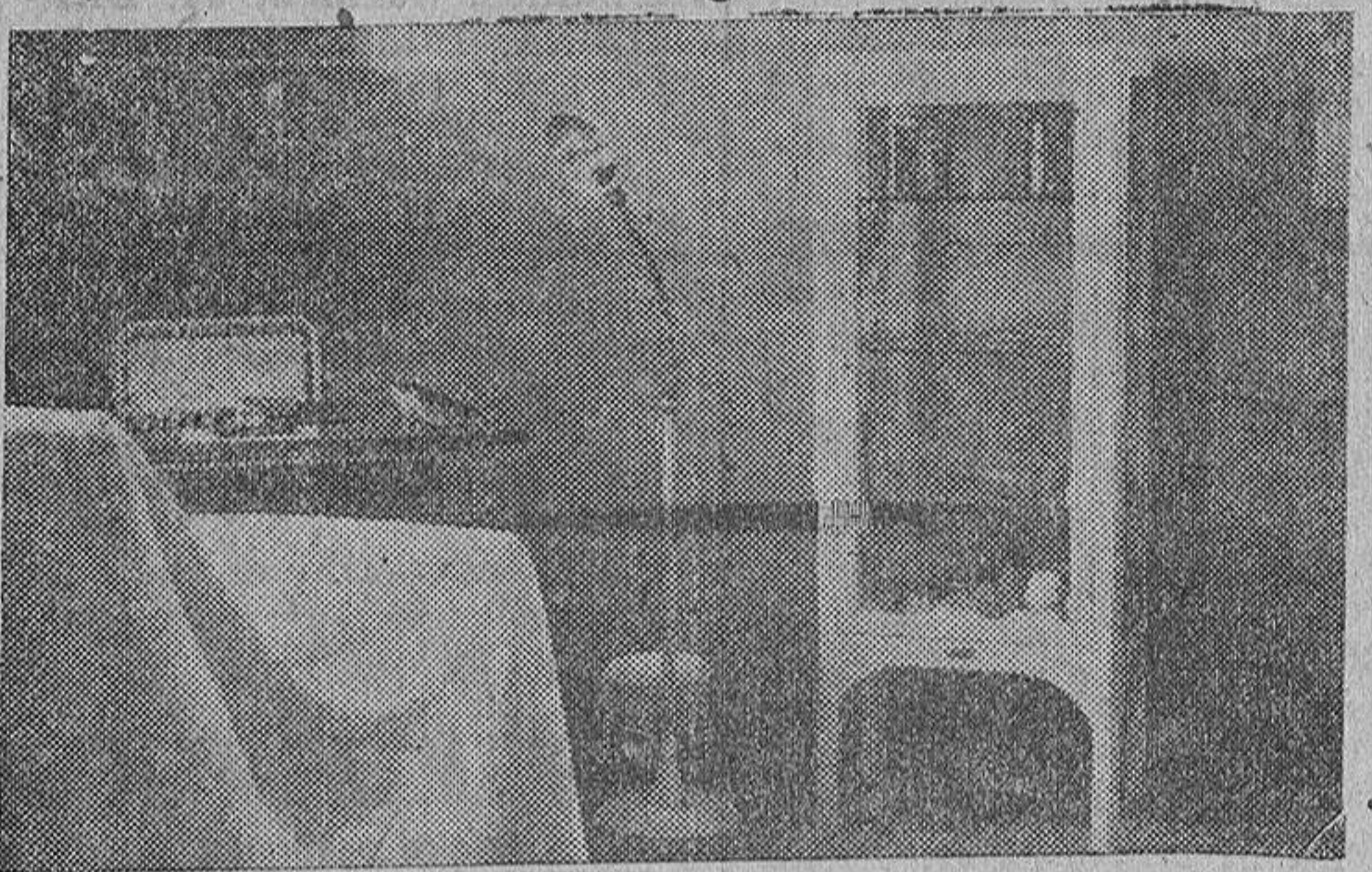
Sala de consulta.