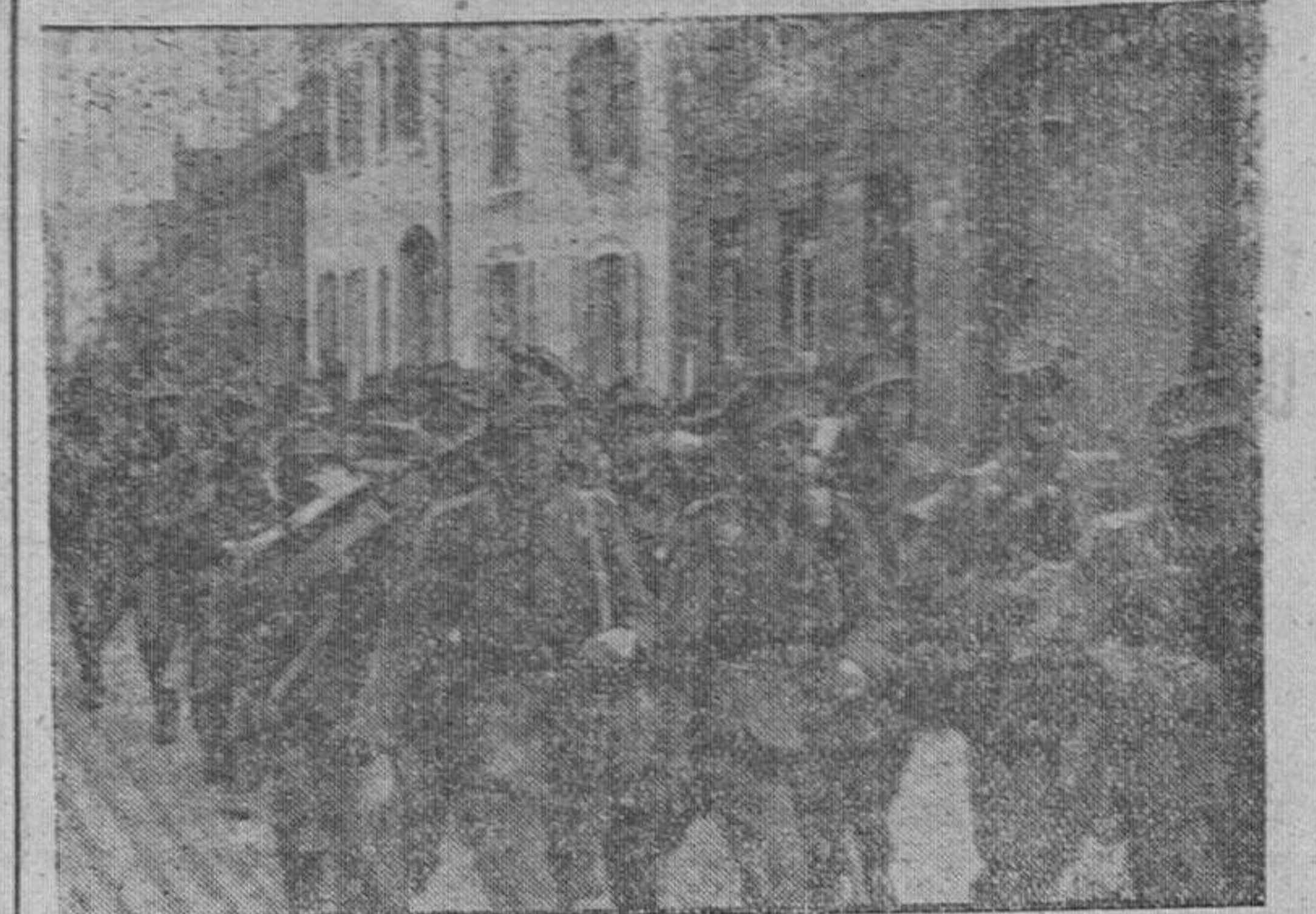
Una división de soldados movilizados recientemente en Alemania atraviesa la calle principal de una ciudad en su marcha al frente del Oeste