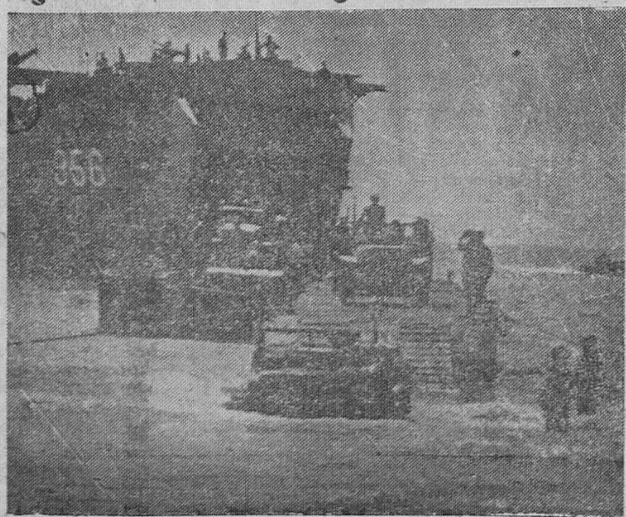
De la proa de una lancha LST, salen tanques y equipo mecanizado con destino a la lucha contra los japoneses en las islas del Pacífico