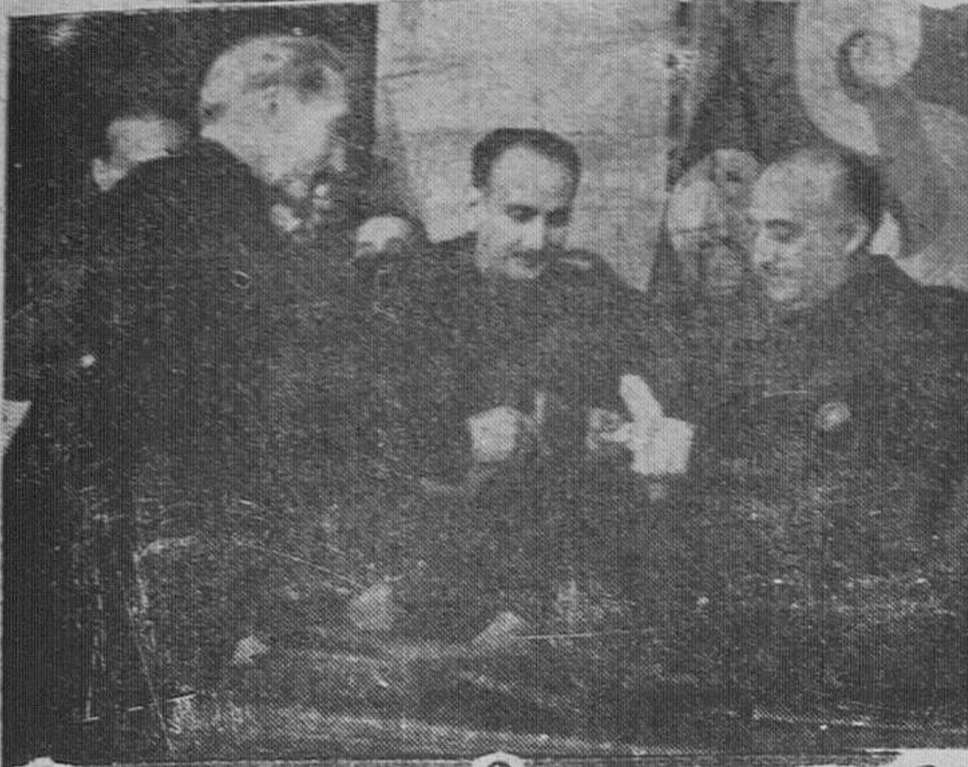
El ministro Secretario entregando a Su Excelencia el Jefe del Estado la insignia de oro de la Organización Juvenil, durante el acto de clausura del IV Consejo general, en el que pronunció un importantísimo discurso