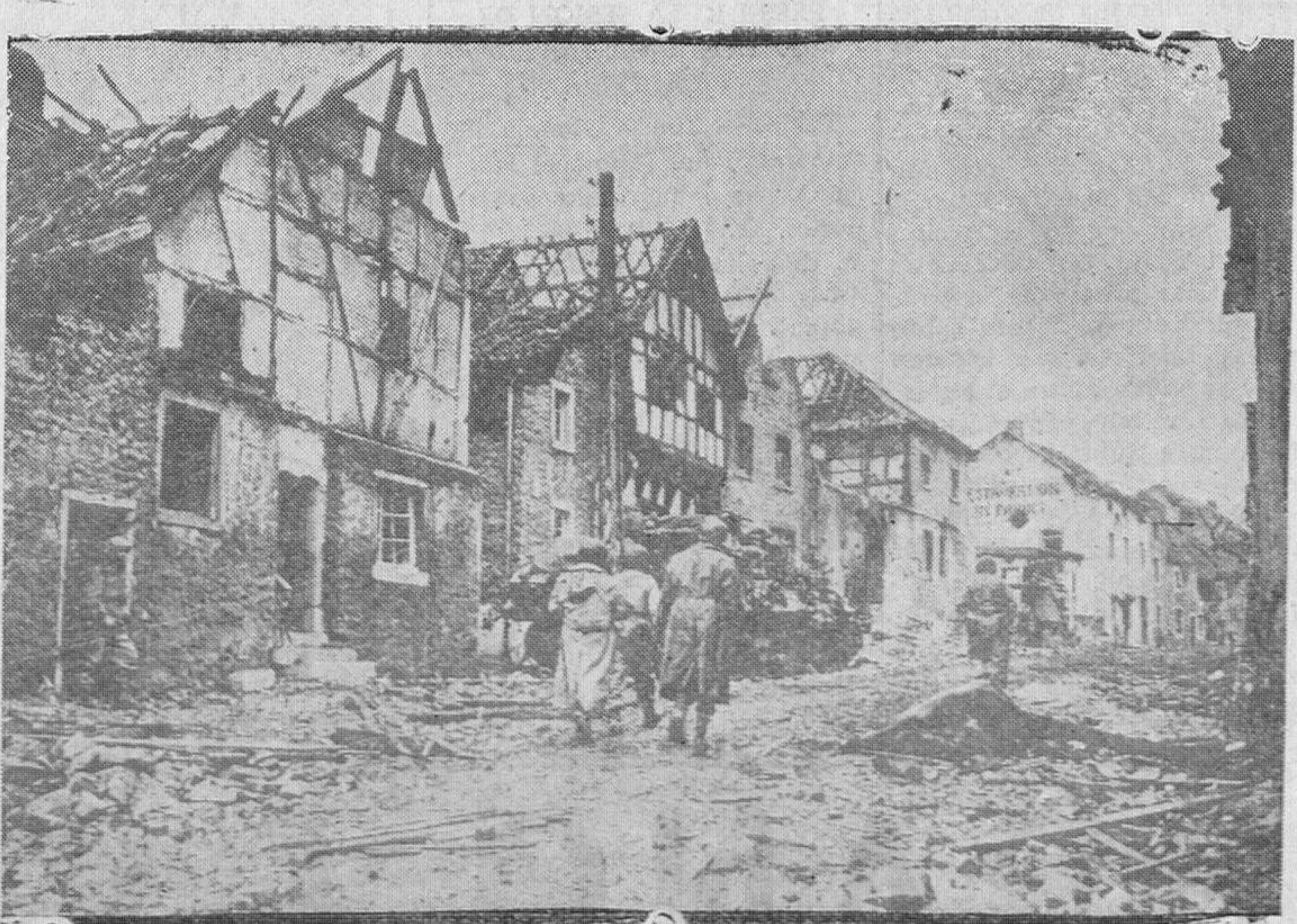
La fotografía recoge la impresionante realidad de una población belga, por donde pasó la guerra, con todo su cortejo trágico