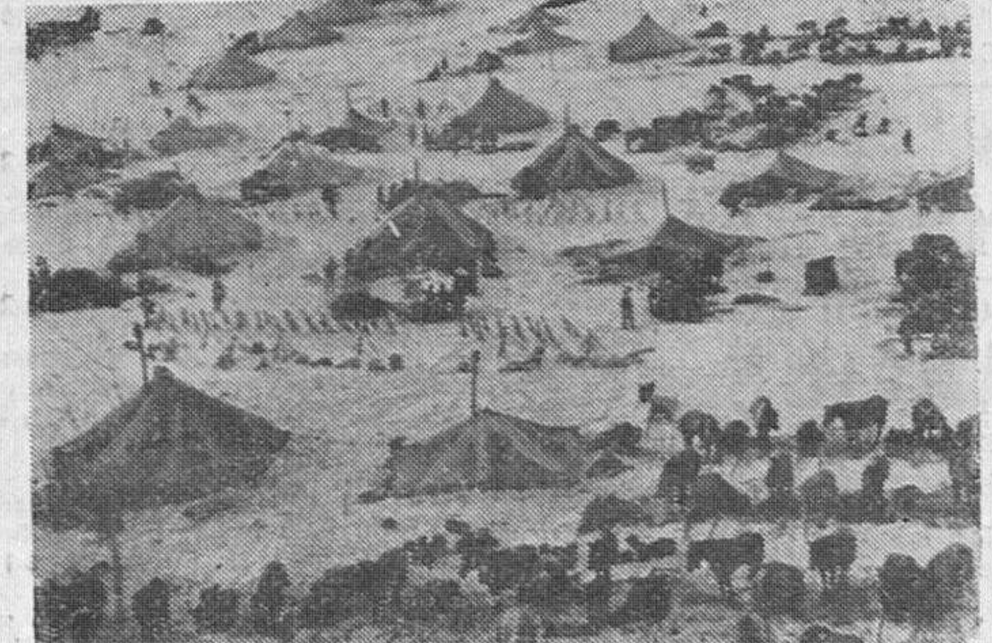
El campamento de una unidad de esquiadores, en el que, durante las maniobras, viven los soldados en tiendas de campaña. Ponys y trineos sirven para llevar el material de guerra al campamento