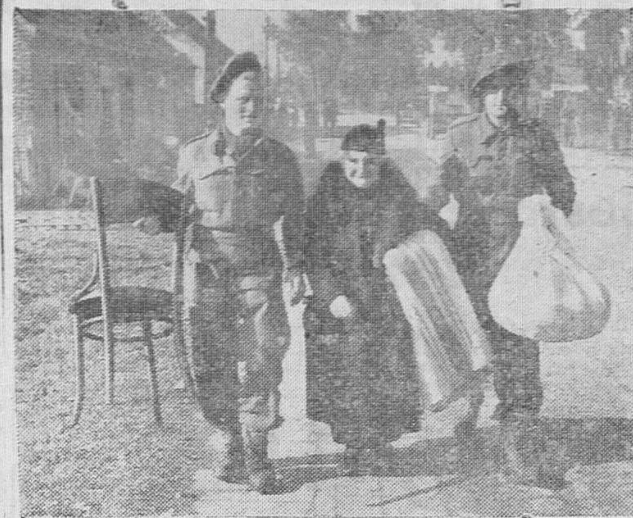
Dos soldados ingleses ayudan a esta anciana a trasladar su ajuar a otra población distante de la ciudad ocupada, convertida en primera línea