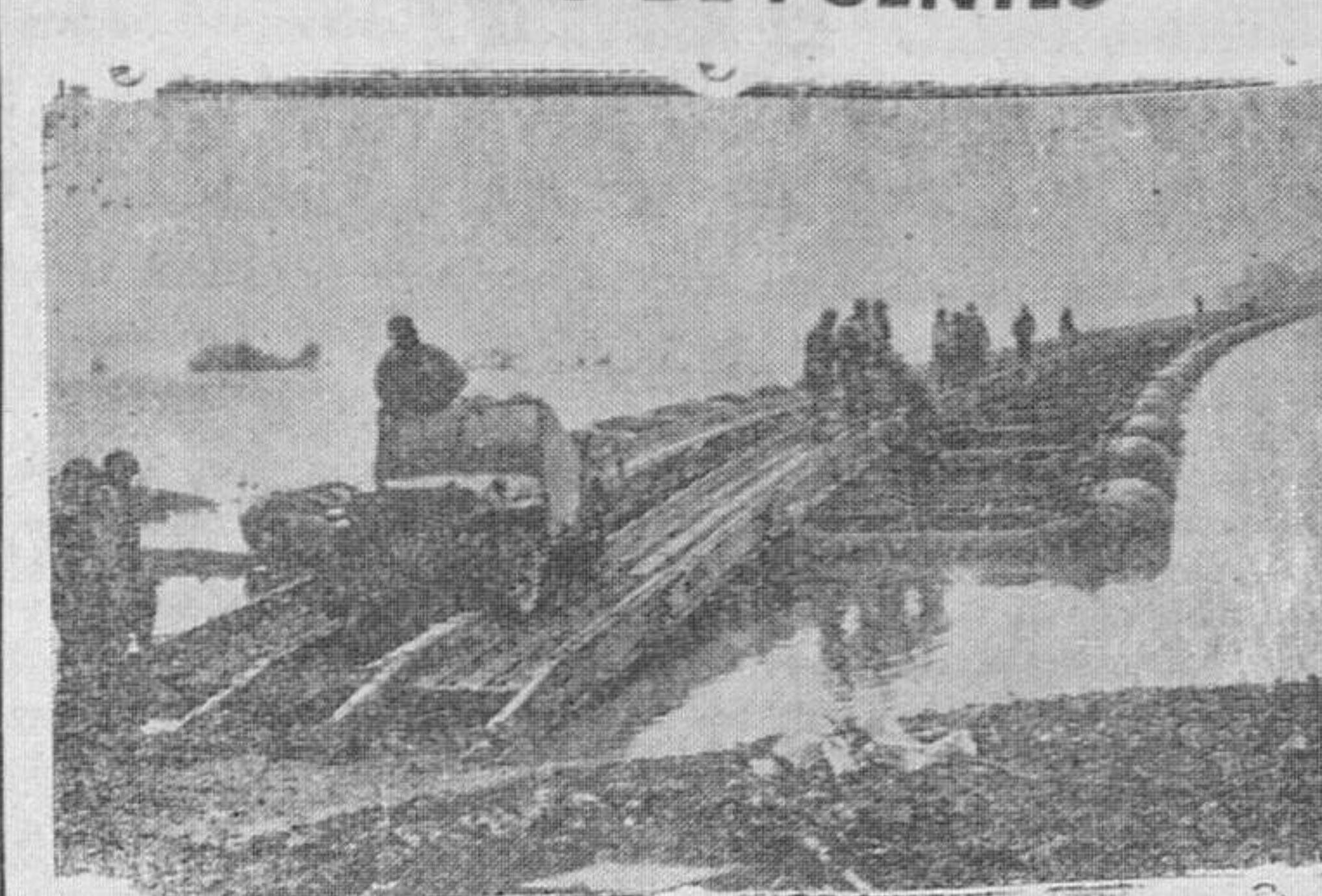
Fuerzas de ingenieros norteamericanos, improvisando un puente con barcazas, para atravesar un río, en el frente Occidental