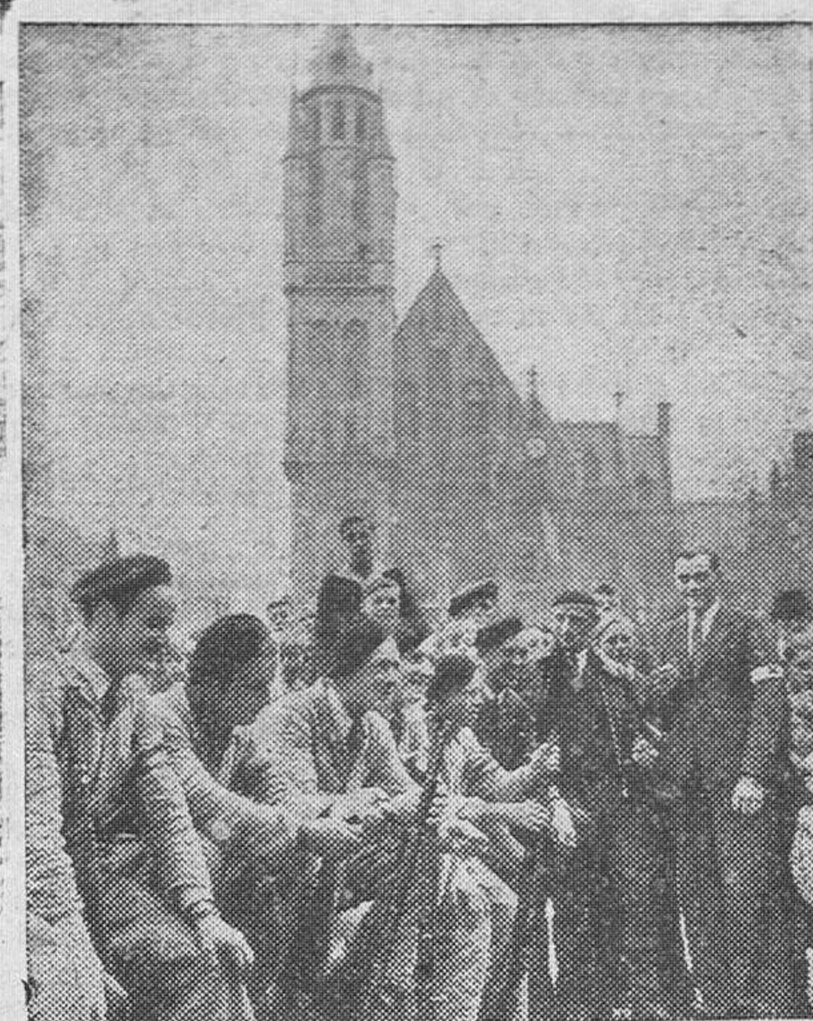
Miembros del ejército clandestino belga descansan en la plaza de una villa liberada