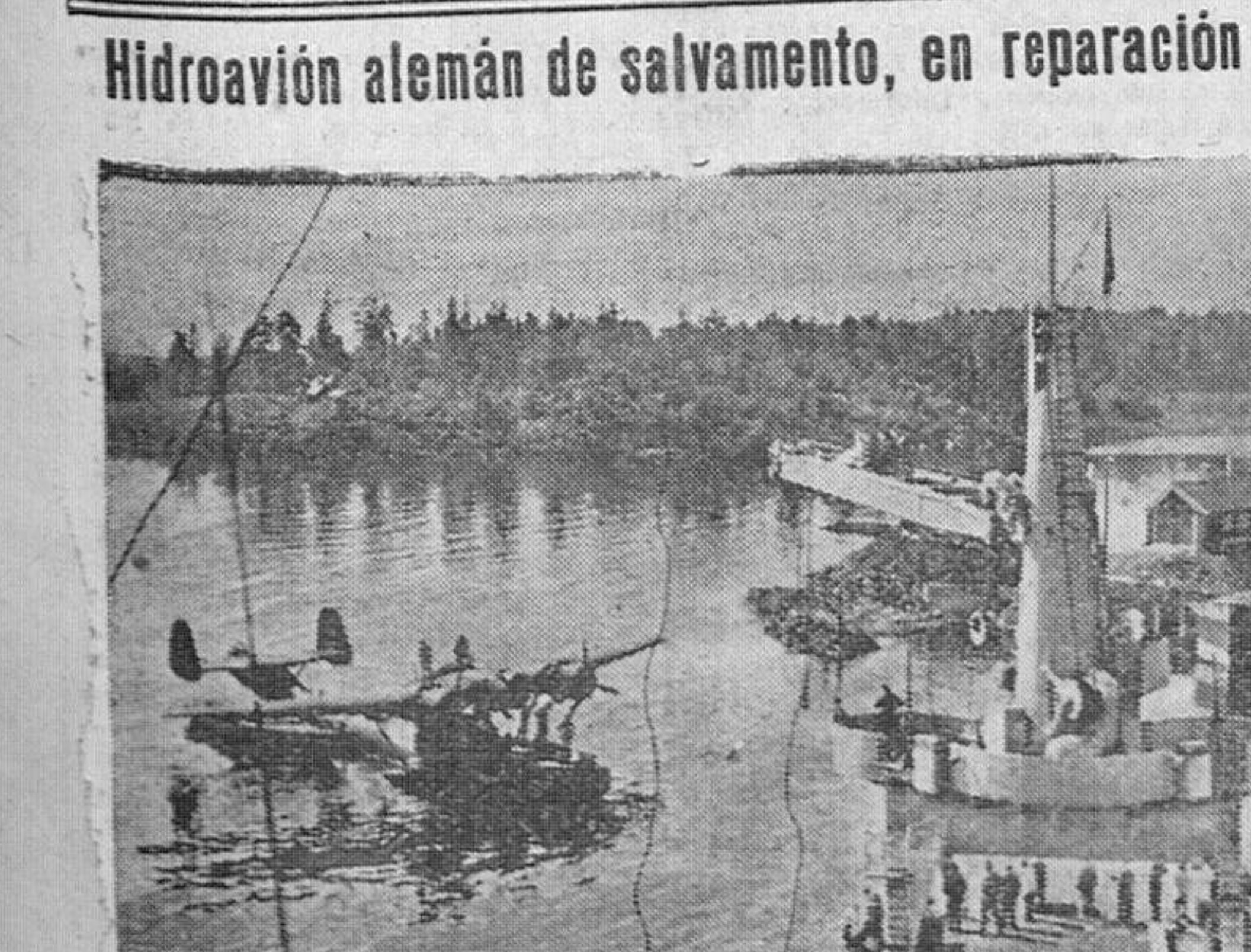
Un hidroavión del tipo "DO 24" repara averías para partir pronto otra vez en busca de naufragos