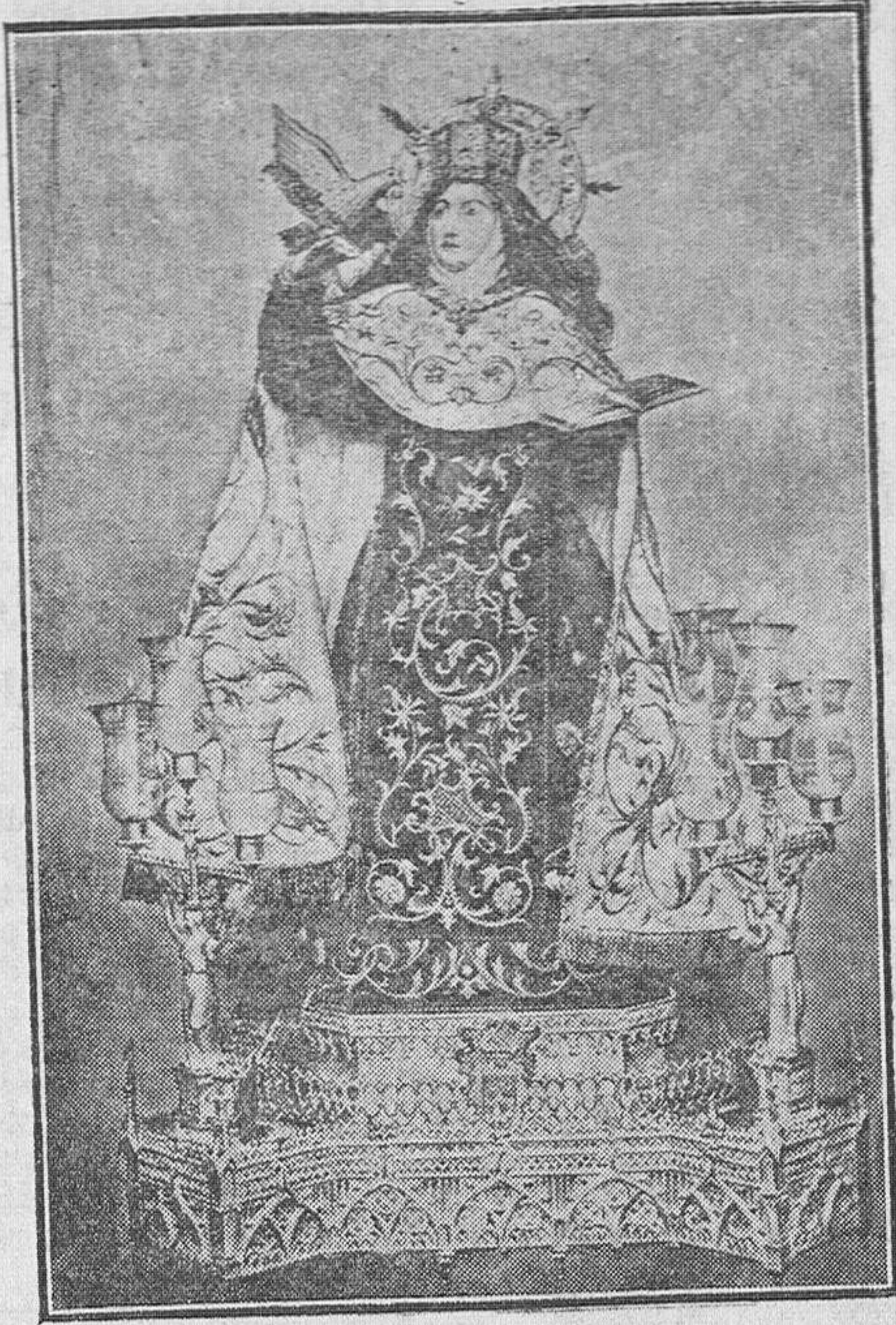
Imagen de Santa Teresa de Jesús, como se venera en la iglesia de las Madres Carmelitas de Alba de Tormes

Española, andariega, audaz, inquieta, mujer Santa, mujer fuerte, cuando a una empresa se lanza llena de fe y esperanza, ningún temor la sujeta. Para ella no existe suplicio más fiero, que el de quien no puede por Dios padecer, la Santa dice, por no morir muero, y es al fin tan alta la vida que espero, que en el martirio hallo placer.