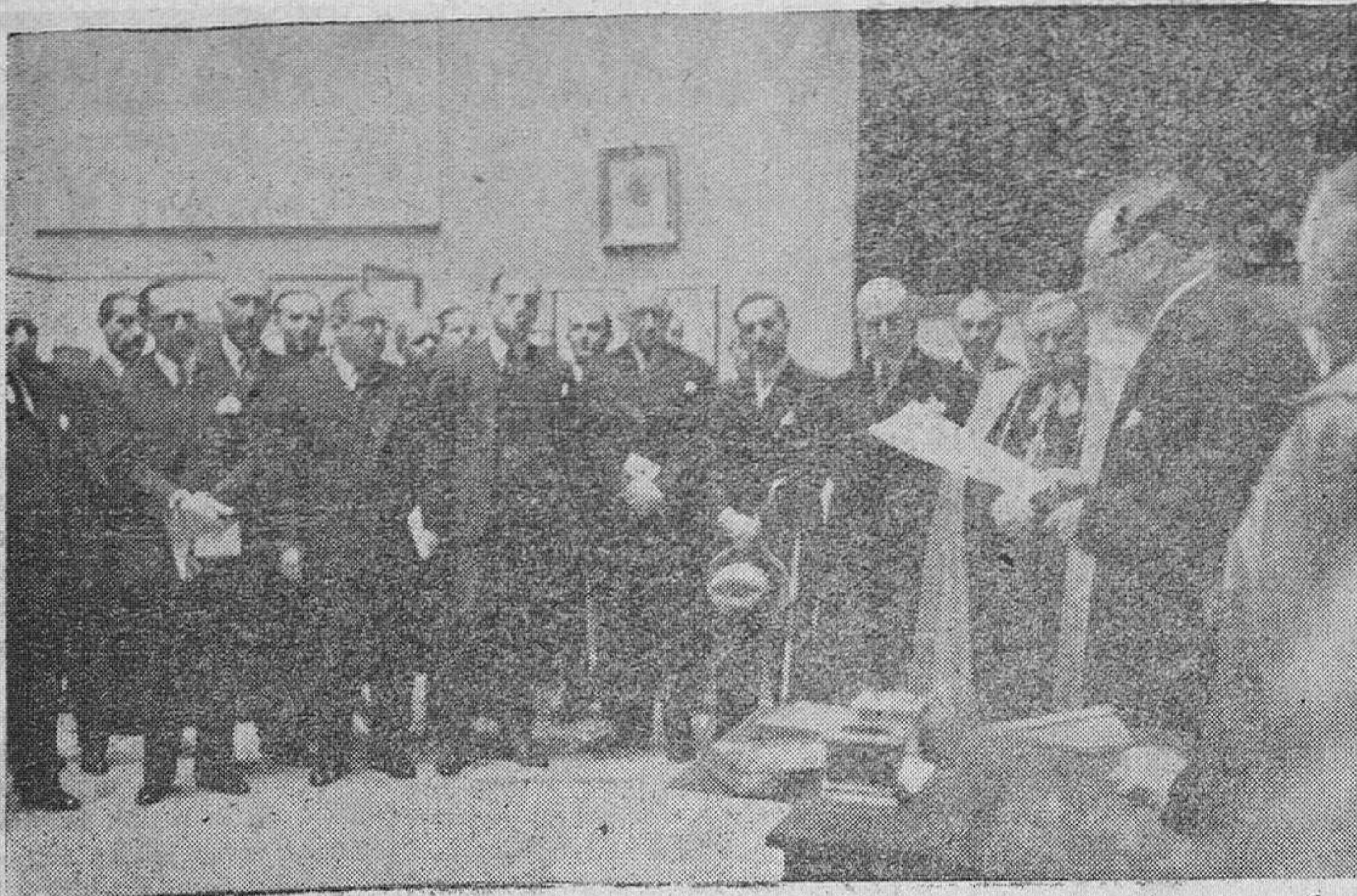
El ministro de Asuntos Exteriores, señor Lequey, pronunciando un discurso ante los representantes diplomáticos de los países hispano-americanos, durante la recepción con motivo del "Día de la Hispanidad"