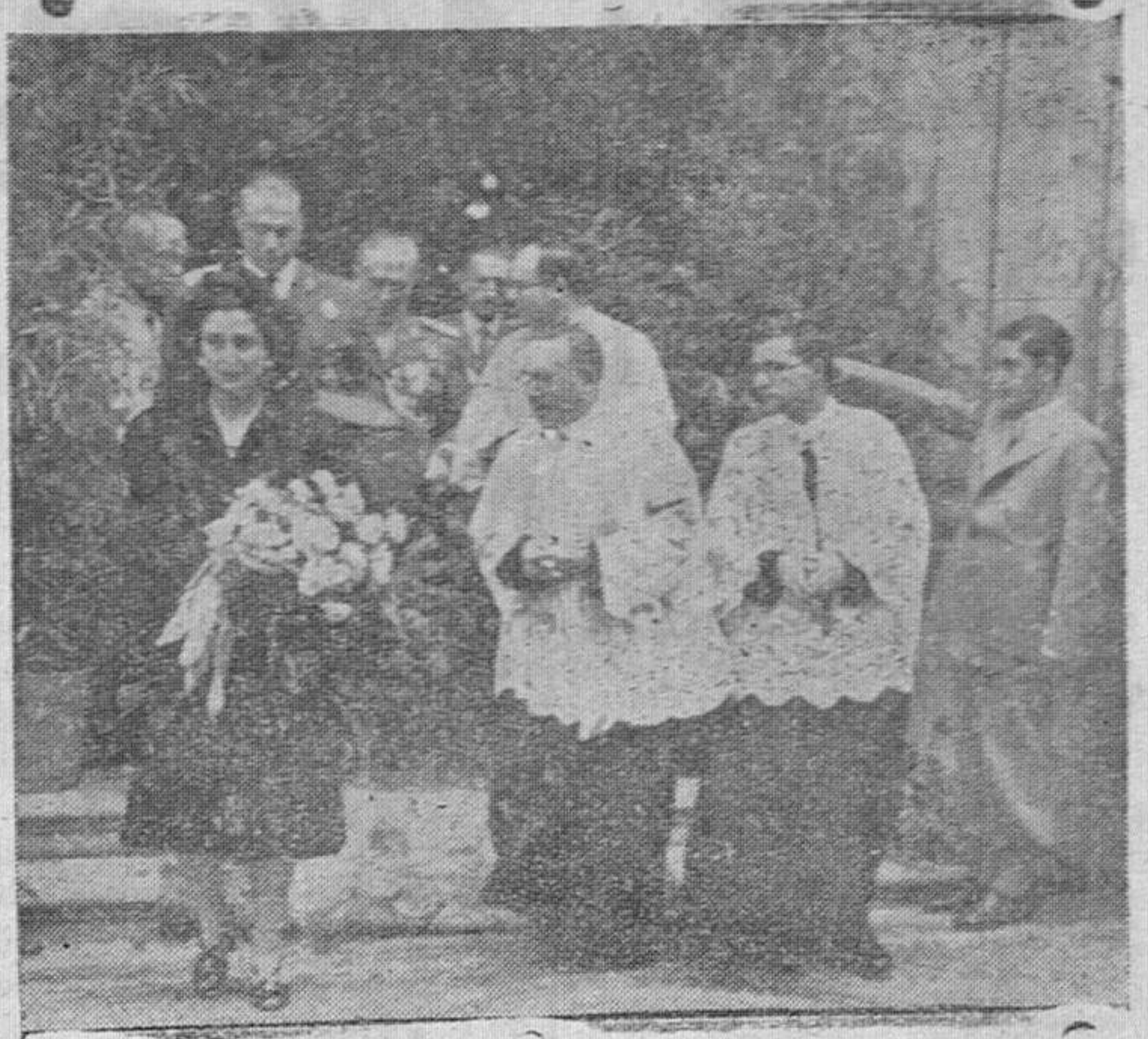
La esposa de Su Excelencia el Jefe del Estado, el ministro de la Gobernación y otras autoridades, saliendo del templo de los Redentoristas, después de la solemne función religiosa organizada por el benemérito Instituto de la Guardia civil, en honor de su Patrona la Virgen del Pilar