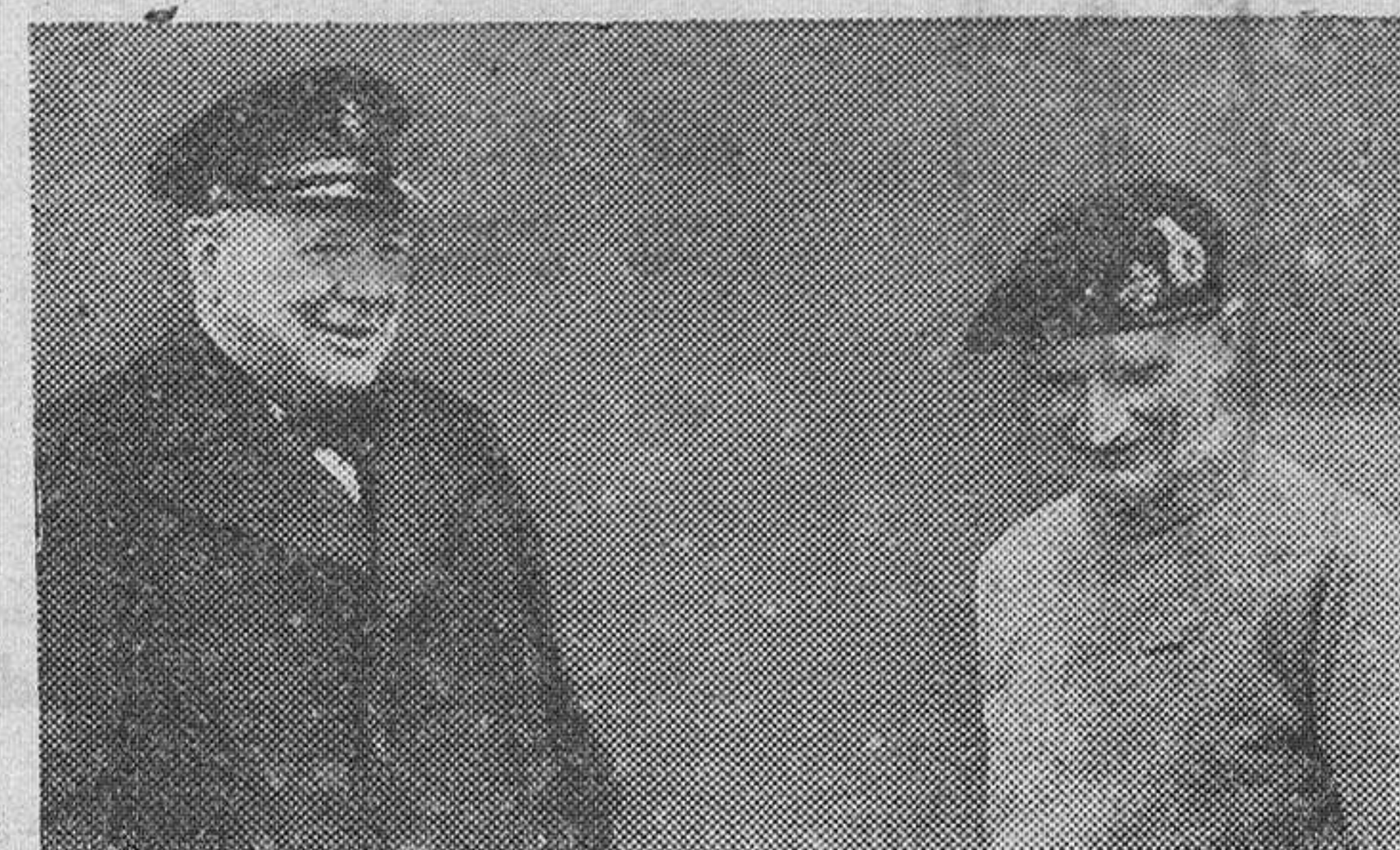
El primer ministro británico, durante una visita que hizo al general Montgomery, en el Cuartel general