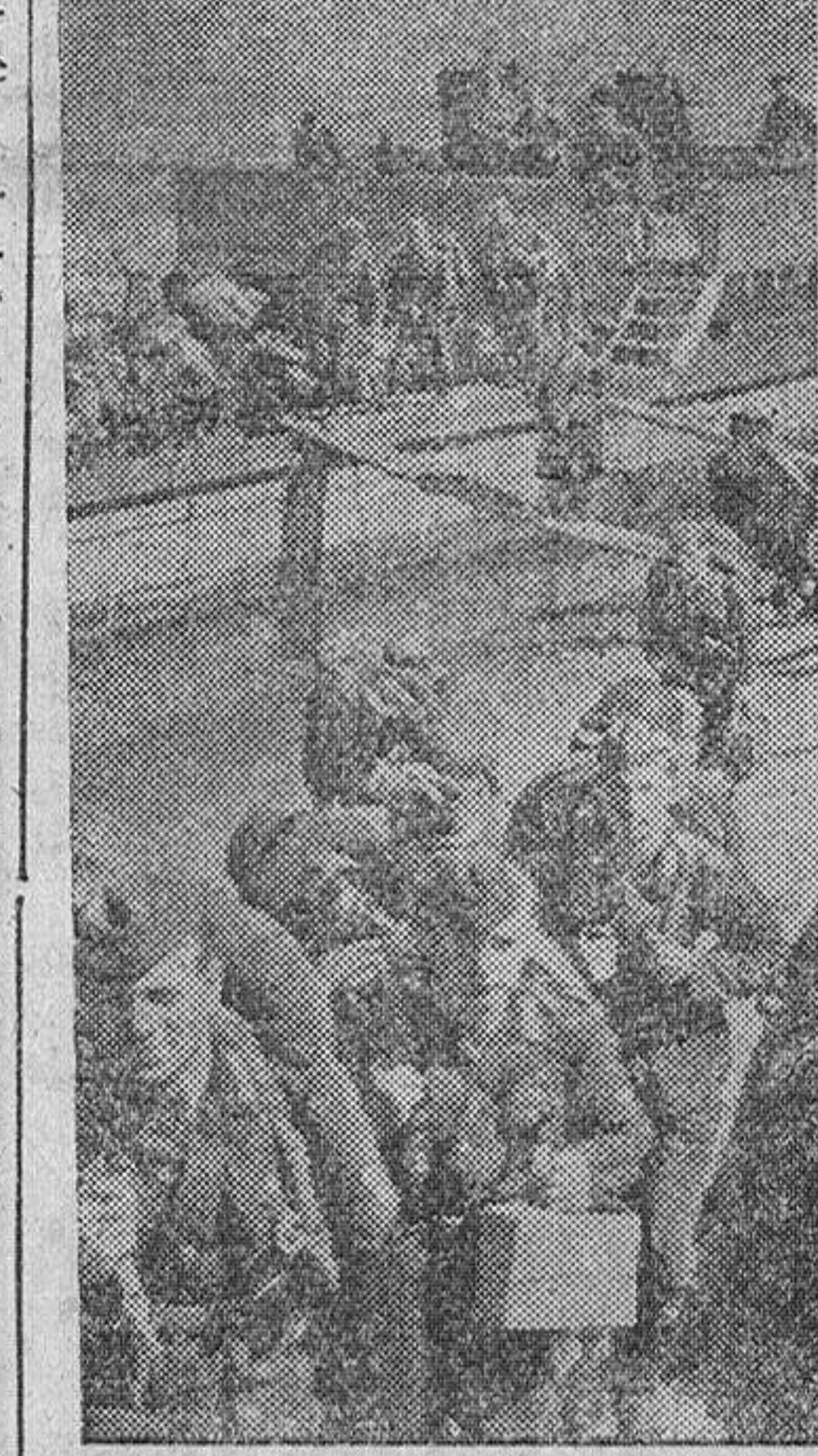
El transporte ha llegado con nuevas tropas alemanas. Pronto las que han luchado hasta este momento, podrán disfrutar un merecido descanso