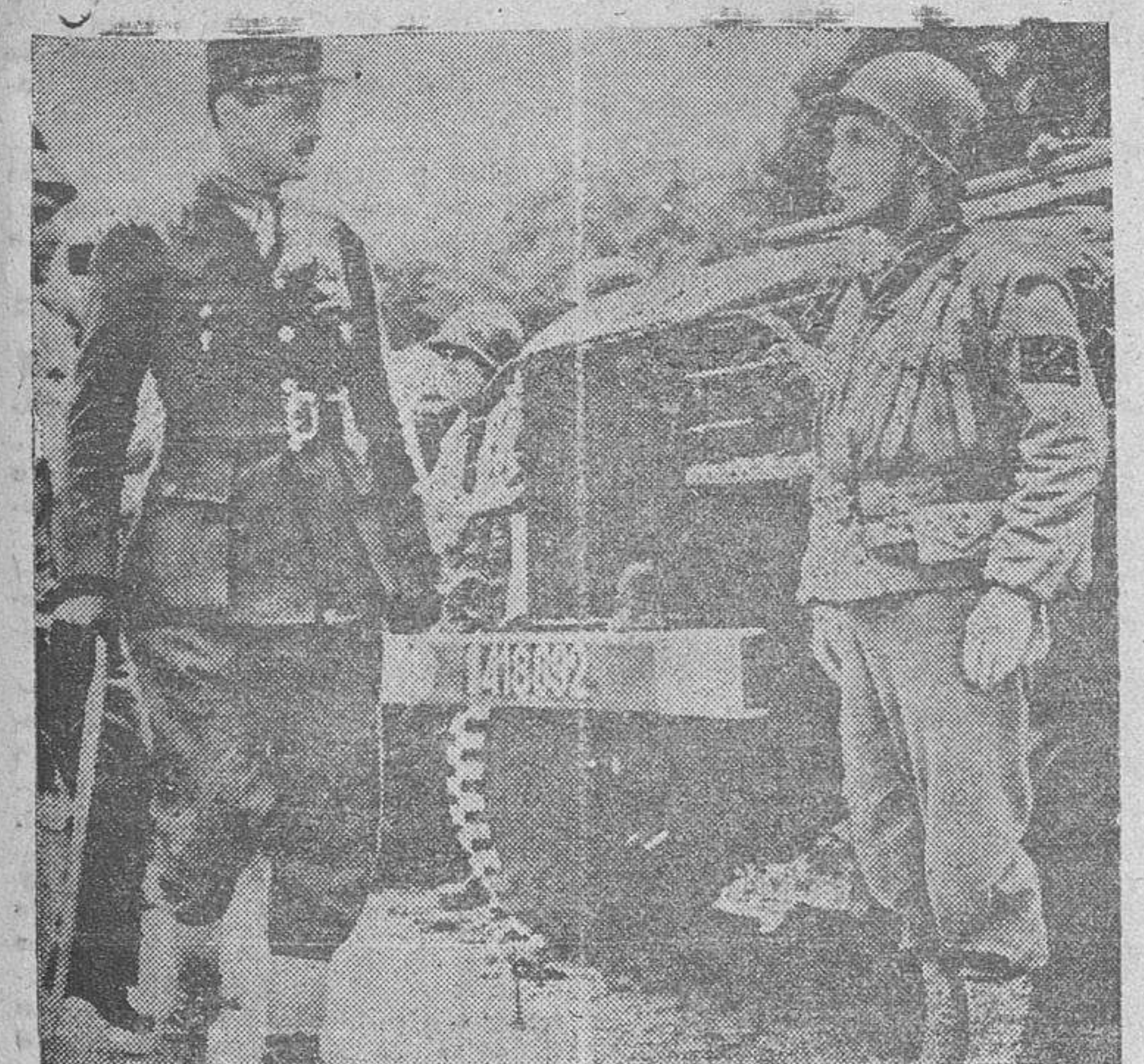
El general Leclerc, jefe de las fuerzas francesas, inspeccionando una división motorizada que marcha al frente.