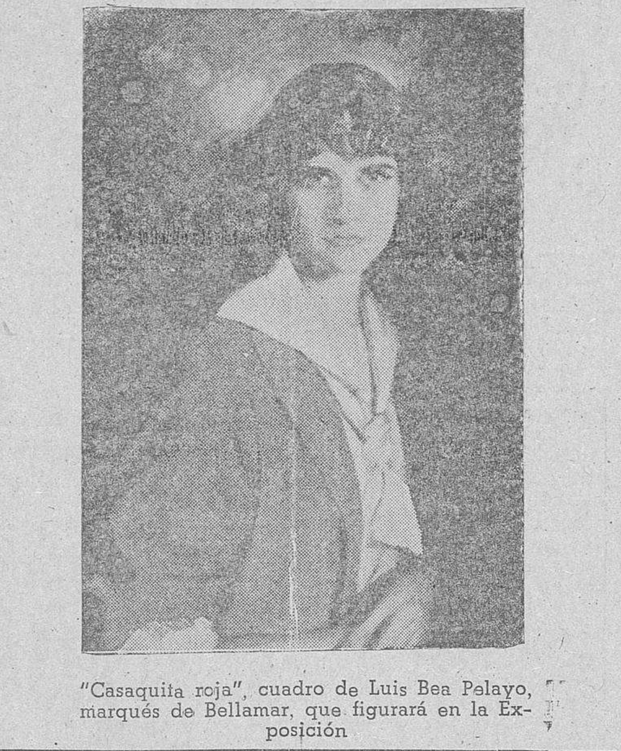
"Casaquita roja", cuadro de Luis Bea Palayo, marqués de Bellamar, que figurará en la Exposición