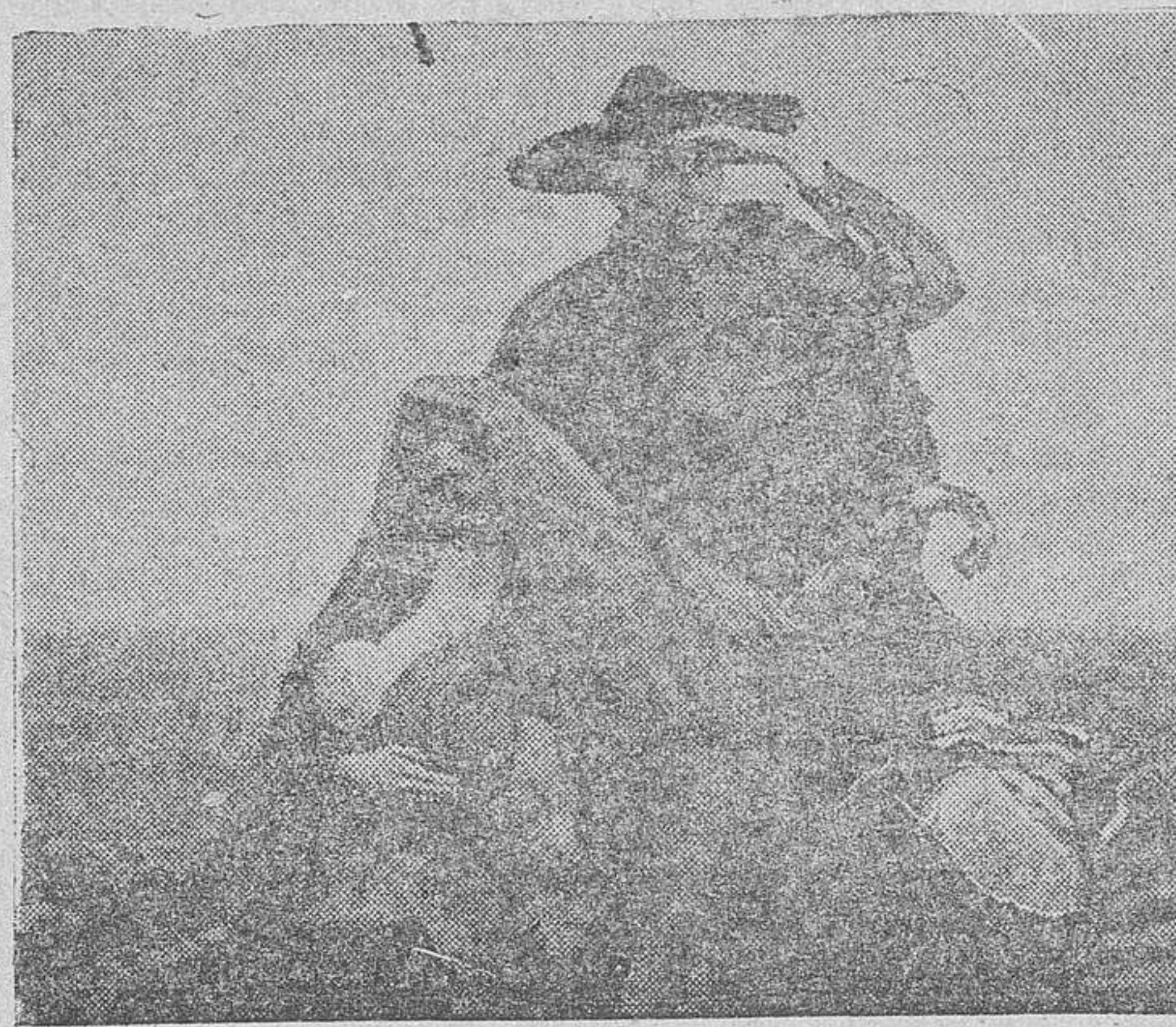
"Castilla", magnífico cuadro de Caprotti da Monza, que figurará en la primera Exposición Española de Pintura y Escultura, organizada por el Casino de Salamanca, con la protección de la Diputación y Ayuntamiento, y que promete constituir un gran acontecimiento artístico