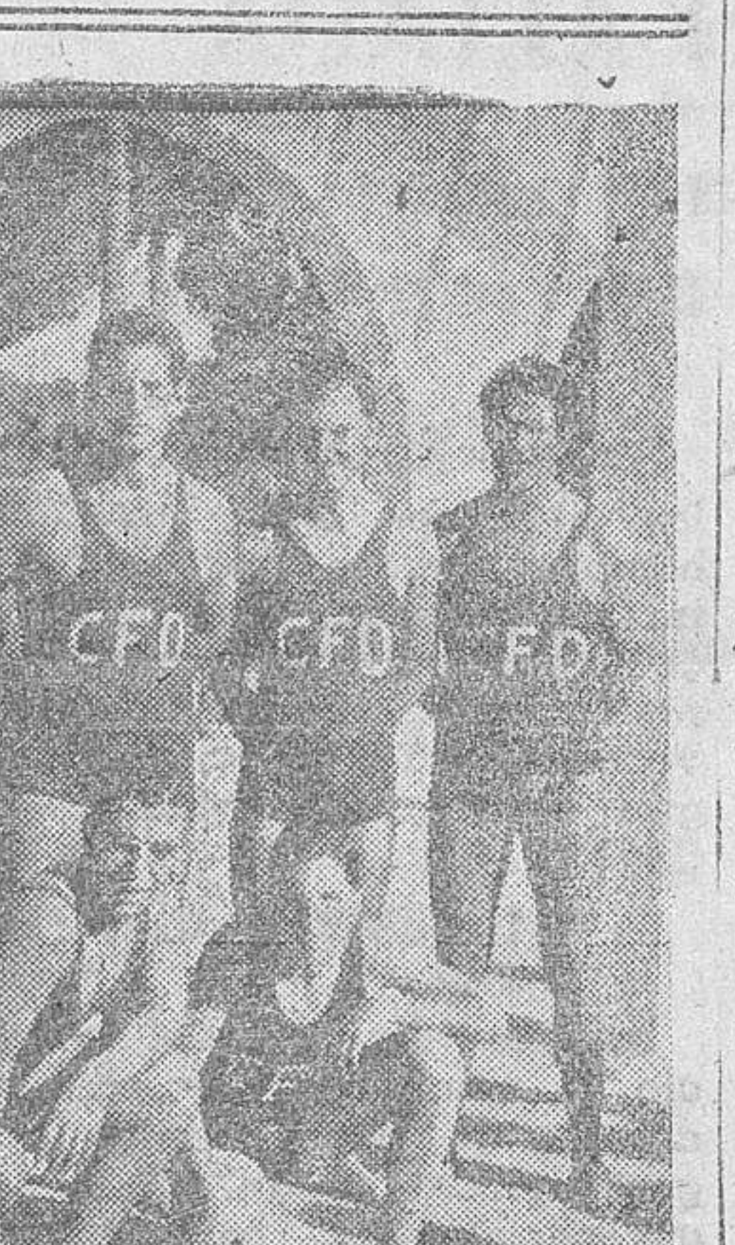
Equipo de nadadores del Club Fluvial, vencedor del partido de polo acuático...