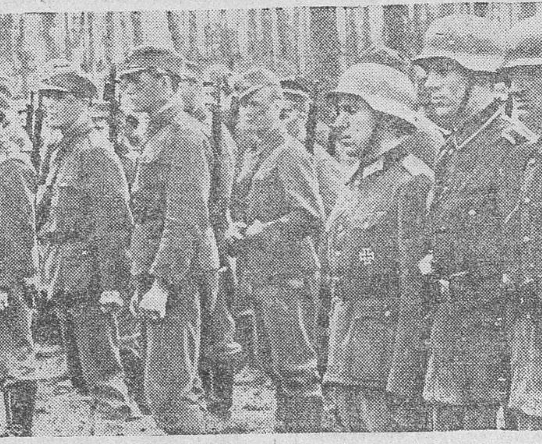
En un sector del frente germano-finlandés, se alinean soldados de las dos naciones aliadas para pasar la lista diaria.