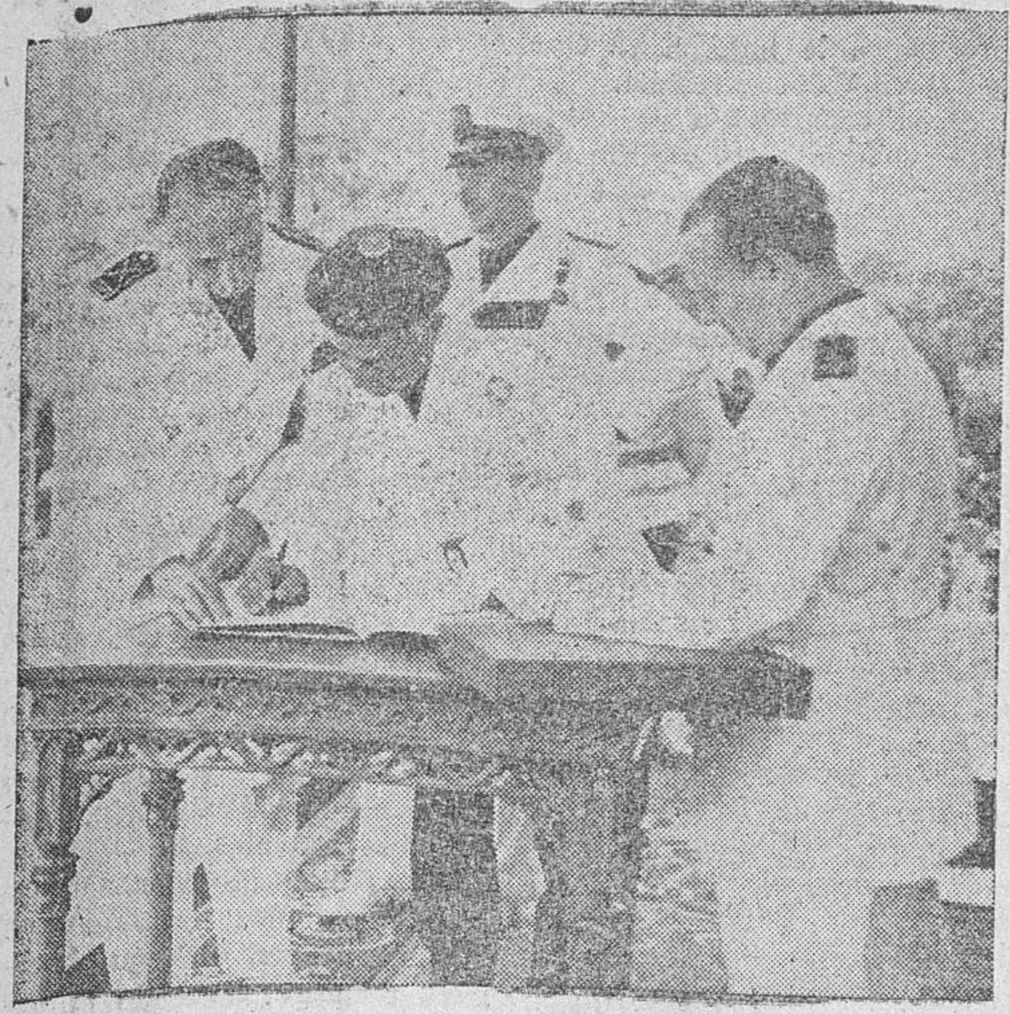
El Generalísimo Franco firmando la entrega simbólica de viviendas protegidas, antes de presenciar el magno desfile de productores.