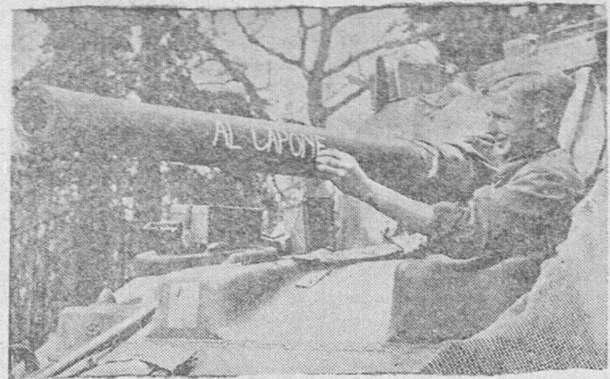
Una nota de humor durante el "último minuto" anterior a la invasión

Todos los días, en el mando del Cuartel General tenía lugar una conferencia para ultimar los detalles de los movimientos del día siguiente. A la conferencia asistían elementos militares y la policía civil y representantes de los ferrocarriles. Se hacía un índice determinando hora en que cada convoy se pondría en movimiento y el tiempo empleado en cada trozo de camino. Determinaba los trenes que harían falta, en qué estaciones y en qué hora. Cada hombre de la división tenía su sitio en aquel índice y tenía que permanecer en él. Cuando se ultimaron todos los detalles, la 190 se puso en movimiento, los índices fueron copiados y entregados por los motoristas, por una parte, a las unidades afectadas, y por otra, al personal de control que debía inspeccionar el tráfico diurno. Pasada media noche, cada uno