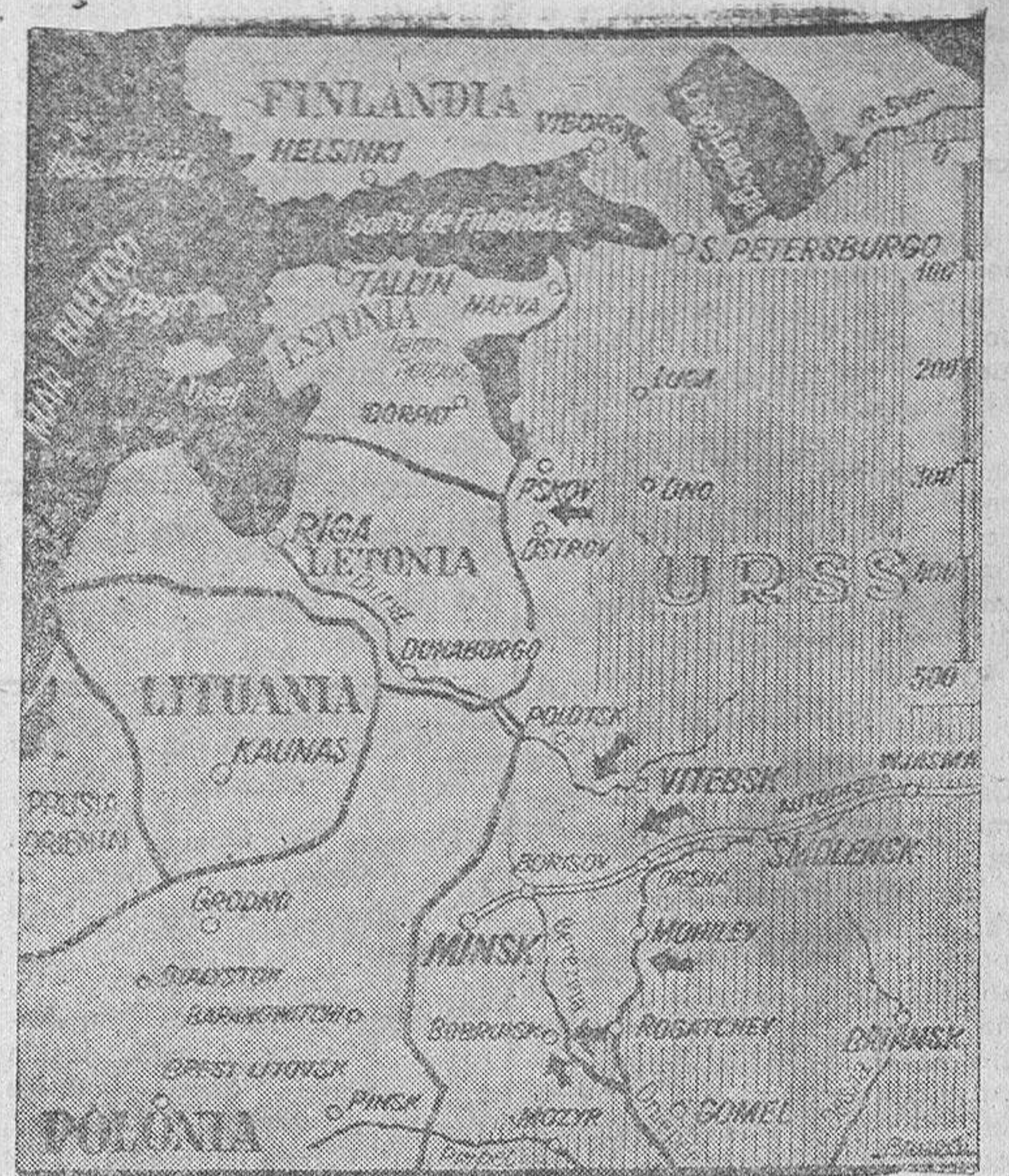
El rayado vertical señala la situación del Ejército bolchevique, y las flechas, las direcciones del ataque, que tienen a Minsk como objetivo estratégico

"En la parte occidental del istmo de Carelia, la presión enemiga fué especialmente fuerte entre Suomea-Vednopolja y Tali. En encarnizados combates,