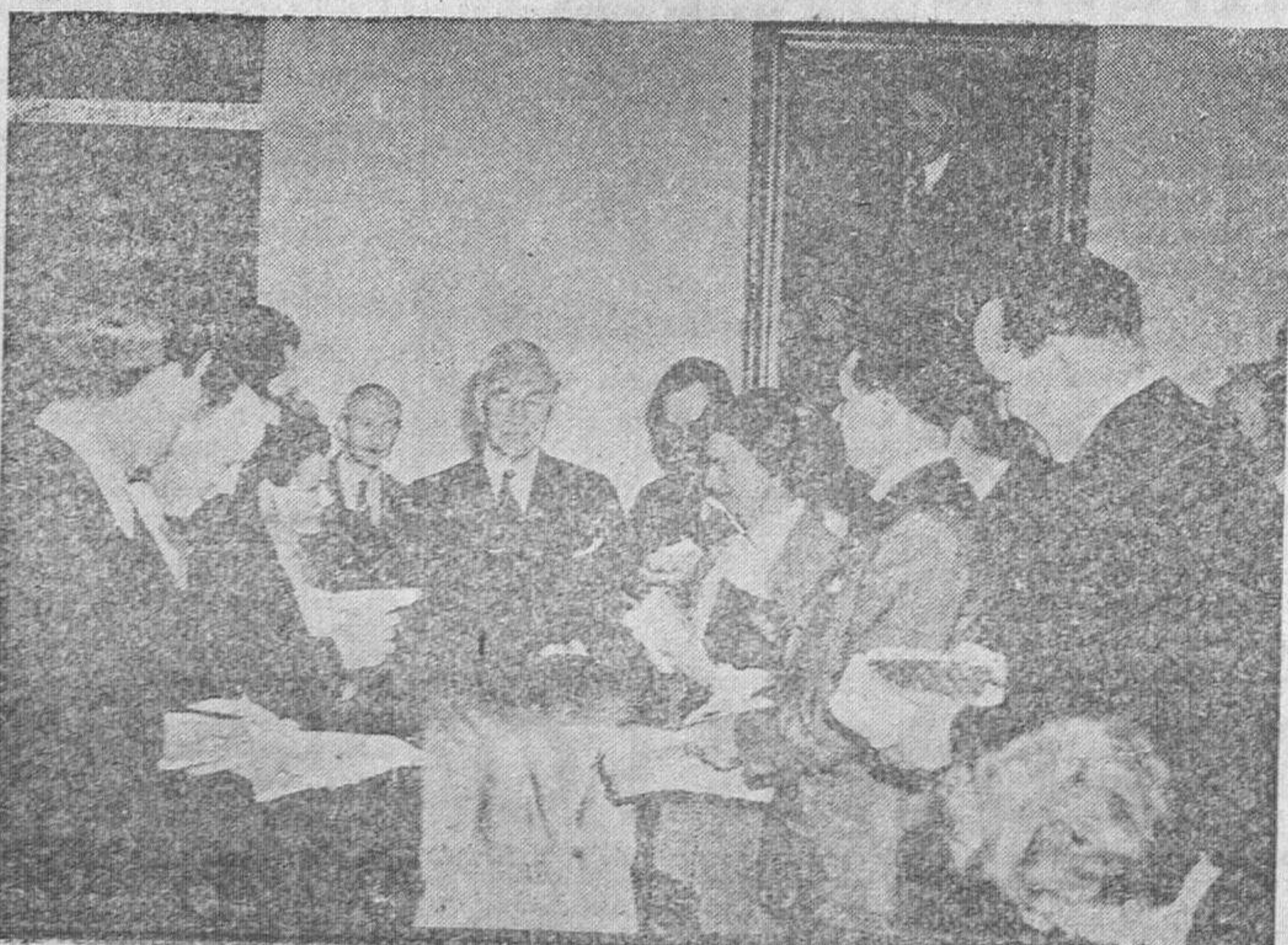
El secretario de Estado norteamericano, Cordell Hull, haciendo las primeras declaraciones a la prensa neoyorquina, pocos días después de haber comenzado la invasión de Europa.