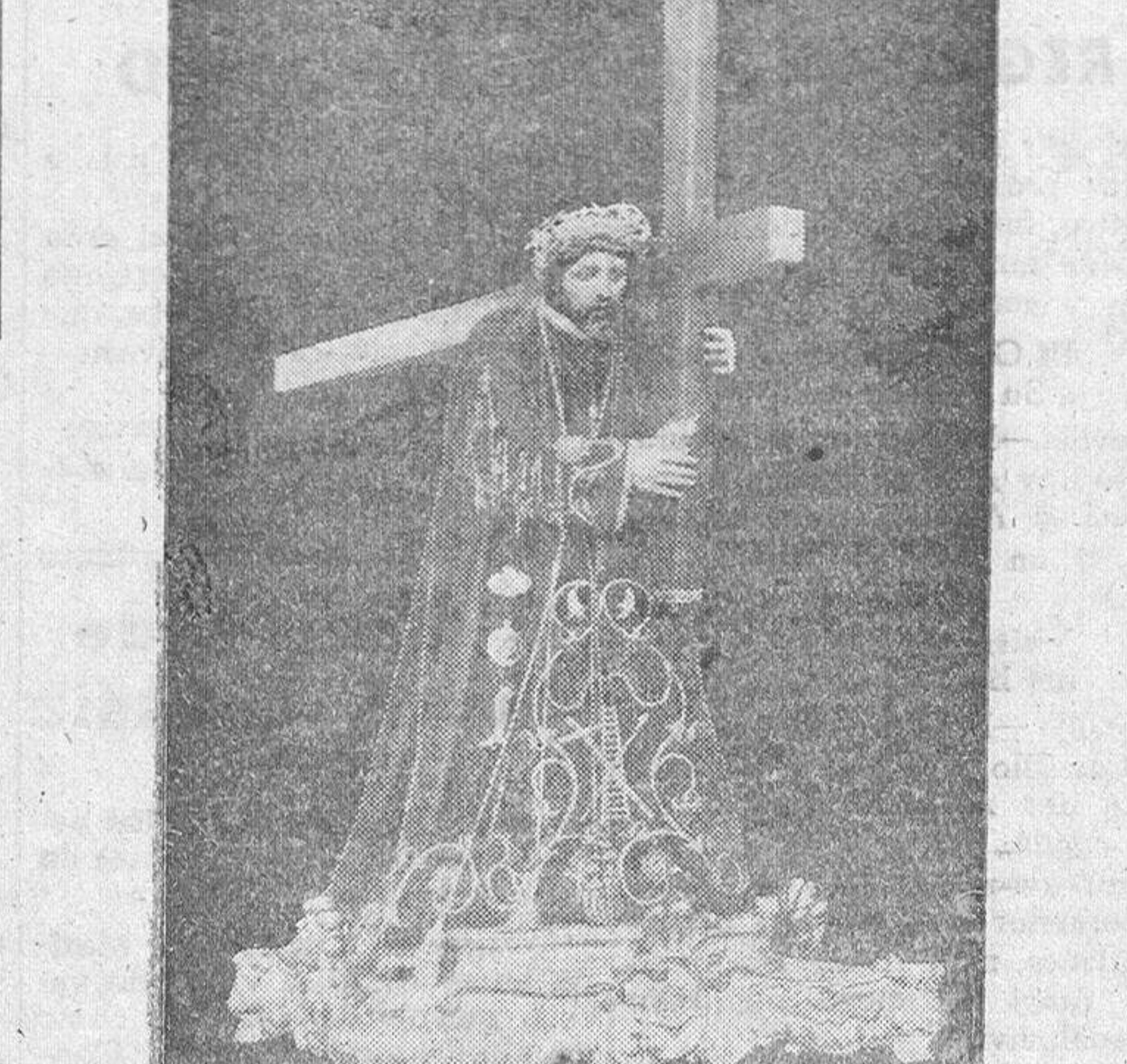
Jesús Nazareno, EL CORDERO. San Felices de los Gallegos. (M. P. P. P.)

Terminó el señor Magistral en medio de la interesante atención de la importante muchedumbre que llenaba nuestro templo catedralicio, pidiendo al divino Nazareno, en amorosa súplica, una