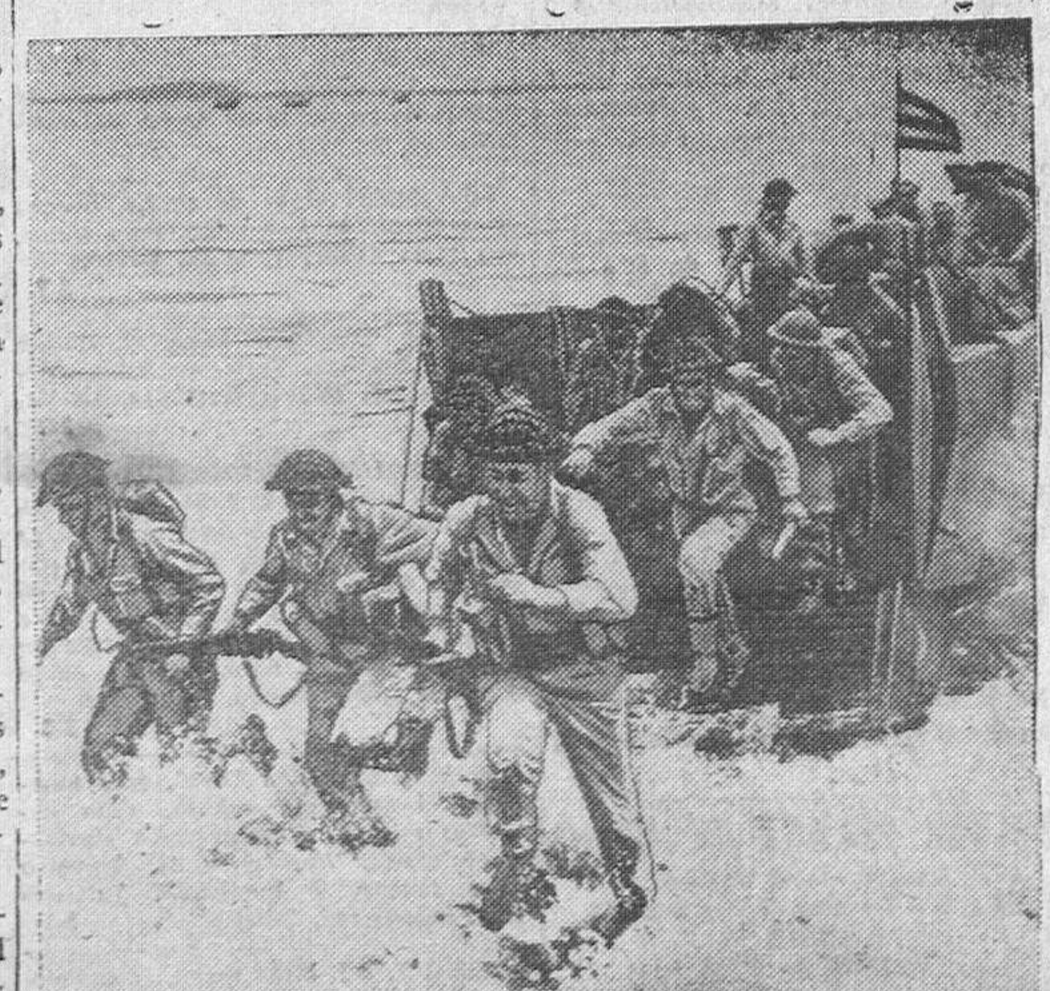
Soldados neozelandeses desembarcan en una isla del Pacifico, durante una fase de la lucha en aquel sector de combate

Combate aéreo sobre territorio húngaro. Berlín.—Hacia el mediodía de hoy se han librado intensos combates aéreos sobre territorio húngaro en el sector del norte del lago Platten, entre las