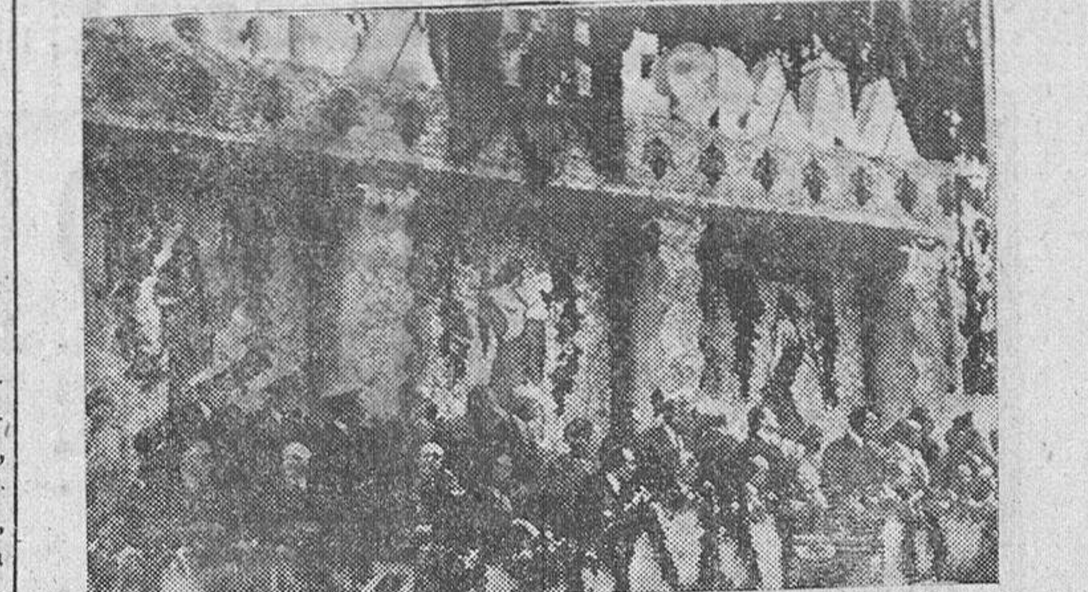
Un aspecto de la tribuna presidencial, ocupada por los ministros Secretario, Educación Nacional y Marina, autoridades y jerarquías, desde la que presenciaron la gran batalla de flores