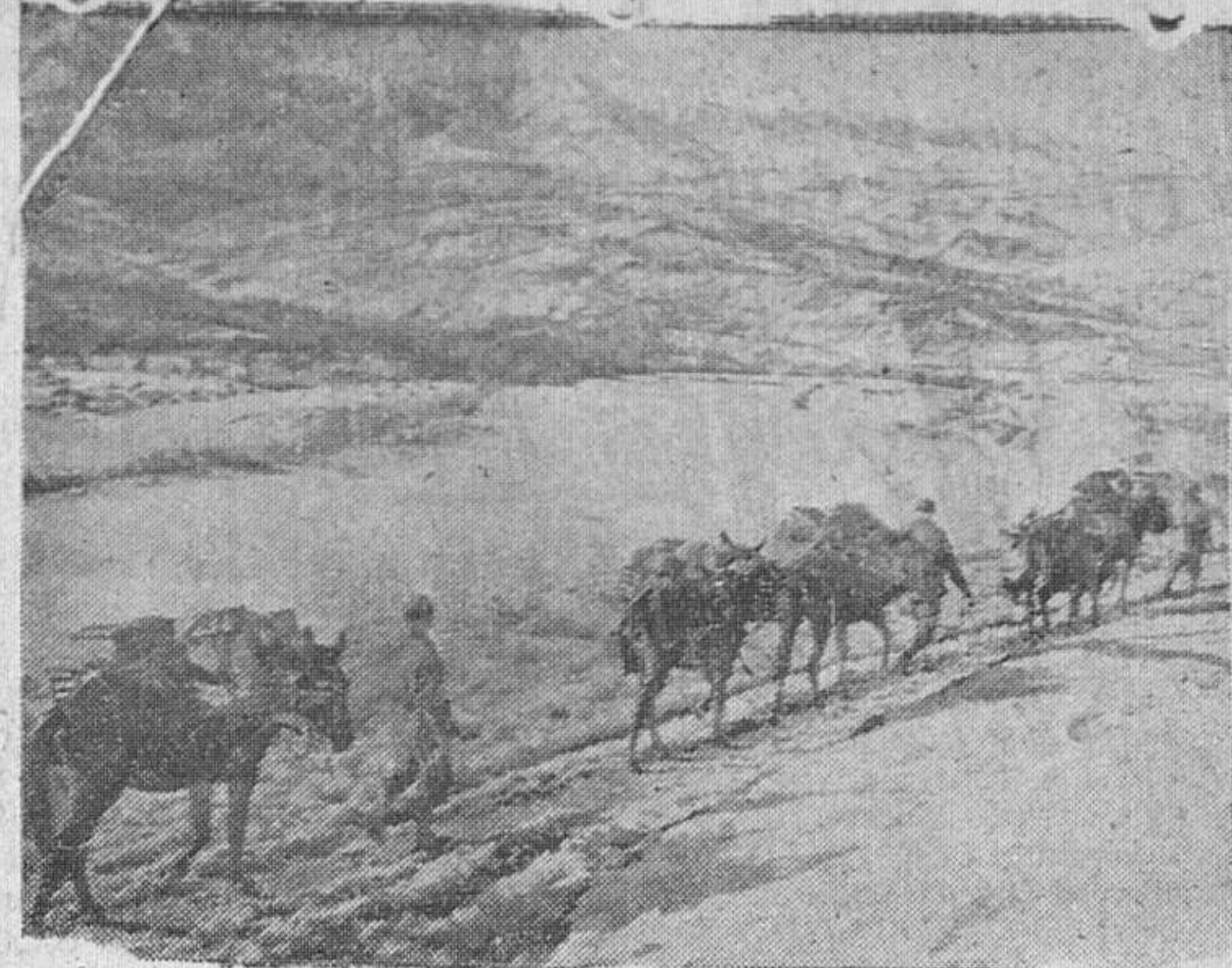
Los aprovisionamientos del Octavo Ejército se realizan con grandes dificultades, teniendo que recorrer considerables distancias por entre las montañas nevadas