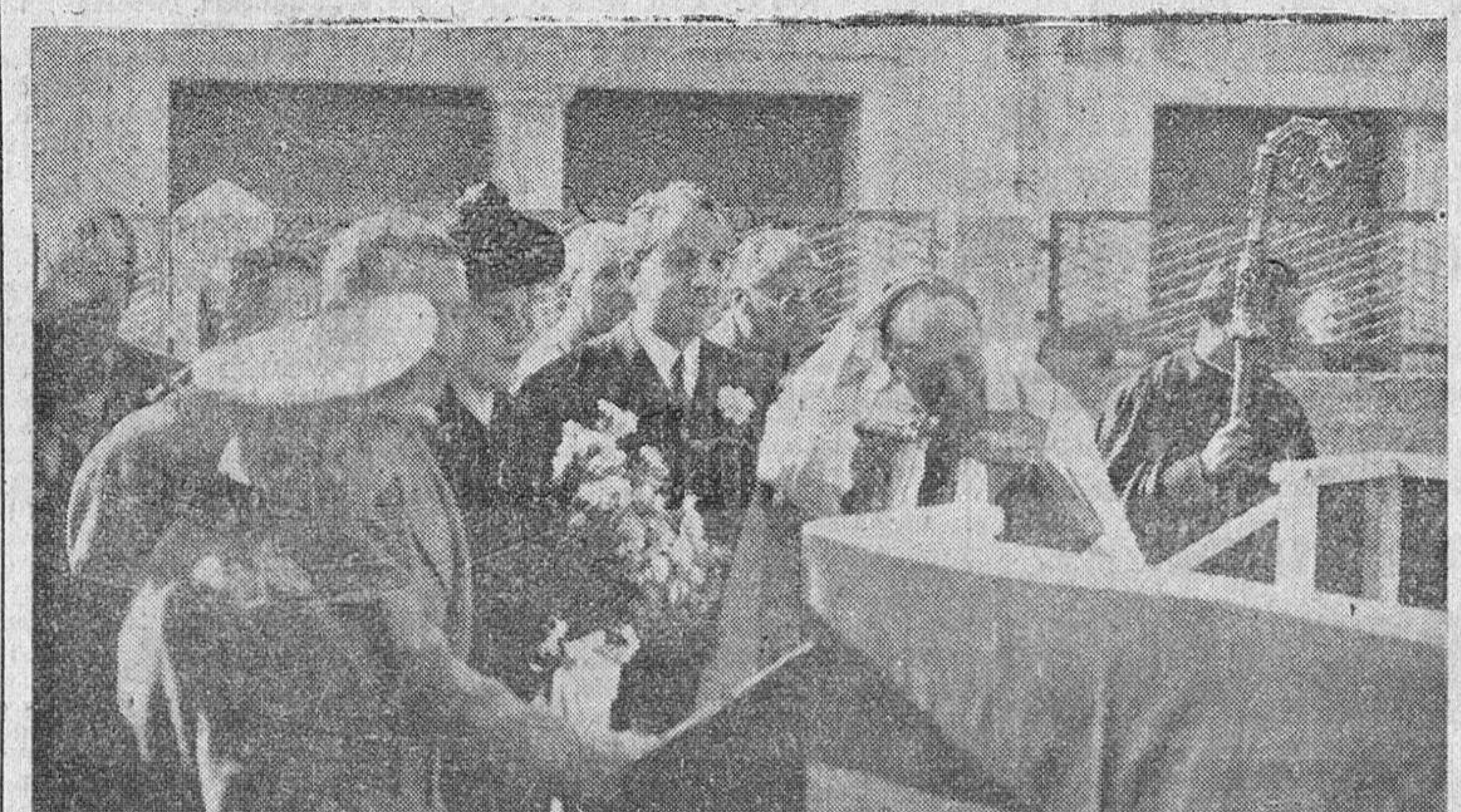
Autoridades civiles, militares y eclesiásticas, acompañando a la madrina en el momento de la bendición (Información en cuarta plana.)