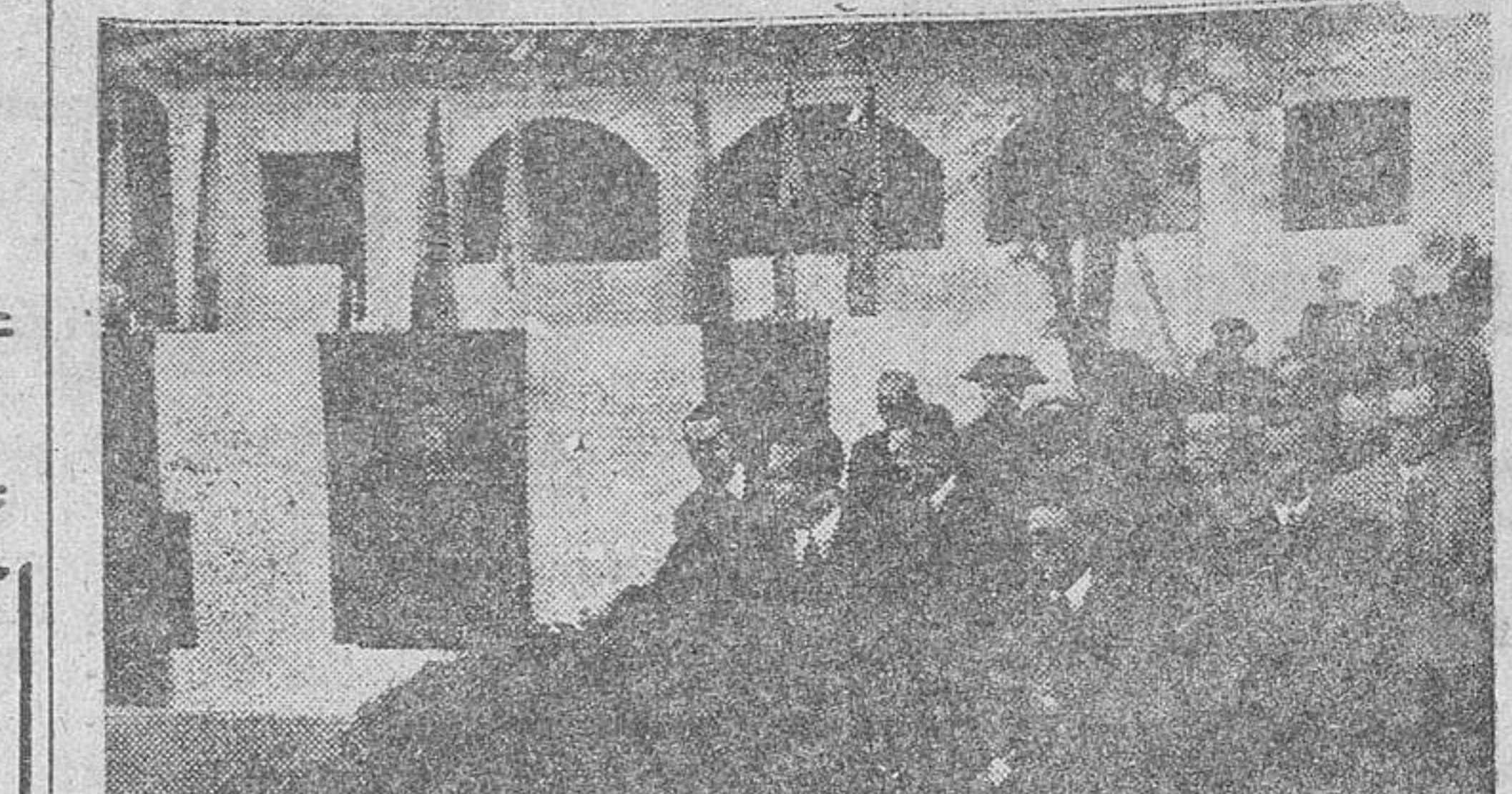
El ministro de la Gobernación, don Blas Pérez, recorriendo las instalaciones del Sanatorio Leprológico Nacional, inaugurado el miércoles, en Trillo (Guadalajara).