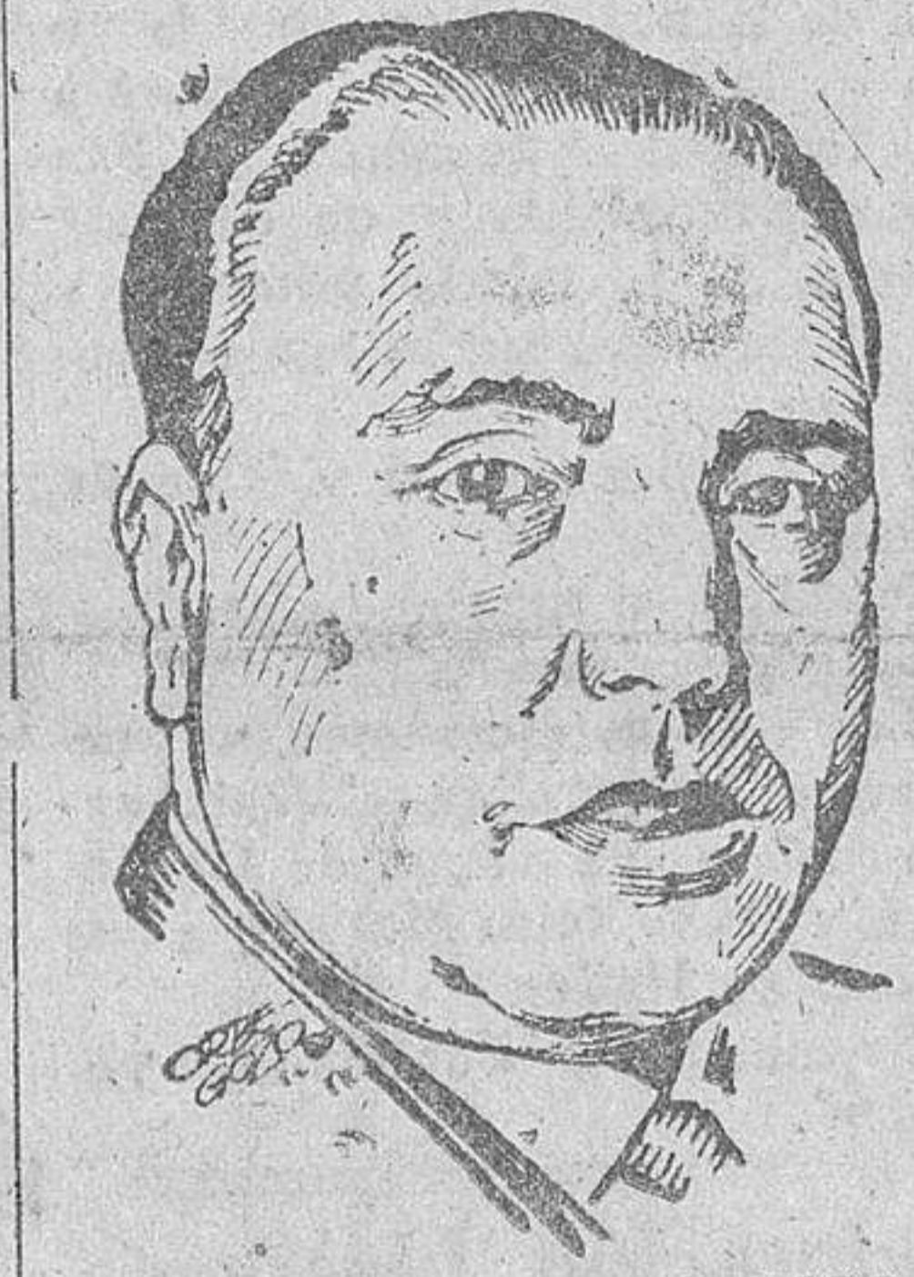
DON EDUARDO AUNOS Ministro de Justicia