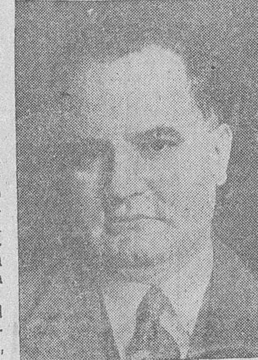
D. DEMETRIO CARCELLER Ministro de Industria y Comercio