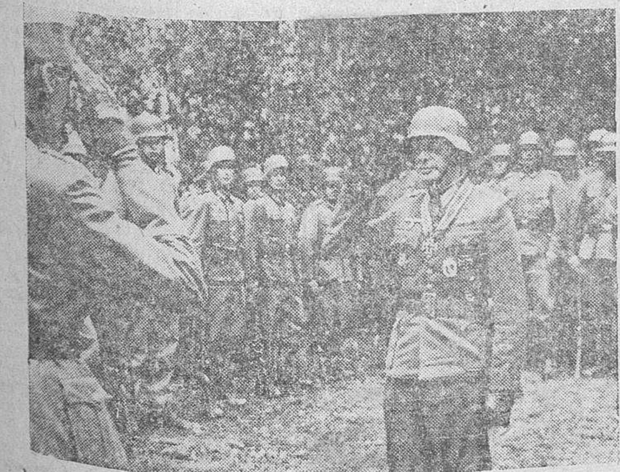
Momento en que un oficial alemán es condecorado, por su brillante actuación en el frente ruso.