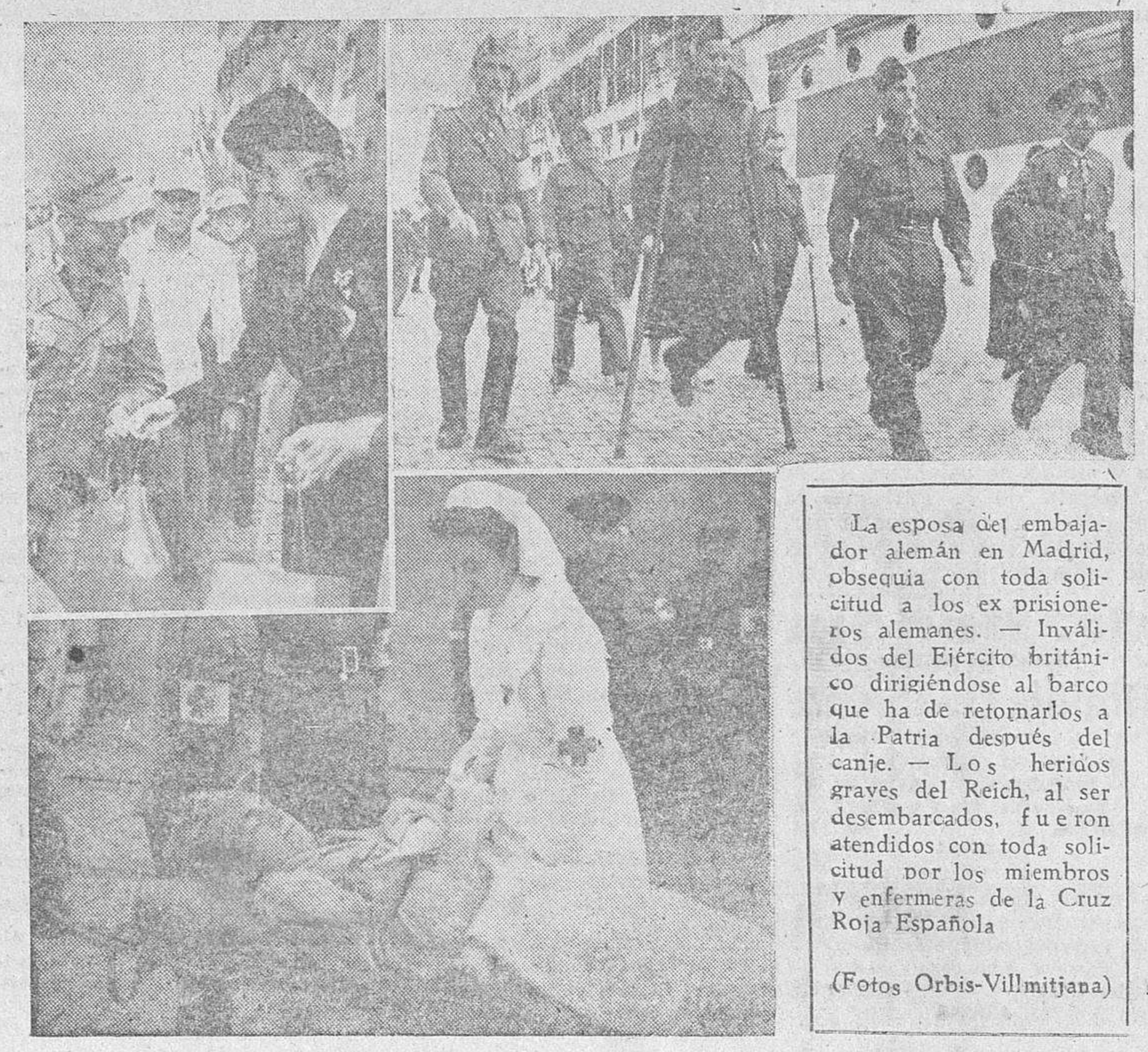
La esposa del embajador alemán en Madrid, obsequia con toda solicitud a los ex prisioneros alemanes. — Inválidos del Ejército británico dirigiéndose al barco que ha de retornarlos a la Patria después del canje. — Los heridos graves del Reich, al ser desembarcados, fue ron atendidos con toda solicitud por los miembros y enfermeras de la Cruz Roja Española