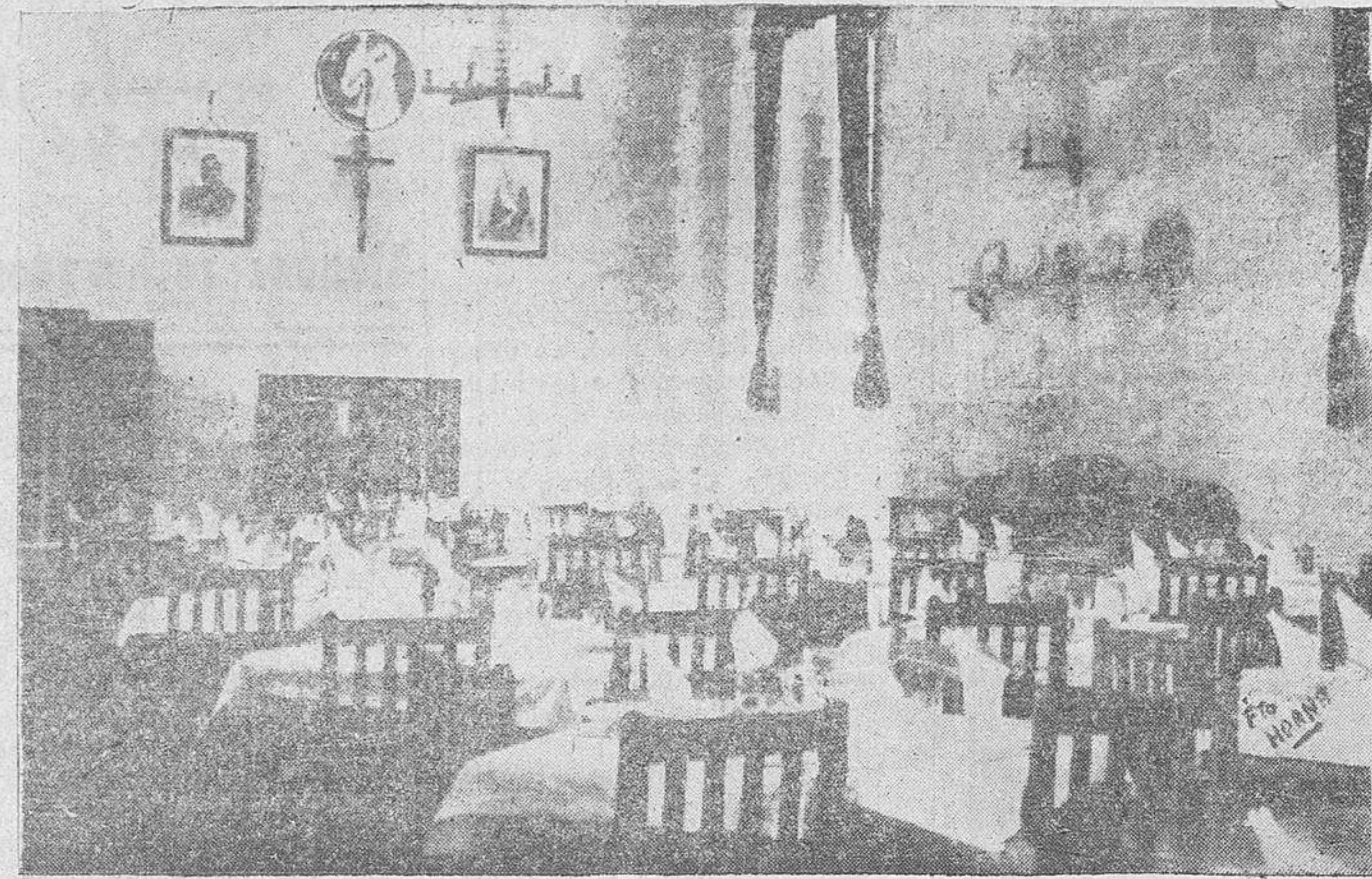
Uno de los magníficos comedores de Auxilio Social en Salamanca

... superada en el octavo, como lo ha sido respecto a los anteriores, para llegar a su capacidad total, en bien de los necesitados y de las generaciones que, salvadas del abandono, harán posible—por su formación física y espiritual—realidades sorprendentes que para España soñamos.