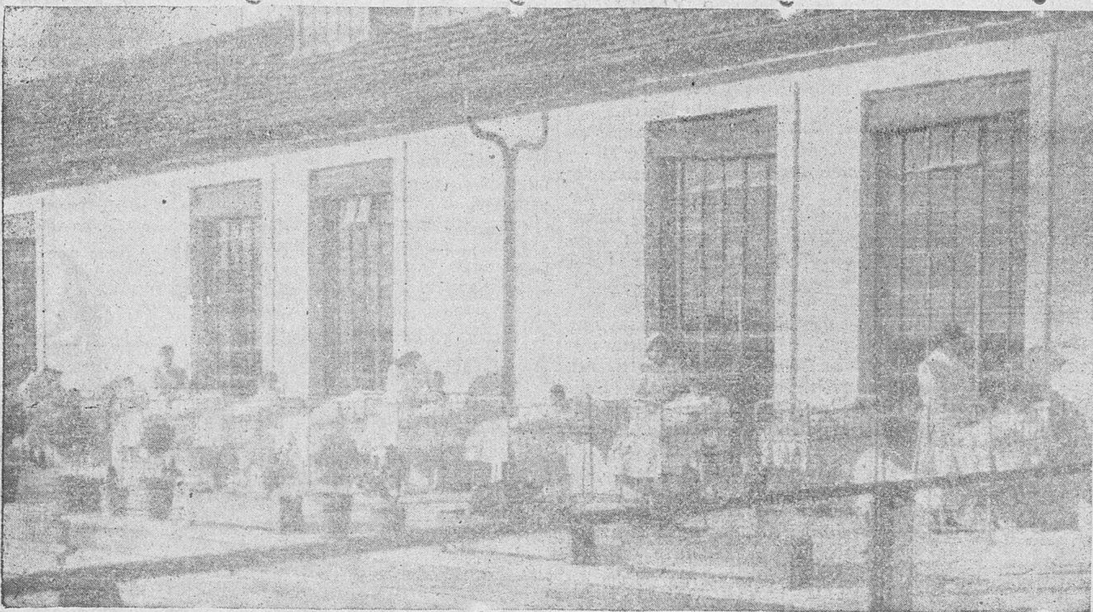
El Hogar-Cuna "Hermandades", verdadero modelo de residencia infantil