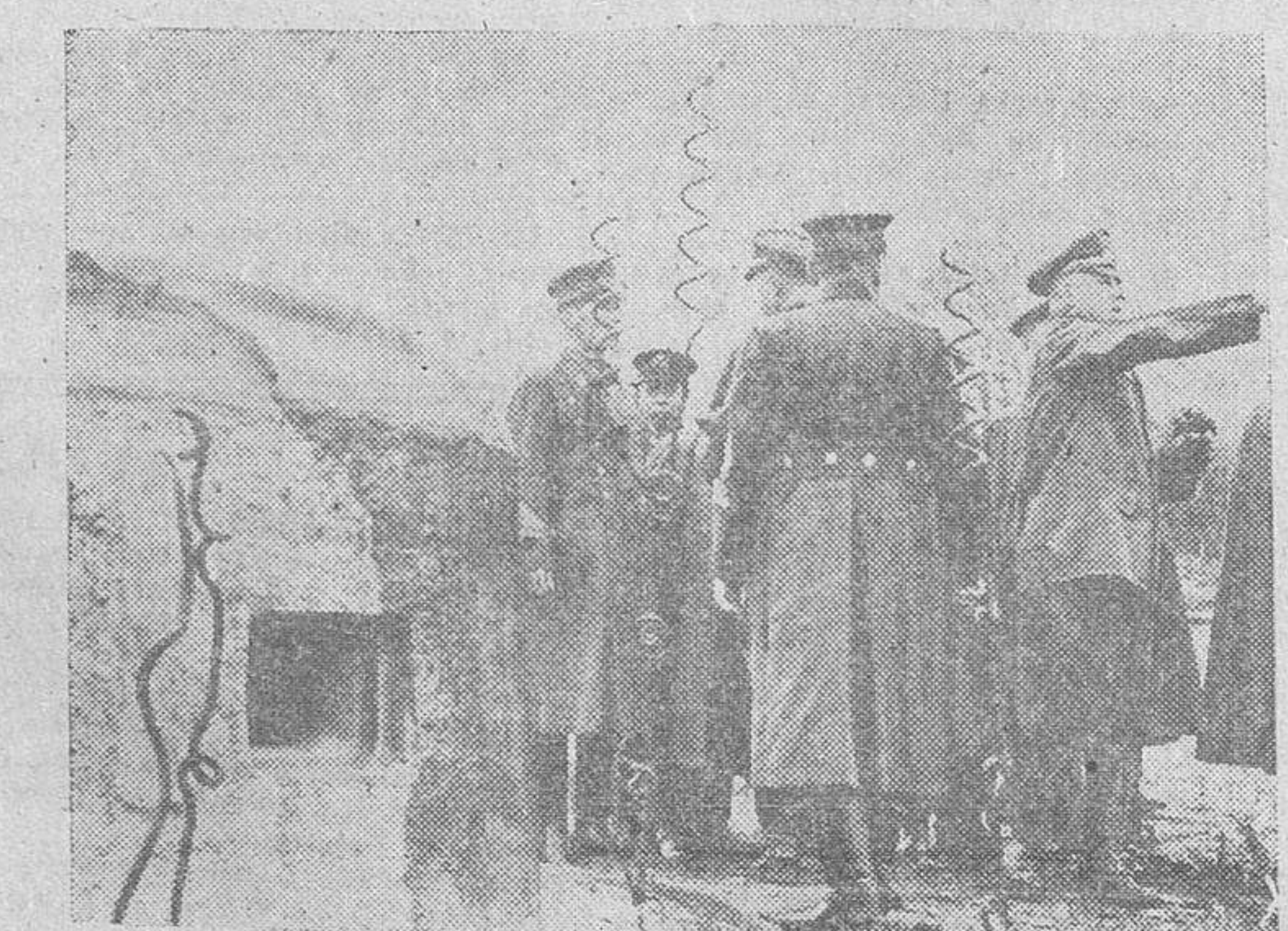
Una comisión de oficiales japoneses recorre detenidamente las fortificaciones alemanas en la costa atlántica