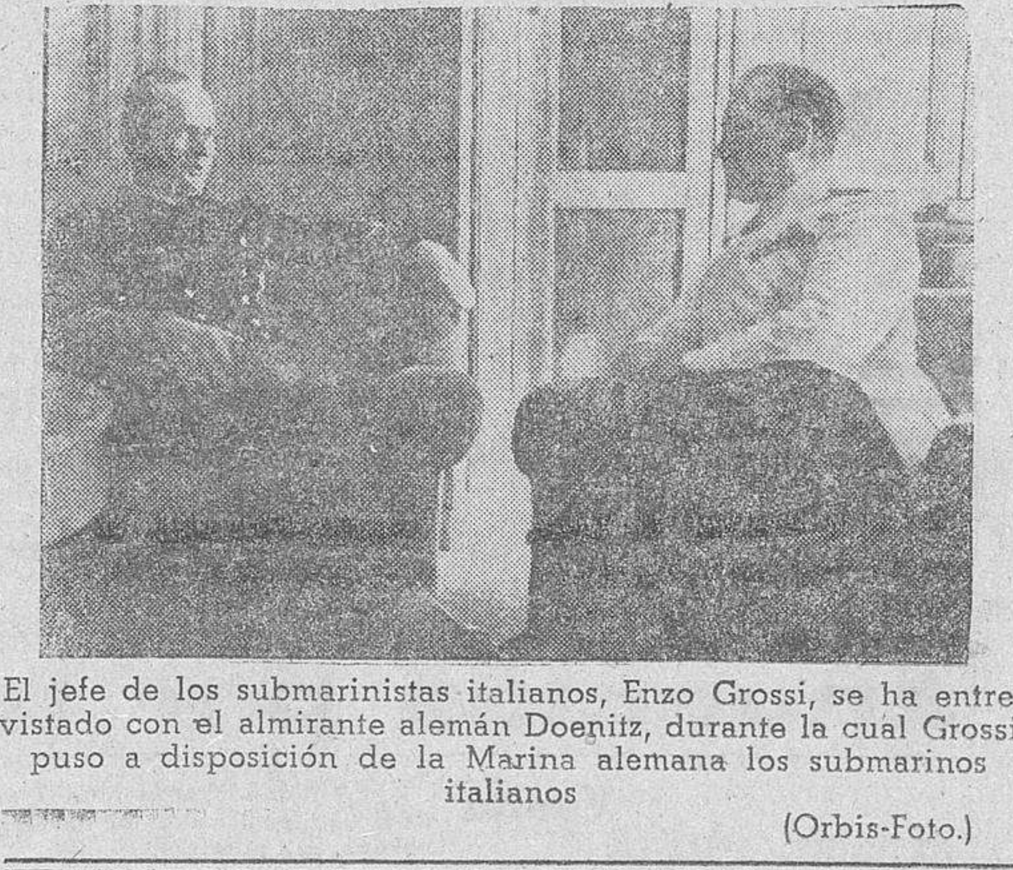
El jefe de los submarinistas italianos, Enzo Grossi, se ha entrevistado con el almirante alemán Doenitz, durante la cual Grossi puso a disposición de la Marina alemana los submarinos italianos (Orbis-Foto).

Se ha distinguido especialmente en los combates de la isla de Córcega una brigada de asalto de las S. S. (Efe.) Comunicado aliado Argel.—Comunicado del Cuartel general aliado de África del Norte: "El V Ejército ha proseguido su avance, a pesar de los obstáculos, en aumento, que se oponen a su marcha con destrucciones, incendios y minas a lo largo de la ruta seguida por dichas fuerzas. Continúa aceleradamente la llegada de reservas a nuestra vanguardia y la reparación de los puntos." El VIII Ejército ha entrado en contacto con fuerzas enemigas al oeste de Termoli y en la línea general del río Biferno. Se desarrolla una enconada batalla. Actividad de la Aviación: Bombarderos pesados de la aviación del noroeste de África atacaron ayer la estación ferroviaria de Bolonia, así como los talleres y depósitos de carburante de la misma, en los que provocaron grandes explosiones. Hubo fuerte oposición del lado enemigo. Bombarderos medios atacaron corrientes y puentes en Formia, Ischia y Mignano.