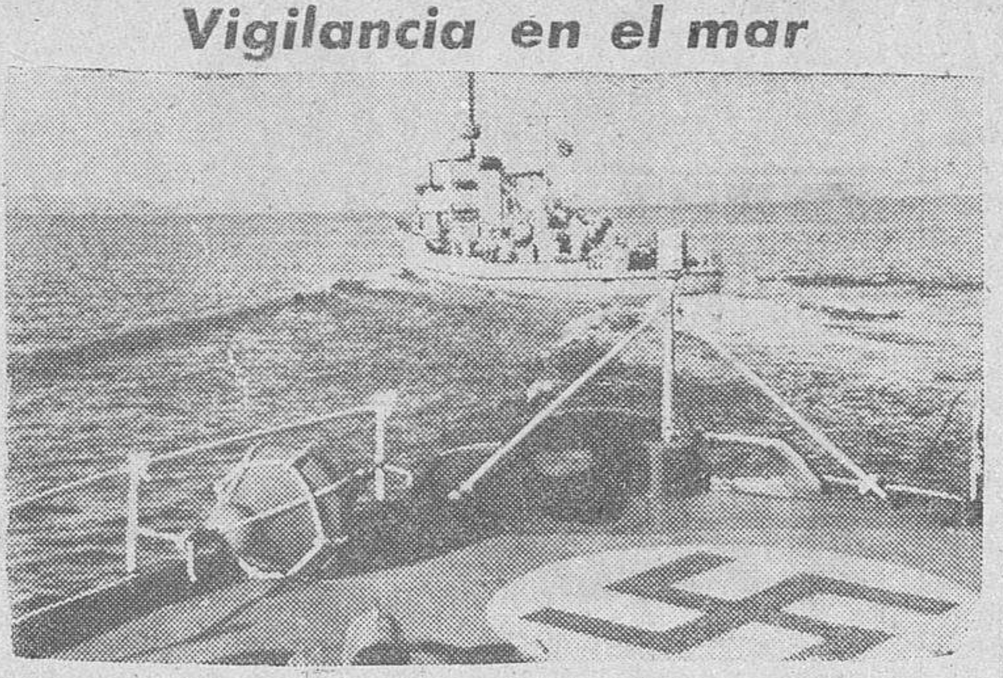
Barcos patrulleros de la marina del Reich, en servicio de vigilancia y observación.

Notas ampliatorias del comunicado. Berlín.—La Oficina Internacional declara, acerca de la situación en el frente del Este: Ayer continuó la lucha casi con la misma violencia que en días anteriores en los puntos neurálgicos del frente oriental. En la península de Taman fué cercado un grupo soviético de unos dos batallones, desembarcados en la retaguardia alemana y que quedó aniquilado, dejando 150 prisioneros. Fueron contados 350 bolcheviques muertos. El botín es considerable, comprendiendo, sobre todo, armas pesadas y automáticas. Por lo demás, la actividad en la cabeza de puente del Kuban se limitó a algunos ataques locales de los soviets, que fueron rechazados. Al norte del Mar de Azov prosiguieron los granaderos alemanes el ataque iniciado la víspera, en el que fué ocupada una localidad situada en una loma, y conquistaron otra, rechazando los ataques soviéticos realizados para recobrarla. Los rojos continúan los movimientos encaminados al des-