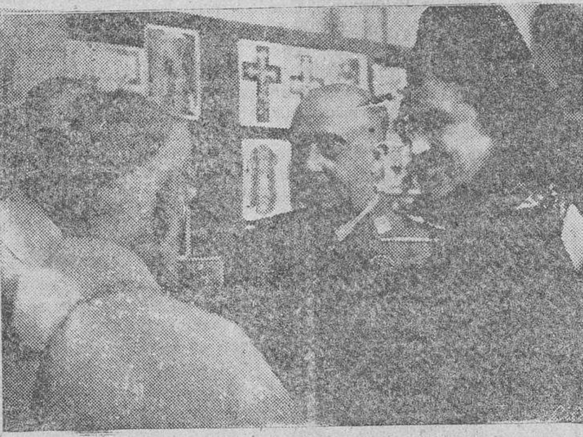
S. E. el Jefe del Estado, Generalísimo Franco, acompañado de su esposa y del ministro de Educación Nacional, conversa con uno de los prelados, en la Exposición de fotografías inaugurada con motivo de las fiestas del Milenario.

mite de la provincia de Guipúzcoa, saludó a Su Excelencia una centuria del Frente de Juventudes, sección de montañeros. En todos los pueblos saludaron a Su Excelencia los alcaldes, concejales autoridades y jerarquías locales, y fué objeto en todas partes de entusiastas muestras de adhesión.