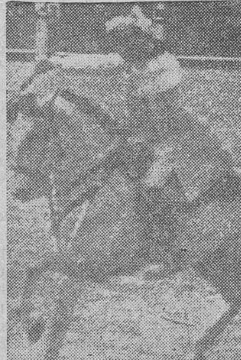
Simao da Veiga

Para la corrida del día 14 ha sido contratado el famoso rejoneador portugués Simao da Veiga. Si siempre ha sido del agrado de los aficionados salmantinos—tan aficionados al caballo como al toro—la inclusión de un rejoneador en los carteles de la feria, en esta ocasión lo es mucho más, porque Simao da Veiga es el torero de a caballo que más prestigio tiene.