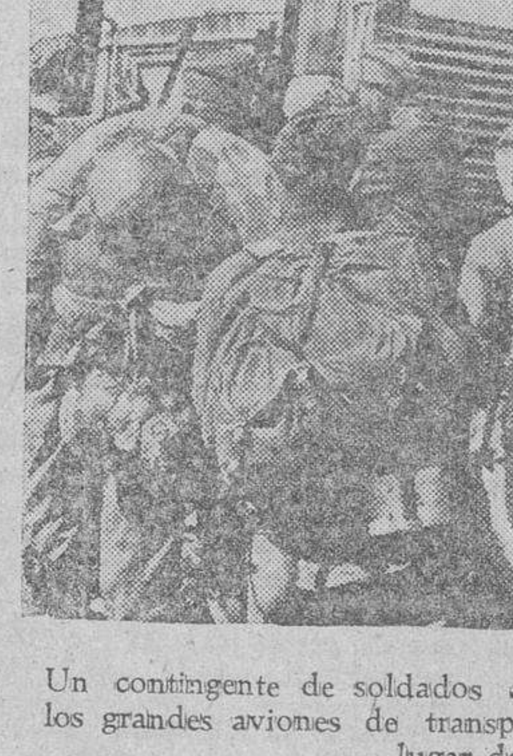
Un contingente de soldados alemanes se dispone a subir a los grandes aviones de transporte que lo trasladará a otro lugar del frente