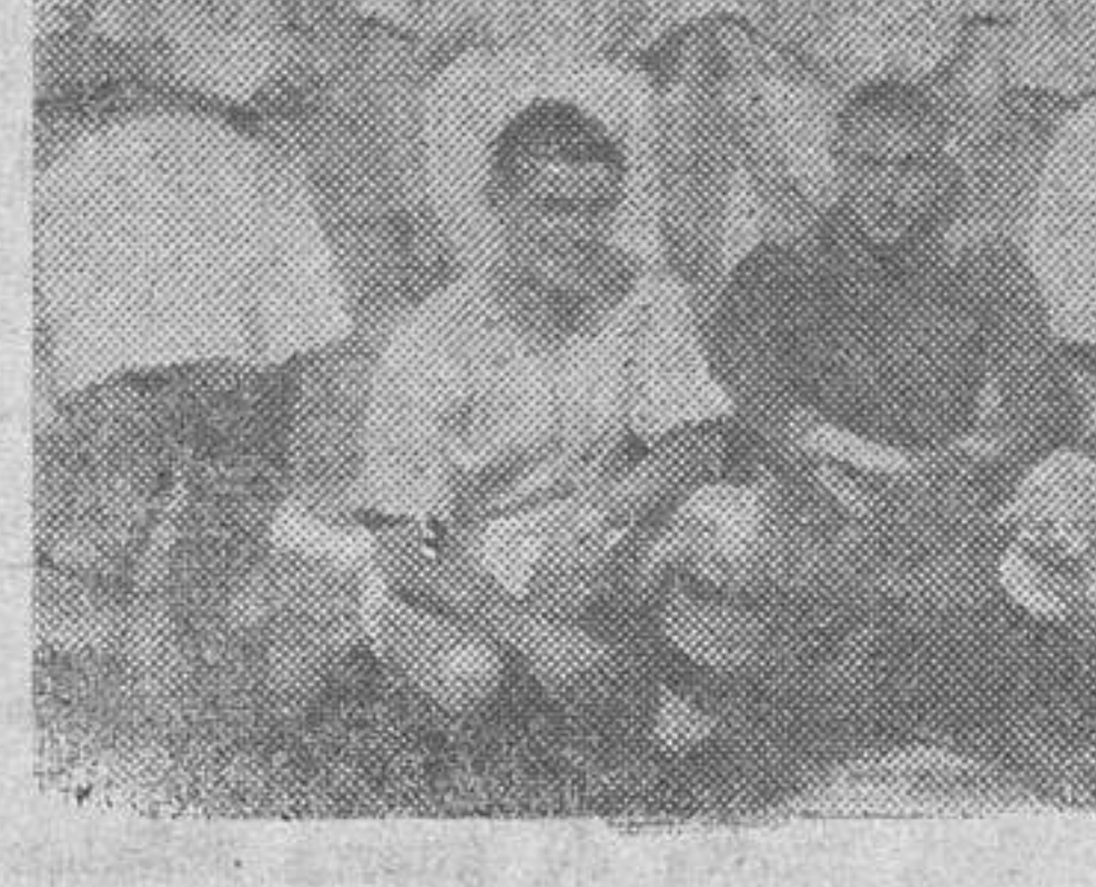
El equipo vallisoletano

Seguro, pero de tosco estilo y muy poco amigo de las salidas, junto al del fino interior madrileño.