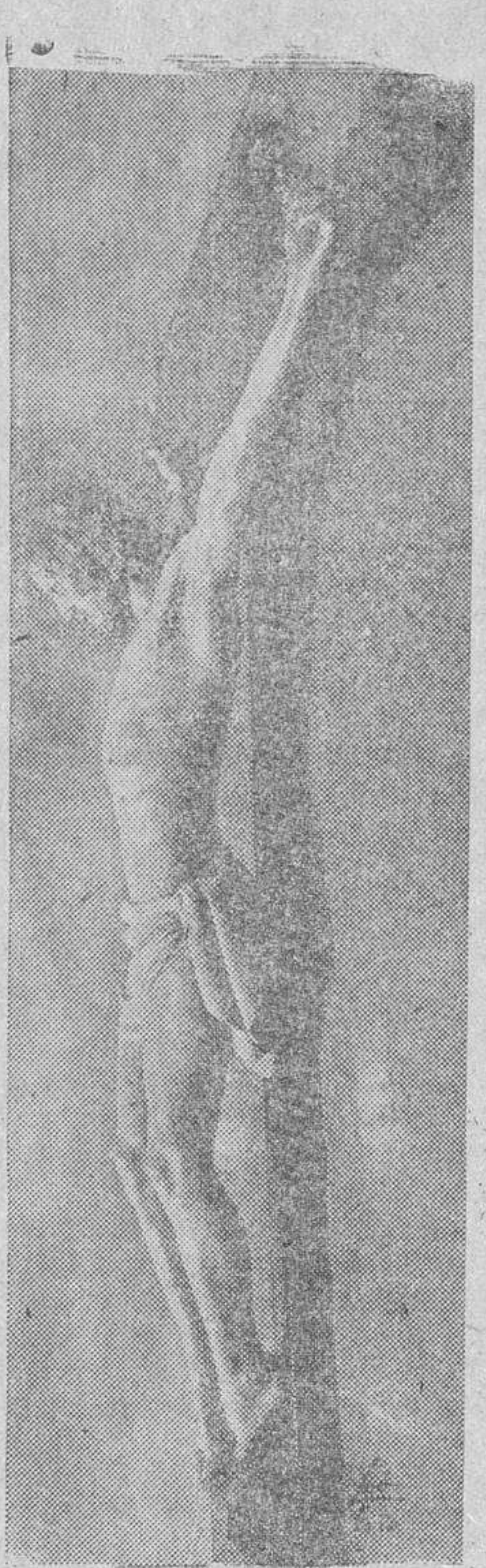
El Santo Cristo de los Mártires, escultura de González Macías, para Gijón, y a cuya imagen el Gobierno ha concedido honores de capitán general

Padeciendo y muriendo el hombre, no redimía el Hijo de Dios; Víctima y Sacerdote. Expiación y Modelo.