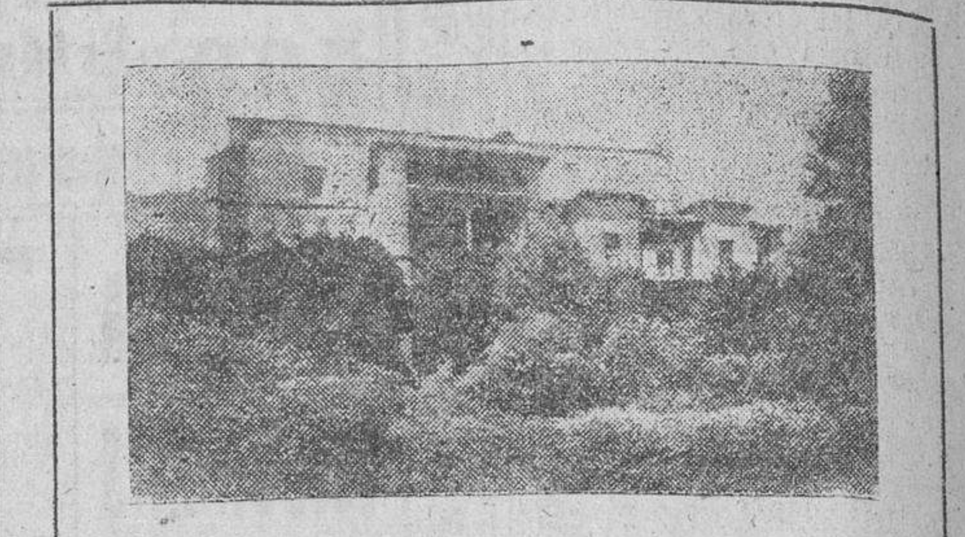
Vista del Monasterio de Yuste