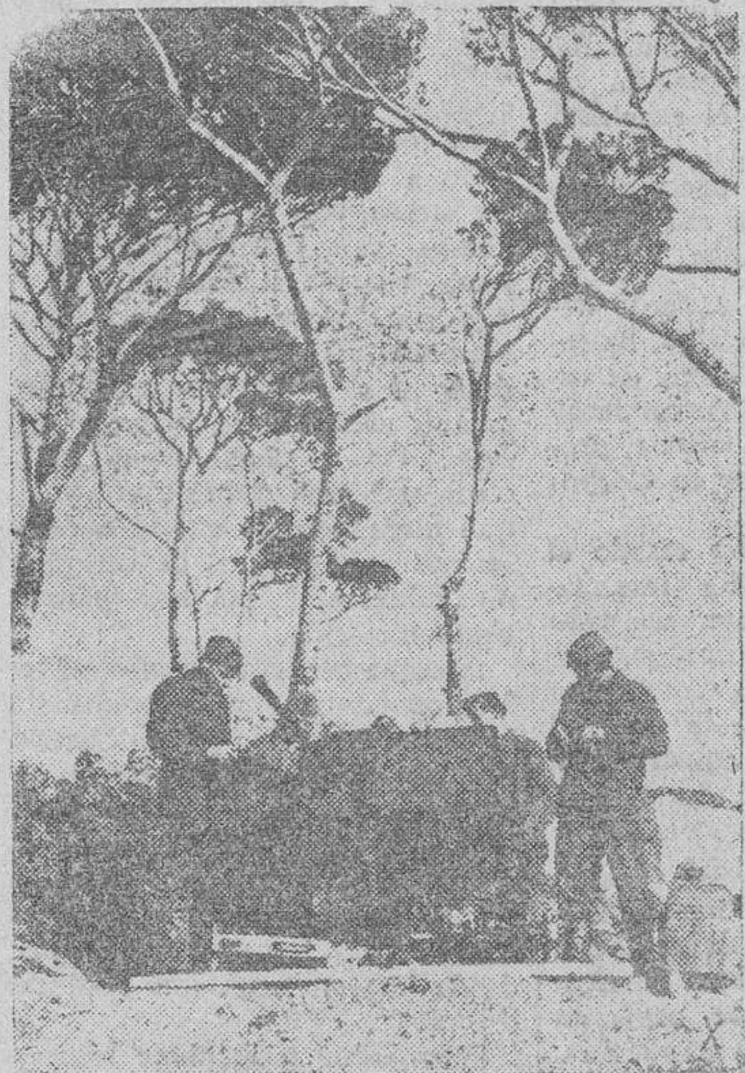
Un puesto de artillería antiaérea en la costa francesa del Mediterráneo

Argel.—Las noticias sobre la situación militar de Túnez acusan pocas novedades. No obstante, reina gran ansiedad en estos momentos sobre el futuro inmediato de las operaciones. Esta ansiedad provoca cierta confusión en las informaciones.