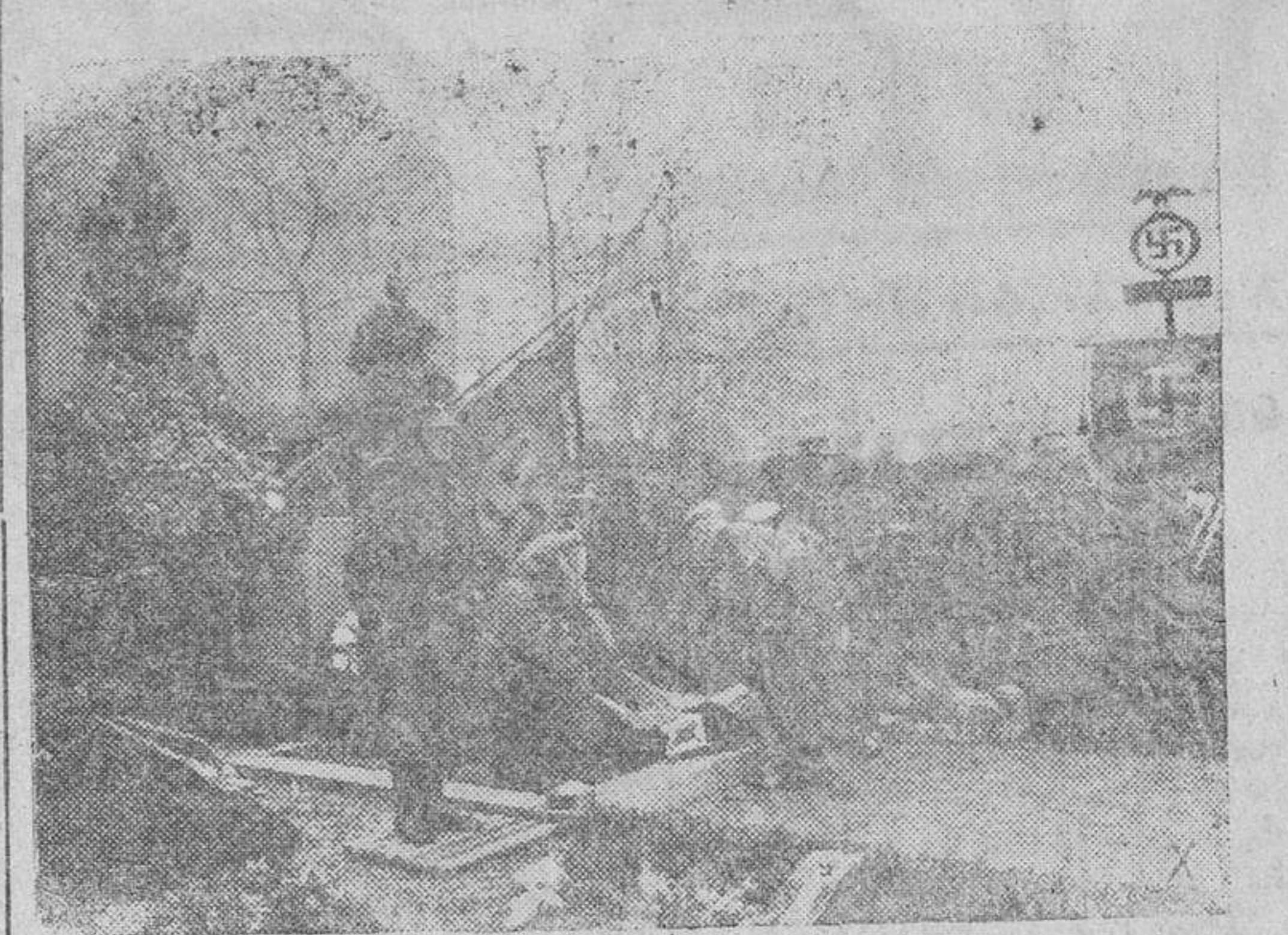
En memoria de Horst Wessel, el héroe del nacionalsocialismo alemán, muerto por defender sus ideales, fué organizado recientemente un solemne acto en Berlín. La foto recoge el momento en que es depositada una corona sobre la tumba de Horst Wessel.