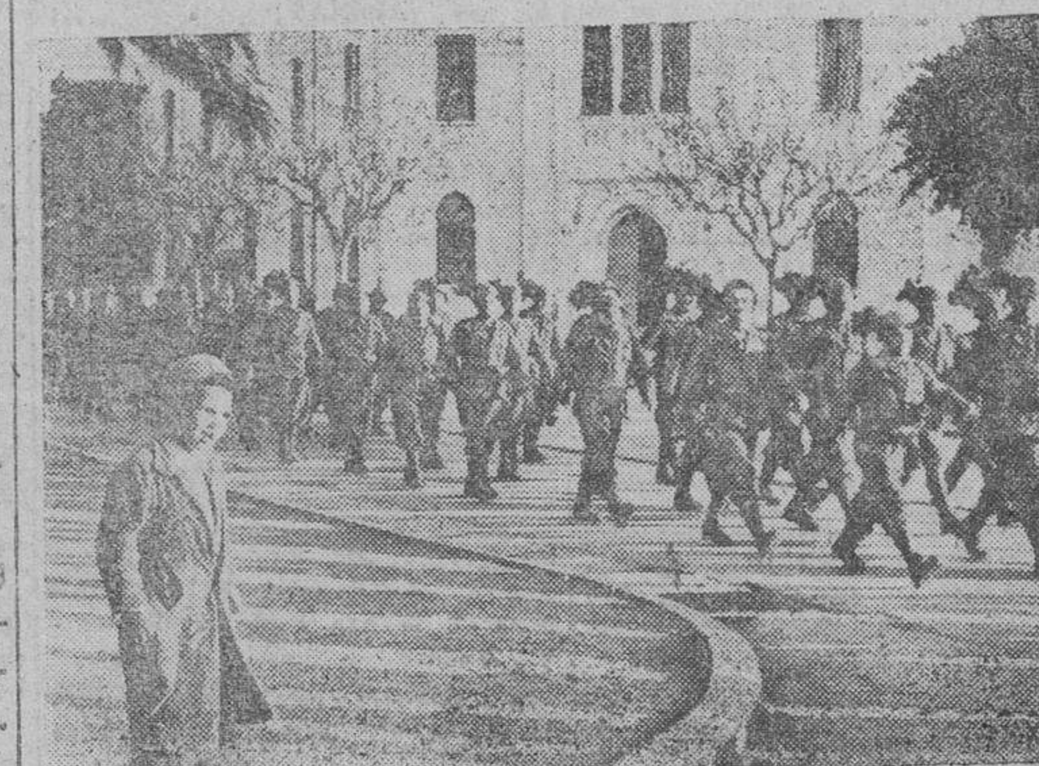
Desfilando italianos avanzando un pueblo tunecino