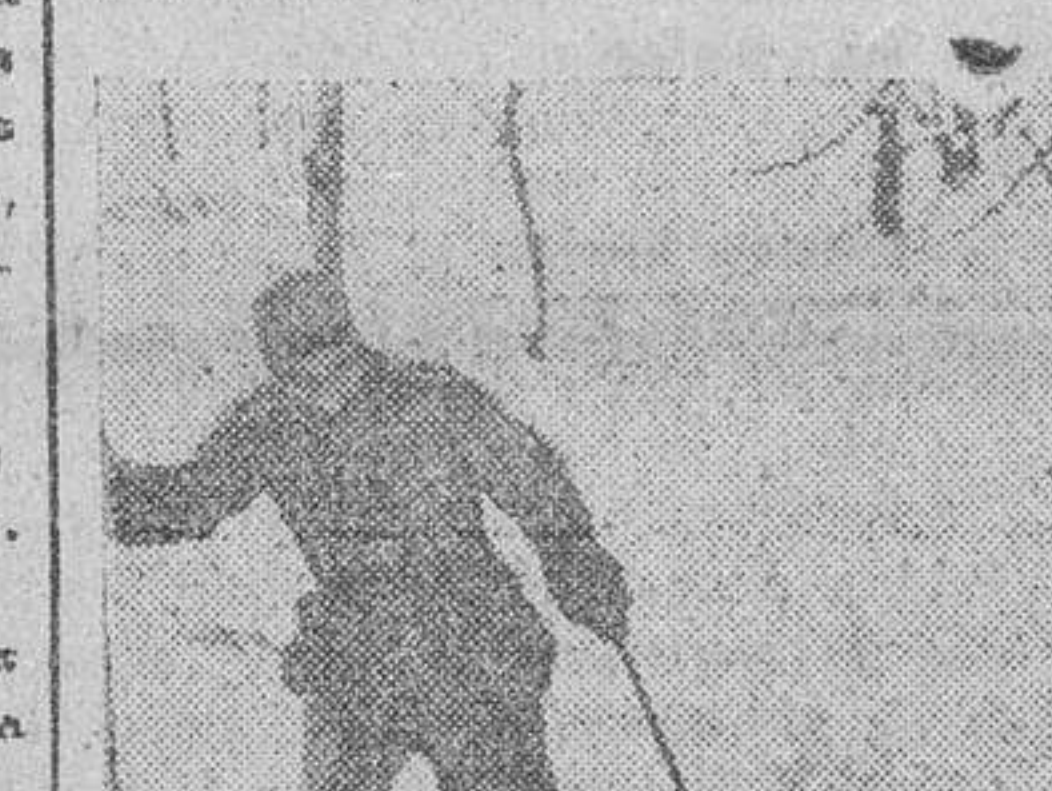
Una compañía de esquiadores españoles en servicio de reconocimiento

se las trincheras nuestras. Precisamente, a todo trance, no perder la posición ventajosa de defensa; por otra parte parecía imposible, en la noche y sobre un terreno totalmente desconocido, orientarse. Pronto comenzó un violento ataque de masas rusas contra el frente nuestro. Se organizaron puntos de resistencia