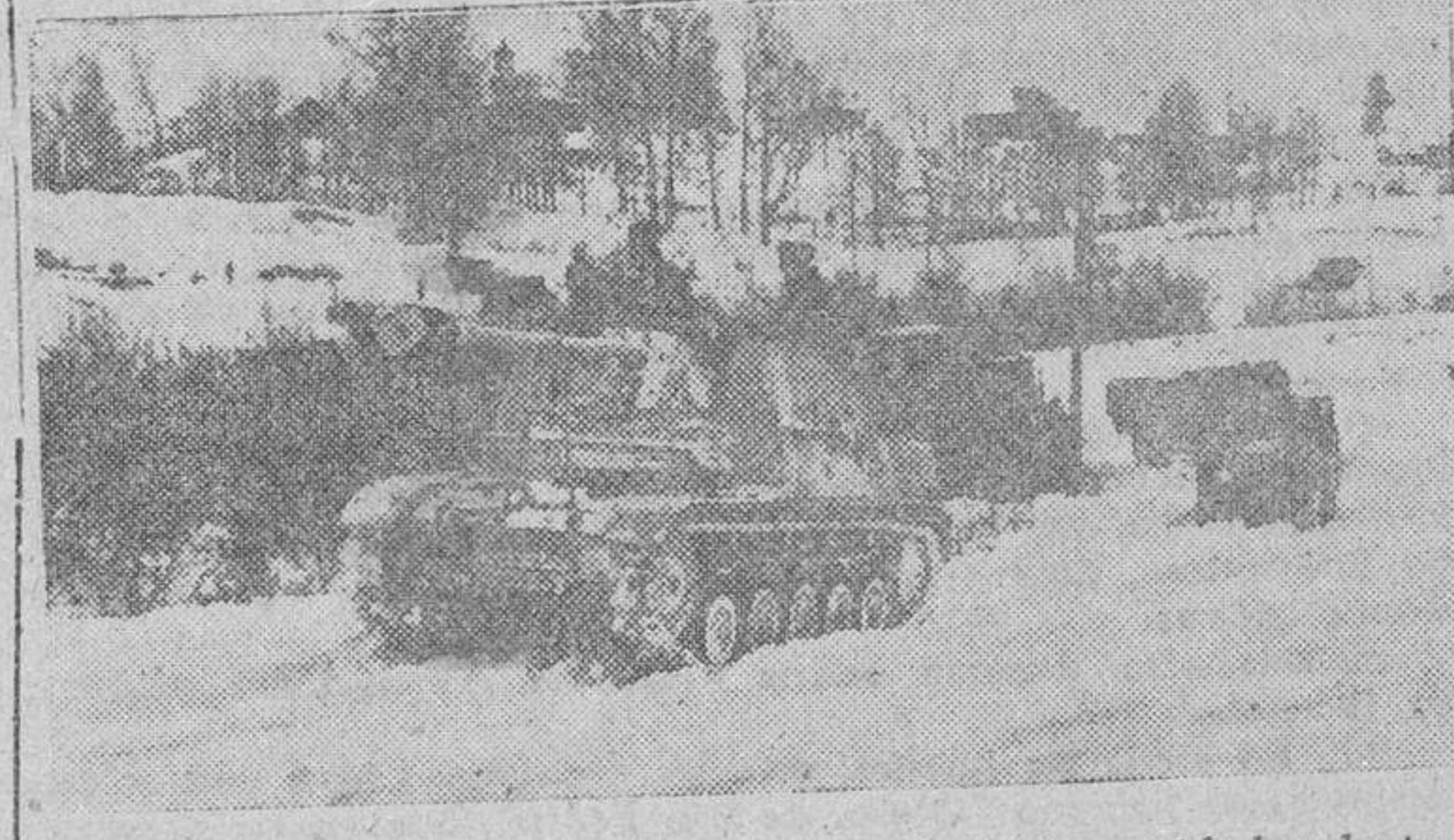
Tanques alemanes protegiendo el avance de las unidades de infantería

Londres. — El Ministerio de Seguridad Interior anuncia haber recibido 178 muertos y 60 heridos en un accidente ocurrido anoche en un refugio antiaéreo de Londres. Dos mil personas se hallaban en él cuando una mujer con un niño en brazos cayó al pie de la escalera que comunica el refugio con la calle. En un momento, centenares de personas se vieron una encima de otras, y las que