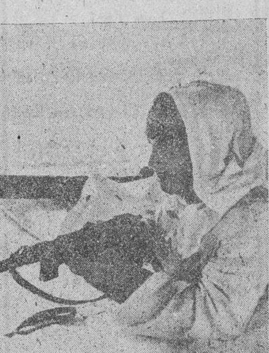
Una compañía de esquiadores españoles en servicio de reconocimiento

dispuesta para la marcha, comenzó un violentísimo combate de artillería, desde las trincheras, situadas, como acabo de decir, a varios centenares de metros delante de nosotros, se inicia el fuego intenso de fusilería que hacía presumir haber comenzado un ataque por sorpresa. Desde aquel instante, hasta las cinco de la madrugada, se generalizó la lucha; el capitán dió orden de avanzar hacia el lugar donde, según los informes comunicados por el general, debían encontrar-