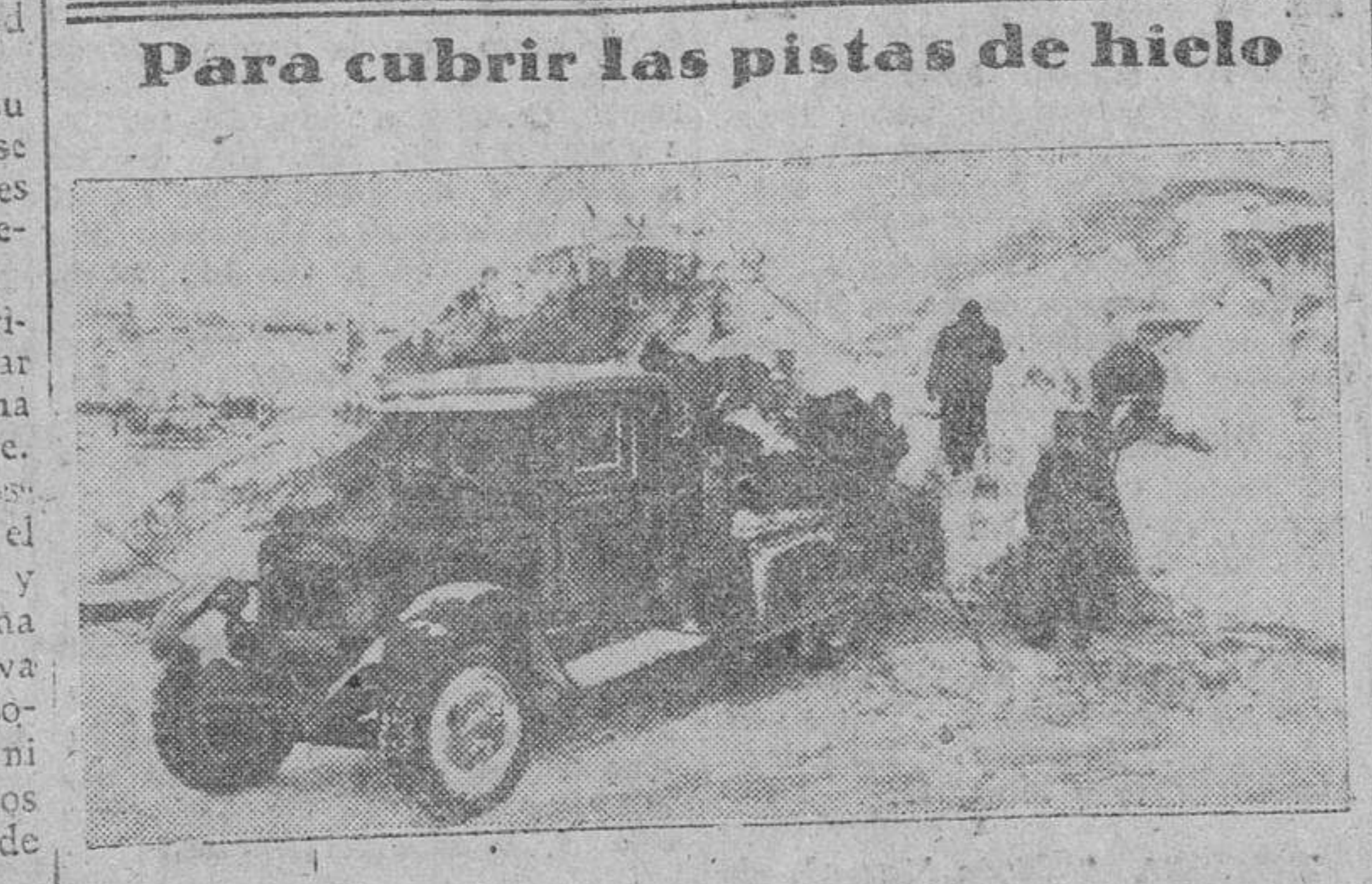
Para la marcha de las columnas motorizadas alemanas, se cargan camiones de arena, que después cubren los caminos helados del frente soviético

Después de la misa, los peregrinos dispondrán de media hora para desayunar, y a los que deseen, les será servido un desayuno de café con leche y pan por las obreras de las Compañías del Sagrado Corazón de Jesús del Cerro de los Angeles.