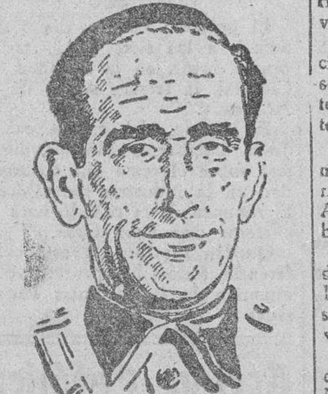
El teniente general Muñoz Grandes, designado jefe de la Casa Militar de Su Excelencia

Policías españoles que distéis la vida por la Patria: ahí queda un monumento que dice cómo mueren los valientes. Yo sé de vosotros. Cuervo de Policía—terminó diciendo el ministro—que si llega el momento, seréis capaces de emular las glorias de los que cayeron. Viva Franco. Arriba España.